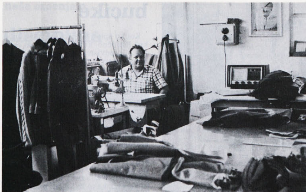
Iz oddelka po meri v Tip-topu.