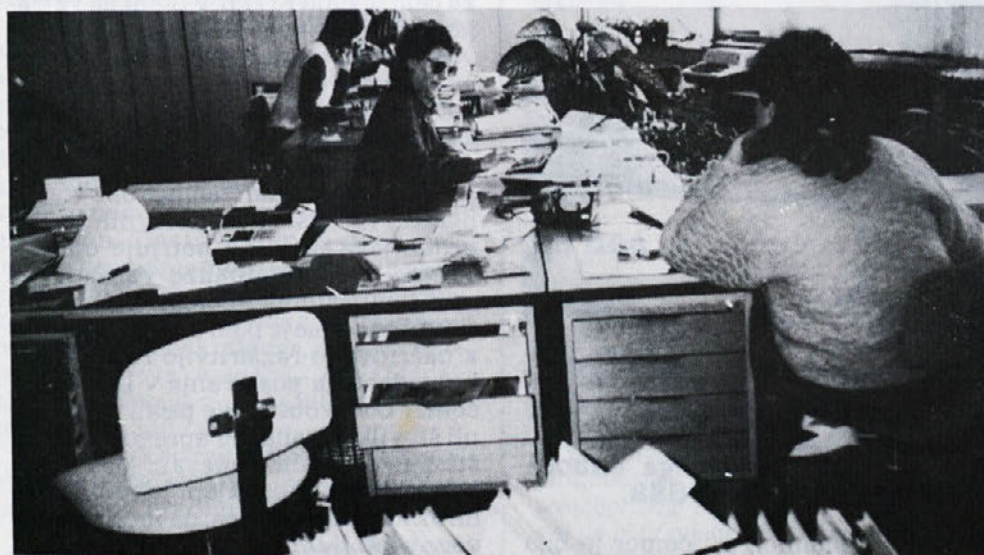
Računovodstva so imela poleti veliko dela, saj je bilo treba pripraviti vse za polletni obračun. Posnetek je iz Libne.

Metražerji so v težavah, kar občutimo tudi mi. Povečan je pritisk za tekočo dobavo. Občutna povišanja cen metražerjev ne sprejemamo — zaenkrat, pripravljeni pa moramo biti na občutno višanje cen za tkanine za naslednje kolekcije. Vemo, da so se surovine za metražerje močno dvignile zaradi dviga cen na zunanem tržišču in zaradi devalvacije. Zato je realno pričakovati dvig cen osnovnih surovin.«