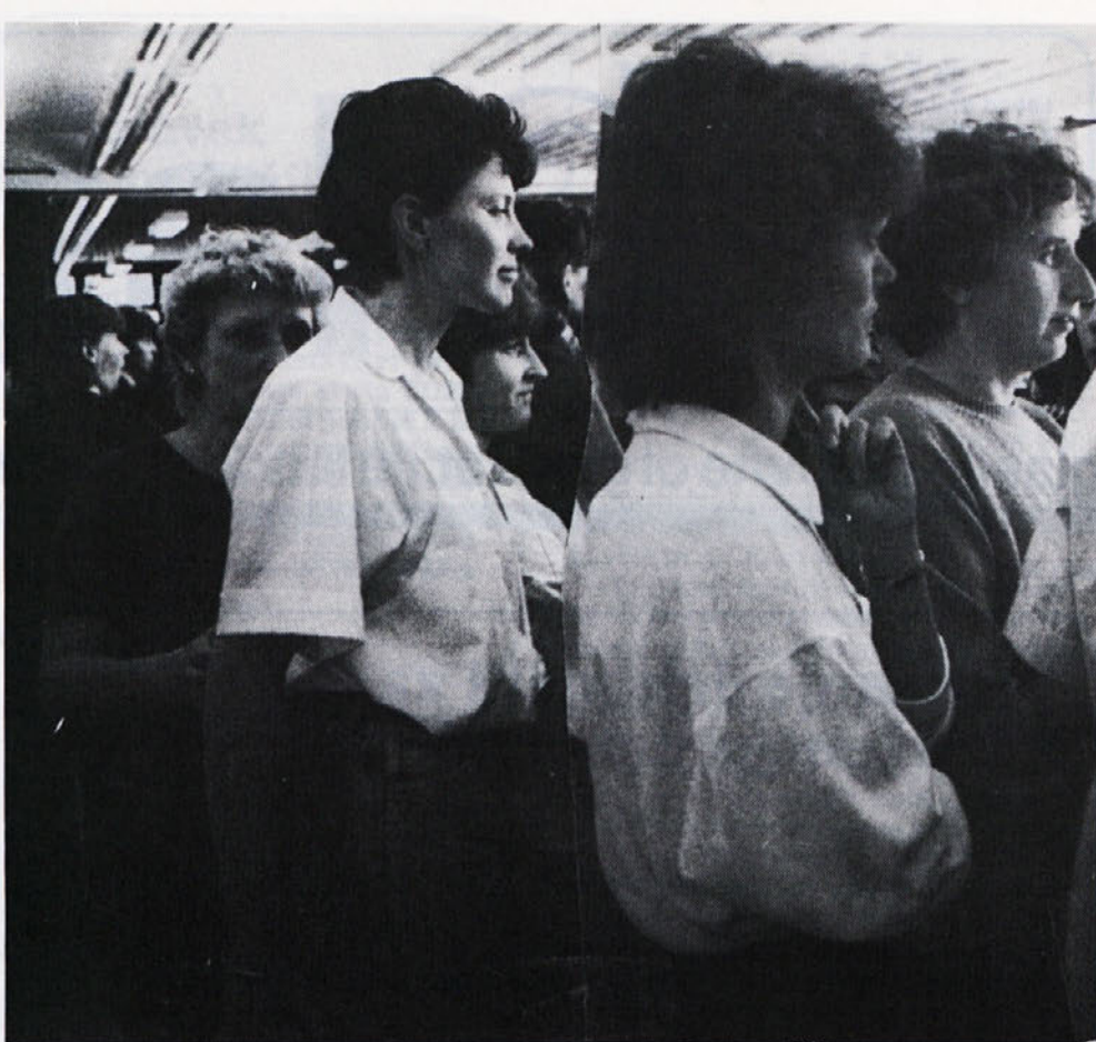
Na letošnjem občinskem tekmovanju enot prve medicinske pomoči v Novem mestu je sodelovala tudi ekipa deklet iz Ločne, Commerca in DSSS. Tako nestrpno so čakale na svoj nastop. Uvrstile so se v »zlato sredino«

»To je zelo kočljivo področje, vendar je povsem jasno, da časi za kakšne popravke cen — to je za dvig — niso primerni. Poznamo tržne možnosti, zato bo nujno treba poiskati notranje rezerve v že zaključenih cenah za je-