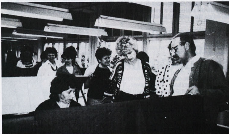
V programu praznovanja je bil letos tudi obisk Novoteksa. Z zanimanjem so si Labodovci ogledali proizvodnjo tkanin in konfekcije, v pogovoru s prijaznimi gostitelji pa je tekla beseda o družbenem standardu, opremljenosti, delu za izvoz, skratka o temah, ki so nam tekstilcem blizu.