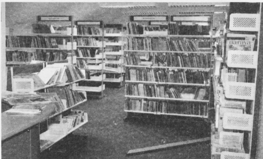
Knjige vabijo, da jih preberemo

• Krajevna skupnost je bila organizator treh nadvse uspešnih kulturnih prireditev; najprej je bil koncert vokalne skupine Freya, poleti nas je razveselil nastop Tria Lorenz, že v prednovoletnem vzdušju pa smo prisluhnili Solistom iz St. Petersburga. Pričakujemo, da bomo drugo leto že vključeni v cikel kulturnih prireditev, imenovanih Podoba Slovenije.