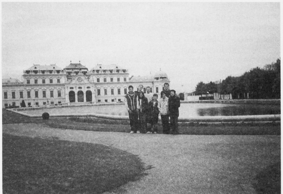
Gledališčniki pred dvorcem Belvedere