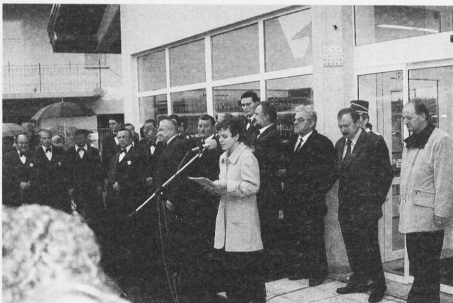
Prazničnemu vzdušju so pripomogli tudi gostje