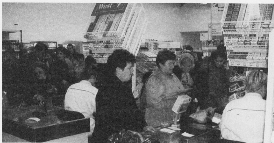
Trgovina je že v prvih dneh privabila številne goste