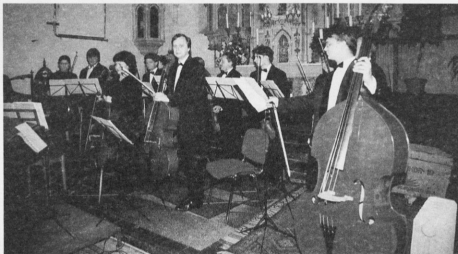
Solisti iz St. Petersburga so navdušili

Uspehi so nam spodbuda za nadaljnje delo!