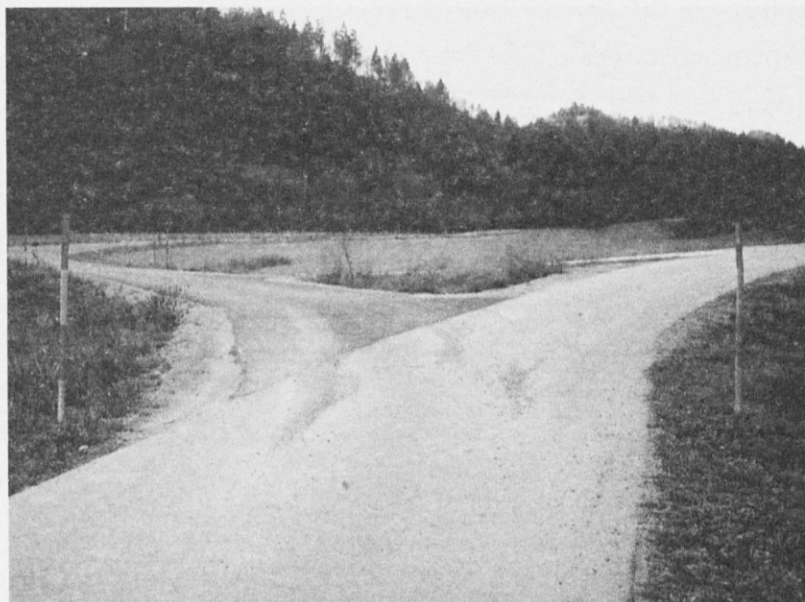
Končno tudi asfalt v Globokem (Hrastno - Roženberk)

• Krajevna skupnost bo od Kmetijske zadruge Trebnje na trgu kupila Kostelčevo hišo. Polovico kupnine smo plačali letos, ostalo pa bo v prihodnjem letu.