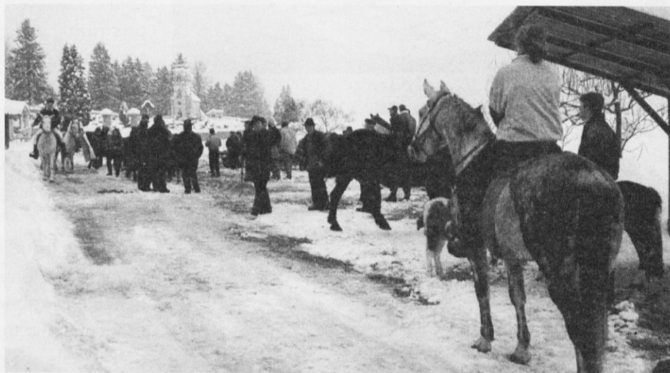
Štefanovo 1999

Konjeniško društvo Šentrupert tudi letos vabi vse lastnike konj na blagoslov konj, ki bo na štefanovo, v torek, 26.12.2000, ob 11.30. uri pred cerkvijo sv. Ruperta. Lastniki se bomo s svojimi konji zbrali ob 11. uri pred domom kulture in v sprevedu krenili do cerkve. Po blagoslovu pa vabimo vse lastnike konj kot tudi vse ostale krajanje, da se nam pridružijo v domu kulture, kjer se bomo poveselili s skupino Vene in pogovorili ob žrebičkovem golažu ter kozarčku domačega cvička. Vabljeni!