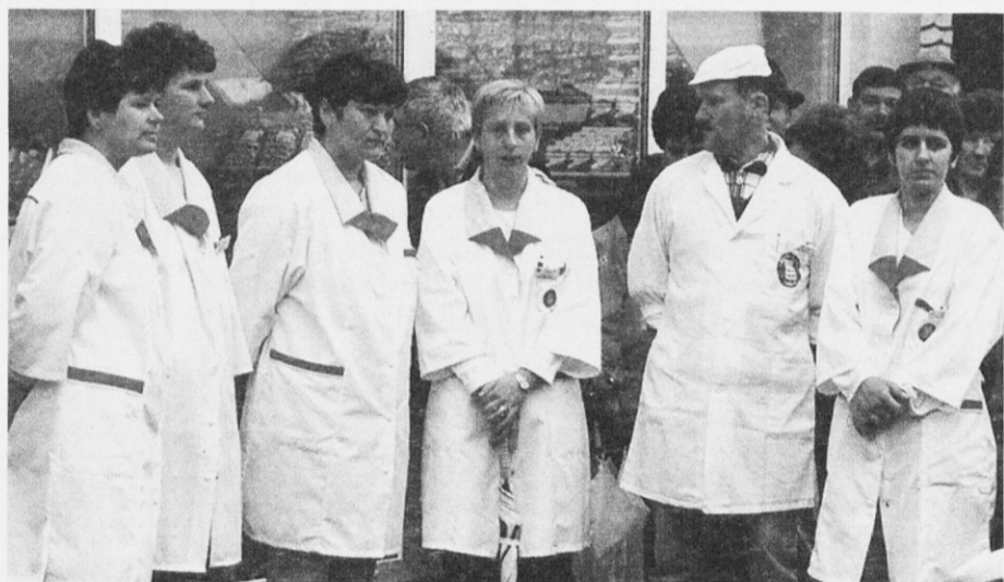
Osebjje je pripravljeno, da postrže številne obiskovalce