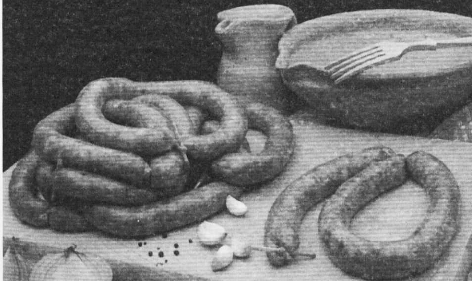
Iz domače delavnice

Na Slovenskem so koline ali klaje, kot rečemo pri nas, že od nekdaj pomemben domači praznik. Že od samega začetka niso koline pomenile le zakol prašiča in priprava svežih in suhih mesnin, ampak so koline spremljale še družabne in zabavne dejavnosti, saj so na domači praznik povabili domače in vaščane. Povabilu na koline se niso smeli odreči, kar dokazuje, kako pomemben posvetni družinski in družabni praznik je bil to. Najpogosteje so imeli koline pred božičnimi prazniki; tako so se vaščani dobro najedli in se zabavali. Praznik je imel tako pomembno prehranjevalno vlogo, hkrati pa je med seboj povezoval družine na vasi.