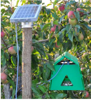
Slika 1: Moderna feromonska vaba, opremljena s kamero za štetje žuželk Trapview