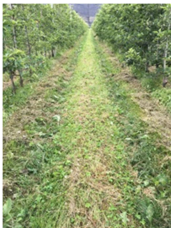
Slika 25: Primerno obraščena negovana ledina – viden začetek formiranja kolotečin