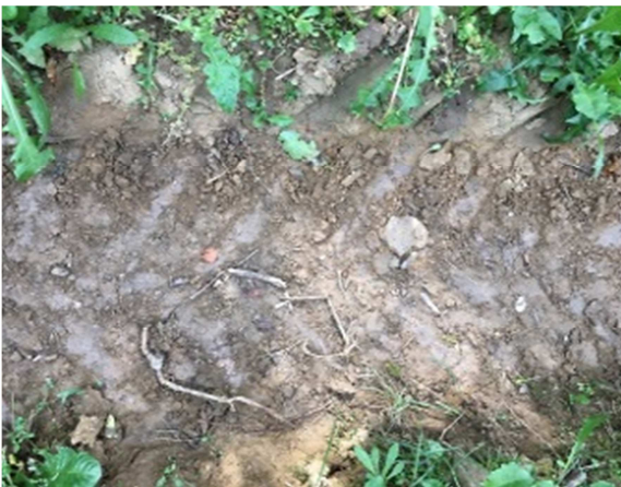
Slika 32: Primer široke popolnoma neobraščene kolotečine