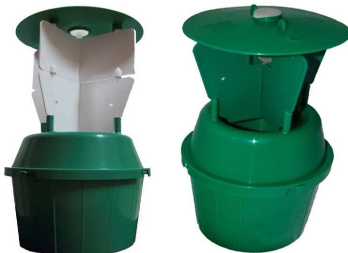
Slika 9: Ohišje za pripravo kombiniranih vab (Sentamol Byturus Trap) za lov malinarja ( Byturus tomentosus ) – levo in (Sentamol Anthonomus Trap) za lov jagodnega cvetožera ( Anthonomus rubi ) – desno

Opis zatiranja škodljivcev z omejitvami uporabe insekticidov (število uporab) za posamezne sadne vrste je v prilogi 2 teh navodil. Besedilo je povzeto iz priloge 8 uredbe.