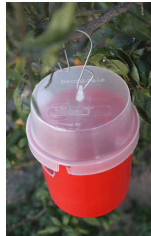
Slika 4: Drosotrap – kombinirana prehranska in barvna vaba za lov plodove mušice