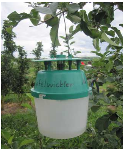
Slika 3: Feromonska vaba s tekočino za lov jabolčnega zavijača