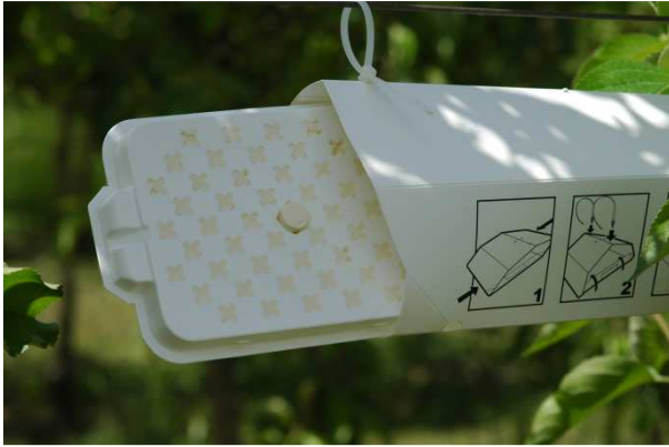
Slika 14: Vaba, ki je prepojena z namagnetenim feromonskim prahom, ki se prilepi na telo samcev jabolčnega zavijača, kar omogoča izvedbo metode auto-zbeganja (v Sloveniji se prodaja pod znamko Exosex)