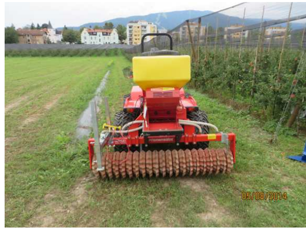
Slika 23: Sejalnica z rebrastimi koluti

Glede na določbe uredbe se mora rastje negovane ledine do 15. oktobra tekočega leta vsaj enkrat zmulčiti oz. pokositi. Vemo, da rastni stadij rastlin zelene ledine ob izvedbi mulčenja značilno vpliva na hitrost mineralizacije ostankov po mulčenju. Pri pogostem mulčenju mladih rastlin je mineralizacija hitra, po mulčenju ostarelih, značilno olesenelih rastlin je mineralizacija počasnejša. V sodobnem sadjarstvu uvajamo mečkanje rastlin zelene ledine. Ta pristop omogoča, da zmanjšujemo konkurenčnost rastlin gojene ledine podobno, kot pri mulčenju, vendar je ruša, ki je bila pomečkana bistveno bolj ugoden prostor za koristne žuželke (opraševalci, predatorske žuželke, ...) kot negovana ledina, ki je pogosto mulčena. Več je cvetočih rastlin in metuljnic, ki so ugodna paša za čebele. Če se odločimo za ta pristop, potem v začetnih obdobjih poletja izvajamo mečkanje rastlin ledine, pozneje pa mulčenje. Lahko pa obe opravili izvajamo izmenično. Glede na določbe uredbe zgolj mečkanje rastlin brez vsaj ene izvedbe mulčenja ni upravičen sistem za pridobitev podpore iz naslova izbirne zahteve SAD_POKT.