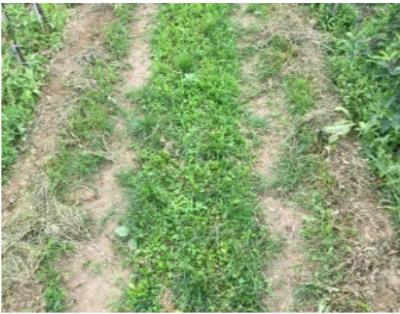
Slika 31: Slabša obraščena kolotečina, ki pa niso izrazite, globina manj kot 5 cm