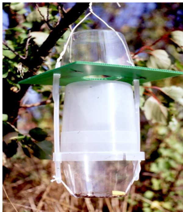
Slika 7: Vaba tipa (Csalmon VARs+) za lov jablanove steklokrilke ( Synathedon myopaeformis ) in ribezove steklokrilke ( Synathedon tipuliformis )