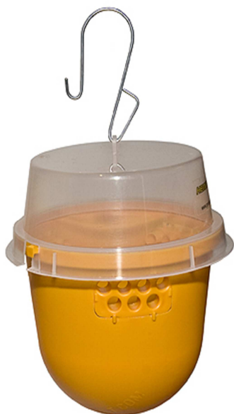
Slika 6: Ohišja ProboDelt za pripravo prehranskih vab za lov sredozemske ( Ceratitis capitata ) in oljčne muhe ( Bactrocera oleae )