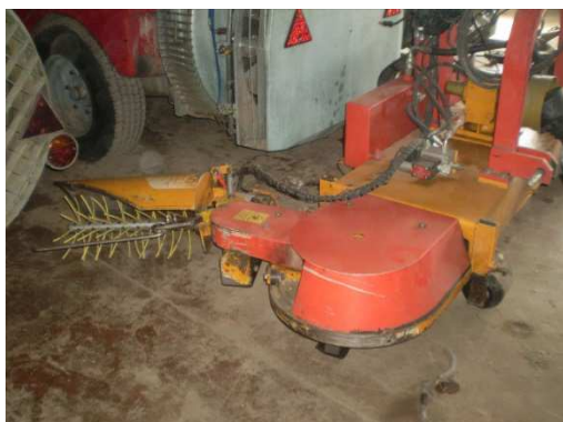
Slika 16: Standardni priključek na mulčerju za čiščenje plevela v vrsti