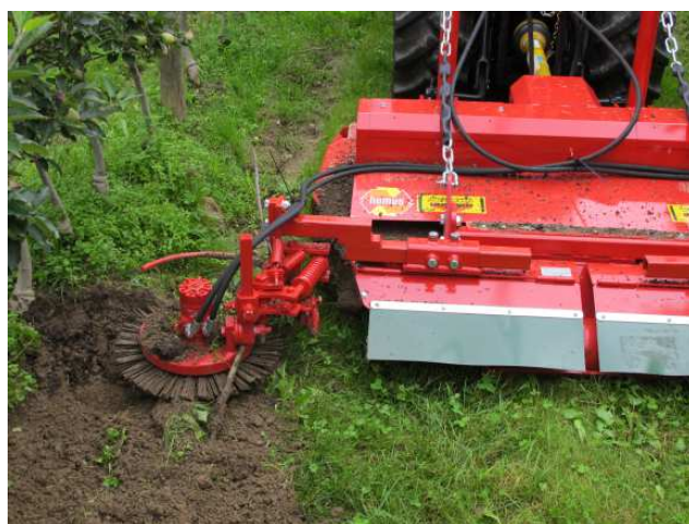
Slika 19: Univerzalni strojni element, primeren za različne priključke