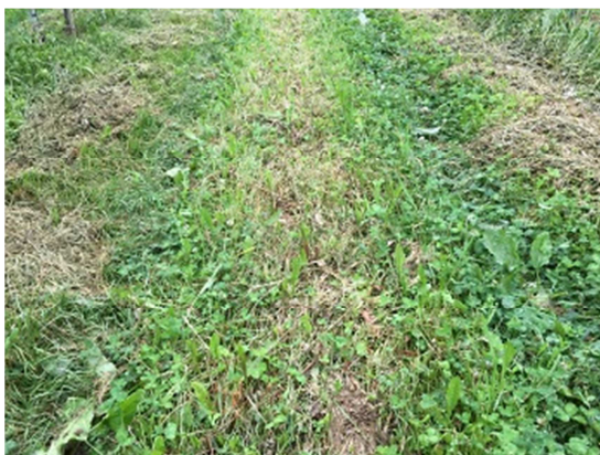
Slika 24: Primerno obraščena ledina