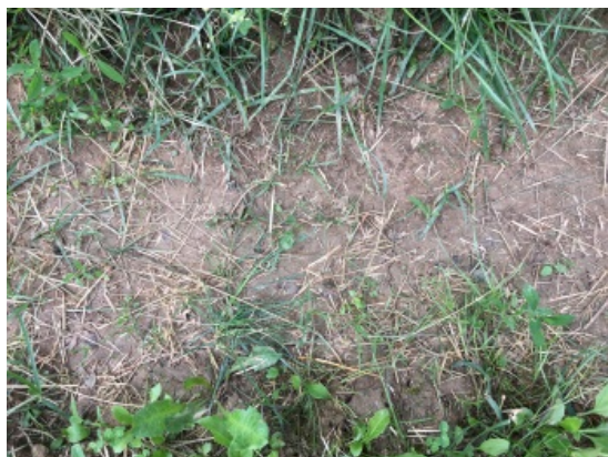
Slika 28: Primer slabše obraščeni kolotečin