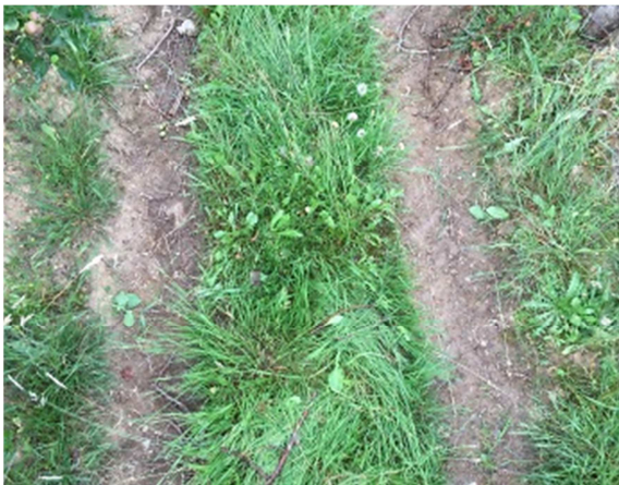
Slika 33: Popolnoma neobraščena kolotečina