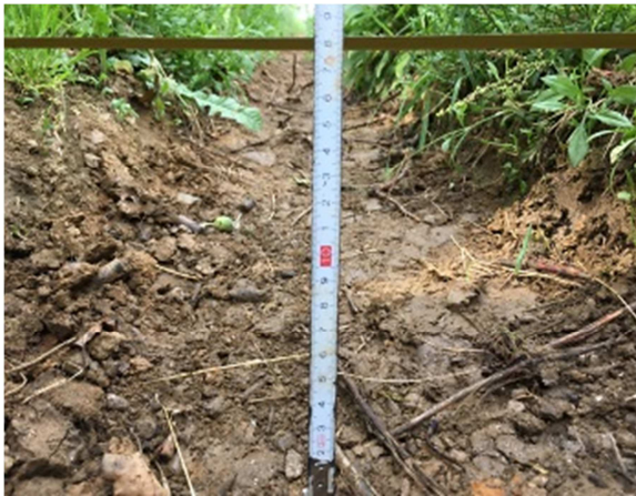
Slika 34: Primer kolotečine, globlje od 10 cm