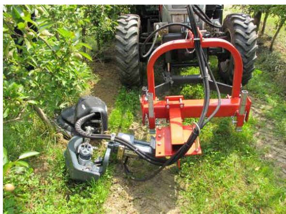
Slika 20: Čelni priključek za mehansko obdelavo v vrsti