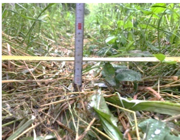
Slika 30: Globina kolotečine manj kot 10 cm, kolotečina še obraščena