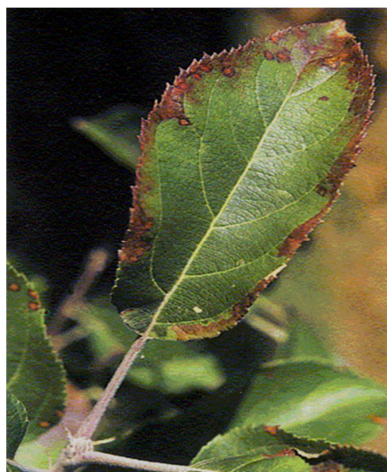
Slika: 11: Pomanjkanje kalija pri jablani