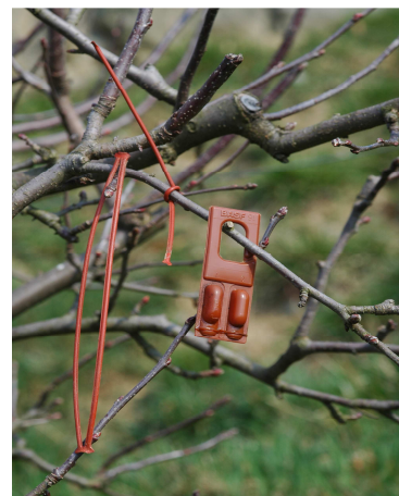
Slika 13: Standardni dispenzorji za sproščanje feromona