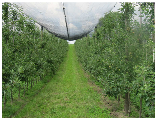
Slika 15: Primer vzdrževanja nizke podrasti v pasu pod drevesi

Slika 15 prikazuje pas pod drevesi z nizko podrastjo, ki se razvije po uporabi stroja za mehansko obdelavo tal. Na slikah 16 do 21 so prikazani nekateri stroji za vzdrževanje pasu pod drevesi.