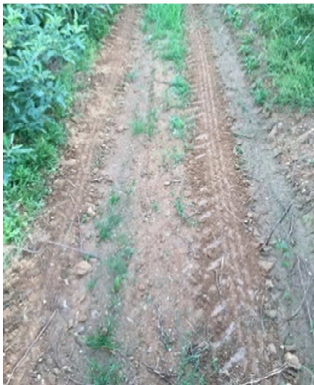
Slika 35: Neobraščen medvrstni prostor