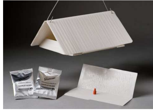
Slika 2: Standardna feromonska vaba v obliki hišice z ampulo za sproščanje feromona