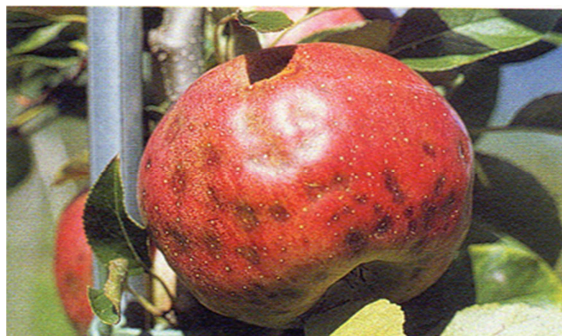
Slika 12: Pomanjkanje oz. nesorazmerje med Ca in drugimi hranili – grenka pegavost