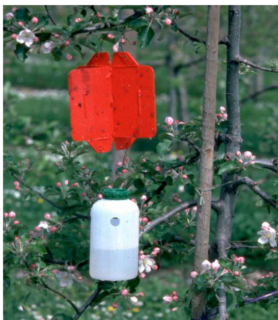
Slika 8: Kombinirana barvna in prehranska vaba (Rebell rosso) za lov vrtnega zavrtača ( Xyleborus dispar )