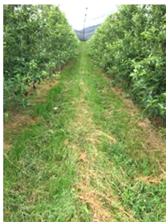
Slika 27: Primer mulčenja višje trave namenjenega za povečevanja trajnega humusa