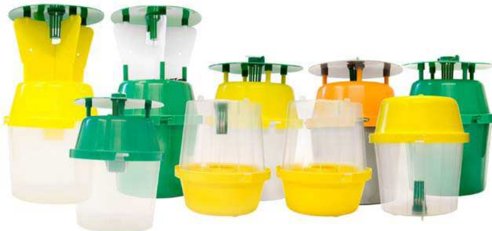
Slika 5: Različne oblike posod (angl. »liquibaitor«) za pripravo kombiniranih barvnih / prehranskih / feromonskih vab s tekočino