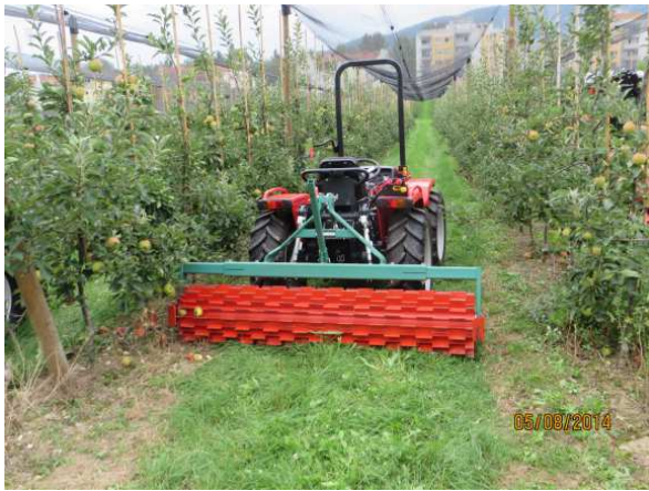
Slika 22: Rebrasti valj za mečkanje trave