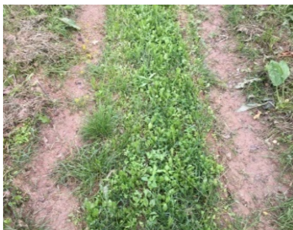
Slika 29: Slabša obraščeni kolotečin, travna ruša še ni popolnoma uničena