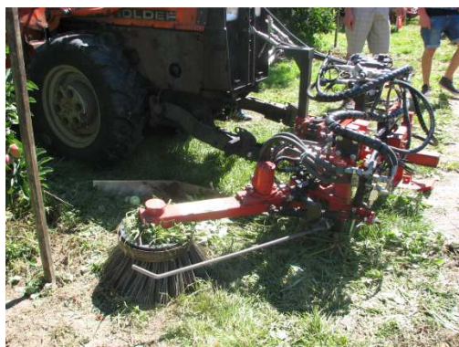
Slika 17: Rotacijski čistilec za odstranjevanje plevela