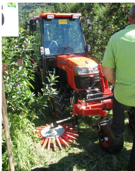
Slika 18: Rotacijski čistilec za odstranjevanje plevela, listja, lesa