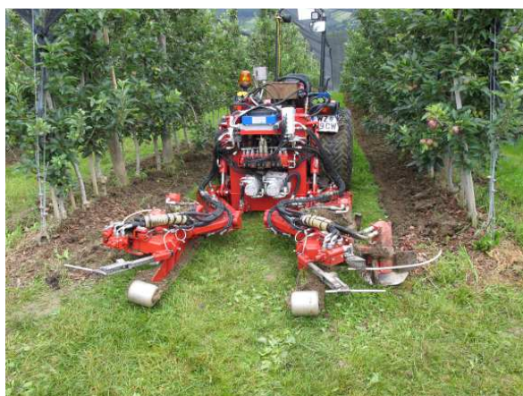
Slika 21: Priključek za osipanje in odgrinjanje zemlje