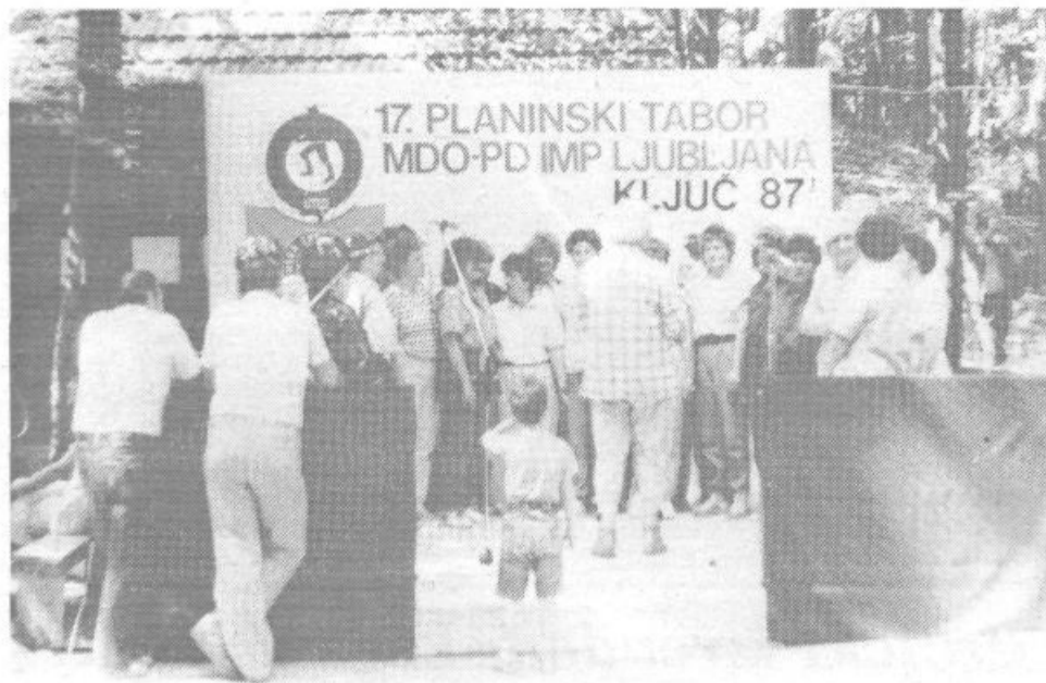
S 17. PLANINSKEGA TABORA NA KLJUČU