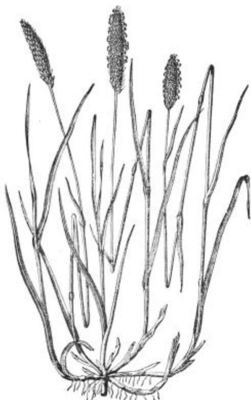
Podoba 61. Lisičji rep.

Podlog iz semena plemenitih vrst torej najbrž ne bomo morali v vsakem slučaju zavreči. H. Gold pravi,