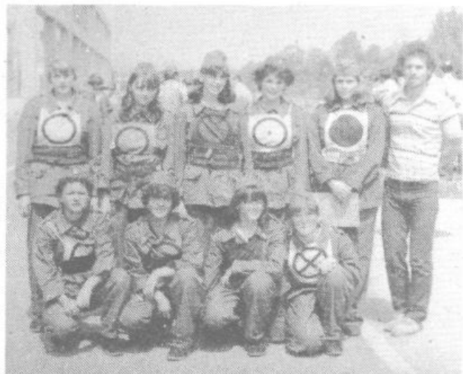
Vseh starosti so gasilci in gasilke (!) na Šentjoštu. Kadarkoli se pojavijo na občinskem ali mestnem tekmovanju, vedno odpeljejo s seboj nekaj pokalov. Pravijo, da je njihov dom postal že prava zakladnica gasilskih priznanj, pokalov, diplom.

Še eno neznanko bomo skušali rešiti. S prostovoljnimi delom je zrastle na Šentjoštu več zgradb (gasilski dom, obrat Indosa, kulturni dom. itn). Mladi in starejši na najrazličnejše načine izkoriščajo prosti čas. Le na domove pozabljajo. Medtem ko so stare kmečke hiše ometane, pa večina novejših hiš kaže opečnata rebra. Pravijo, da zaradi prostovoljnega dela za celotno vas in njene družbene dobrobiti.