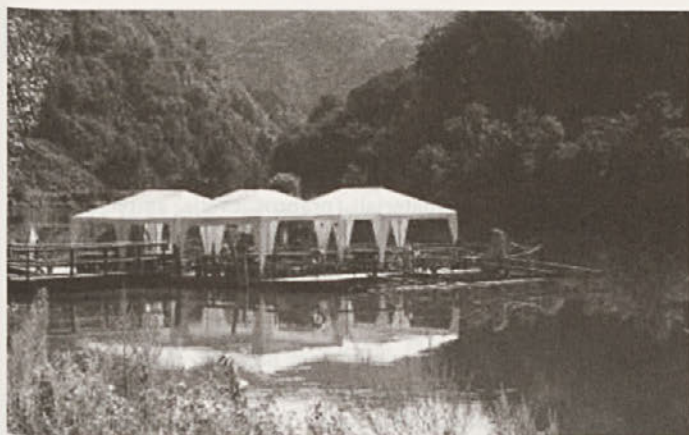
Ob Splavarskem muzeju Javnik.

nje razumevanja in razlaganja podob se v antropologiji najpogosteje rešuje s tem, da postane tekst kontekst, v katerega so podobe položene. Predstavitvi Sarah Pink ( Conversing with Anthropology: Words, Images and Hypermedia Text ) in Rodericha Cooverja ( Issues of Representation of Cultures in Digital Media ) sta nakazali nove možnosti hipertekstualnega povezovanja govornih besede, teksta in podob. Opozorila sta na to, da ostaja večina zgodb, oblikovanih v digitalnem okolju, kljub možnostim interaktivnosti linearna. Pinkova je predstavila vključevanje interaktivnosti in multivokalnosti na podlagi poskusnega video-etnografskega projekta Gender at Home (CD-ROM), s katerim poskuša uresničiti predlog Marcusa Banksa o iskanju alternativnih oblik reprezentacije, ki bi omogočile analitično-konstruktiven dialog med podobami in tekstom, in ne le vzajemno-pasivnega podpiranja. Izziv združevanja vizualne raziskave in vizualne reprezentacije je v oblikovanju predstavitve, v kateri bodo podobe usmerjale branje, postavljale vprašanja in pritegnile uporabnikovo refleksijo k oblikovanju vedenja. Slovenski etnologi in kulturni antropologi morajo, na žalost – čeprav ustvarjalne možnosti, ki jih ponujata digitalno okolje in informacijska tehnologija, že dolgo niso novost – to področje še odkriti. Izjema je zastavljen, a za zdaj še ne končan multimedijški projekt Velika Planina , ki ga na ISN ZRC SAZU pripravlja Jurij Fikfak.