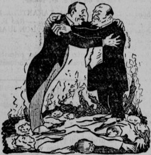
Objem za slovensko zemljo.