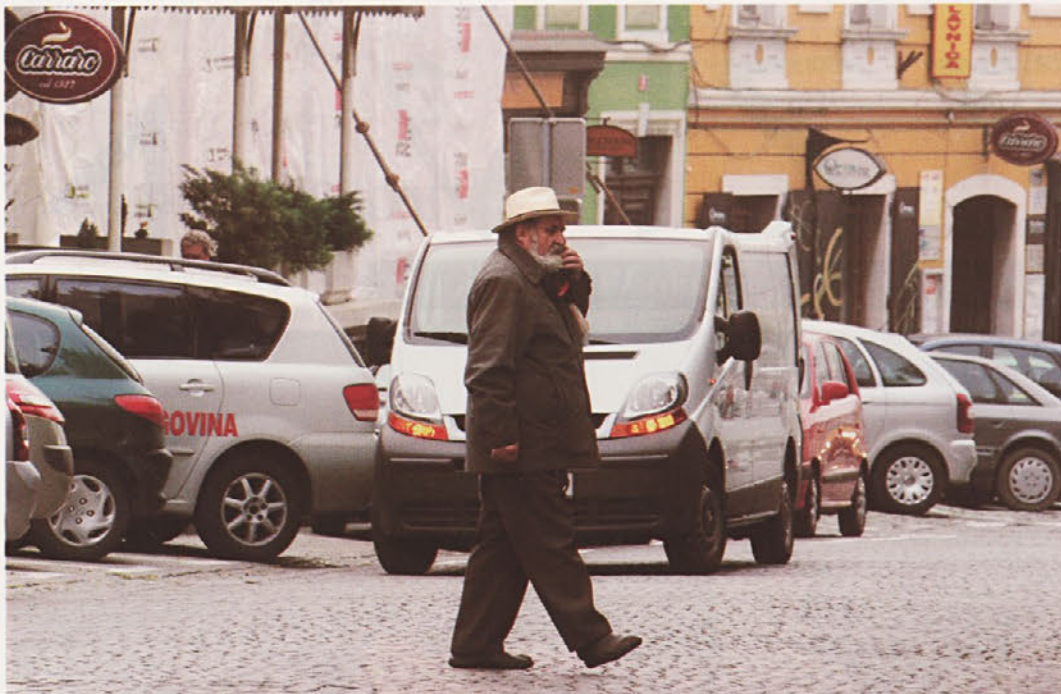
Kako čez Glavni trg, z avtom ali peš – to je vprašanje