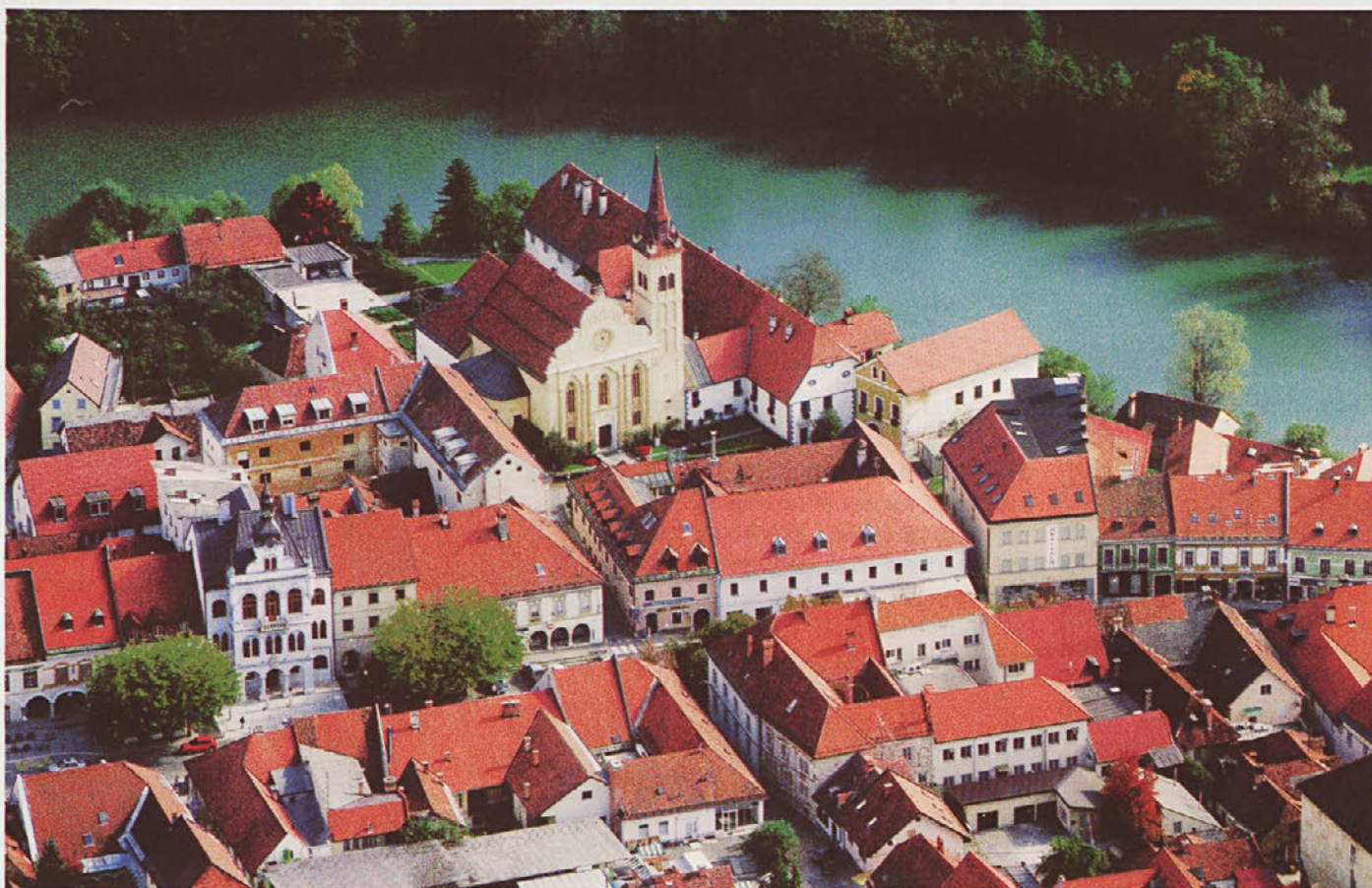
Če tole naše mesto prav pogledaš, si nanj res lahko ponosen