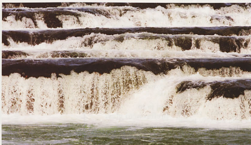
Brez Krke bi bili kot brez krvi