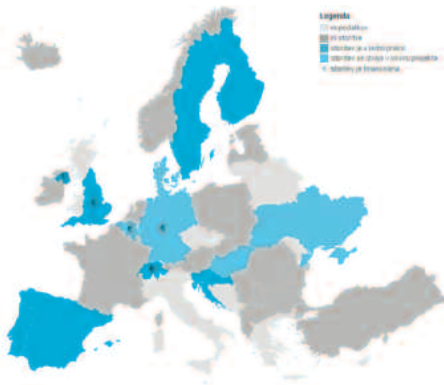
Slika 1. Razširjenost pregleda uporabe zdravil (tip 2a) v evropskem prostoru glede na raven implementacije in urejeno sistemsko financiranje. (povzeto po viru 2).

Na vrhu uspešnih držav s sistematizirano in financirano storitvijo sta Anglija in Severna Irska, sledi jima Švica.