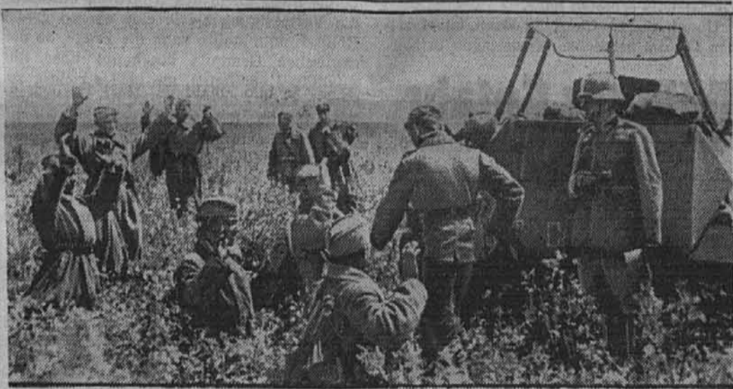
Vse povsod na vzhodu novi nemški uspehi Sovjeti prilezejo iz svojih skrivališč in se vdajo.

Medtem je pa treba podvzeti vse, da se čete in vojni material spravita v Čungking, predvsem tanki in letala in zopet letala. Anglijo poziva, da pošlje 500 bombnikov in lovcev v Čungking-Kitajsko. Z ozirom na dogodke v vzhodnem Sredozemskem morju, kamor so odpoklicali angleška letala iz Bližnjega vzhoda, si pa ne sme delati iluzij, da bo ta pomoč tudi v resnici dana.