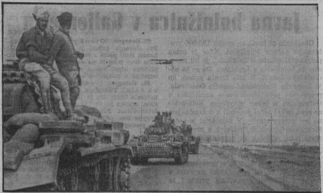
Na poteh zmage

Nekega dne so dejali, da je vse last vseh, namesto evangelija so pridigovali o kolektivni, ki bo vse osrečil. Tako ni bila več samo moja »sušenka«, moja lepa, rdečkasta krava, za katero sem nekoč dal toliko svetlih rubljev, temveč tudi last Kolje, lenuha in ničvredneža in Fetjuške, ničvredne vlačuge. Toda — ničev — s časom se vsega navadimo, tudi na to, da pritegnemo pas vsak mesec za eno luknjo.