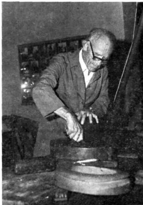
Obrezovanje okraja s »šnajdbretlom«