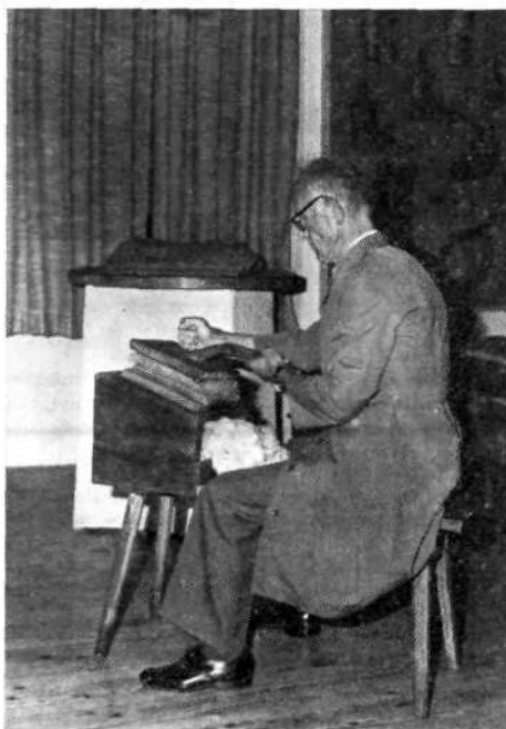
Stol s krtačo, »gradešanje volne«