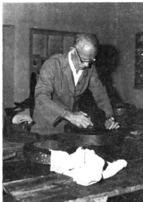
»Zotel« in »flokzecar«

Ko so bili »klobuki« suhi, so jih likali z železnim likalnikom in mokro krpo. S »peglanjem« so se okraji raztegnili. Za likanje so uporabljali samo železne »peglezne s polno plato«, ker so bili ozki, so bili uporabni za likanje okrajev. Klobučar je imel okrog 6 likalnikov. Potem so na okrogli leseni plošči »zotlu« flokzecalili ; z lesenim likalnikom »flokzecarjem« so okraje likali, da so se poravnali. Okraji pri tej fazi so še čisto ravni. Na »zotlu« so okraje obrezovali z obrezovalno deščico, »šnajdbretlom«. Suhe klobuke so drgnili s finim steklenim papirjem. Kosmate klobuke so oribali, da so bili gladki.