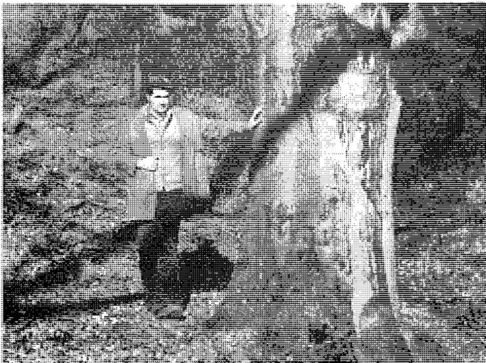
Slika 6: Avtor prispevka ob čistiljivi bukvi, zaščiteni po zaslugi njegovih prizadevanj.

Najnovejša, lahko zapišemo: primitivna medijska vojna proti gozdarstvu, ki so jo pred leti začeli predstavniki Slovenske kmečke stranke, ki so spregledali strokovno in raziskovalno področje slovenskega gozdarstva in njegov mednarodni ugled, s kakršnim se lahko ponaša le malokatera naša panoga, ogroža najtrdnjšo slovensko vrednoto – gozd. Nova gozdarska zakonodaja bi morala biti zasnovana na podlagi mnenja vrhunskih strokovnjakov, ki poznajo stroko v celoti, vso dosedanjo gospodarsko politiko in se zavedajo velikega pomena revirnega gozdarja za pravilno ravnanje z gozdom. Moj namen pisanja je dati pomen revirnemu gozdarju in njegovemu delu. Moral bi biti ustrezno izobražen (gozd. teh. ali inž.) s širokimi pooblastili, da lahko v primeru nepravilnosti hitro ukrepa. Nujno pa se morajo spremeniti prednostne naloge dela revirnega gozdarja, ki naj si sledijo po