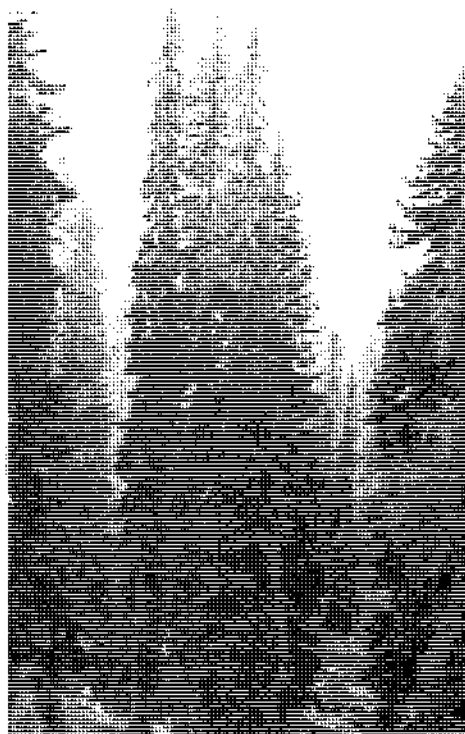
Slika 7: Mešan naravni gozd smreke in macesna na nadmorski višini 1700 m na Zgornji Komni, nad Lepim Špičjem.

Gozd moramo bodočim rodovom ohraniti zdrav, vitalen, čimbolj naraven. Glede na to pa se sprašujem, ali je prav, da gozd ostaja v pristojnosti Ministrstva za kmetijstvo. Gozdovi v Sloveniji pokrivajo več kot 50% površine in so pljuča naše dežele.