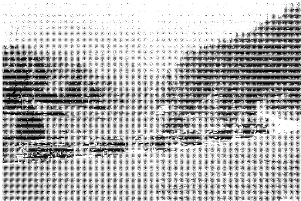
Slika 4: Za tiste čase edinstvena slika odvoza lesa leta 1949. Slikanih je sedem naloženih kamionov na Zatniku, ki peljejo les iz poključkih gozdov.