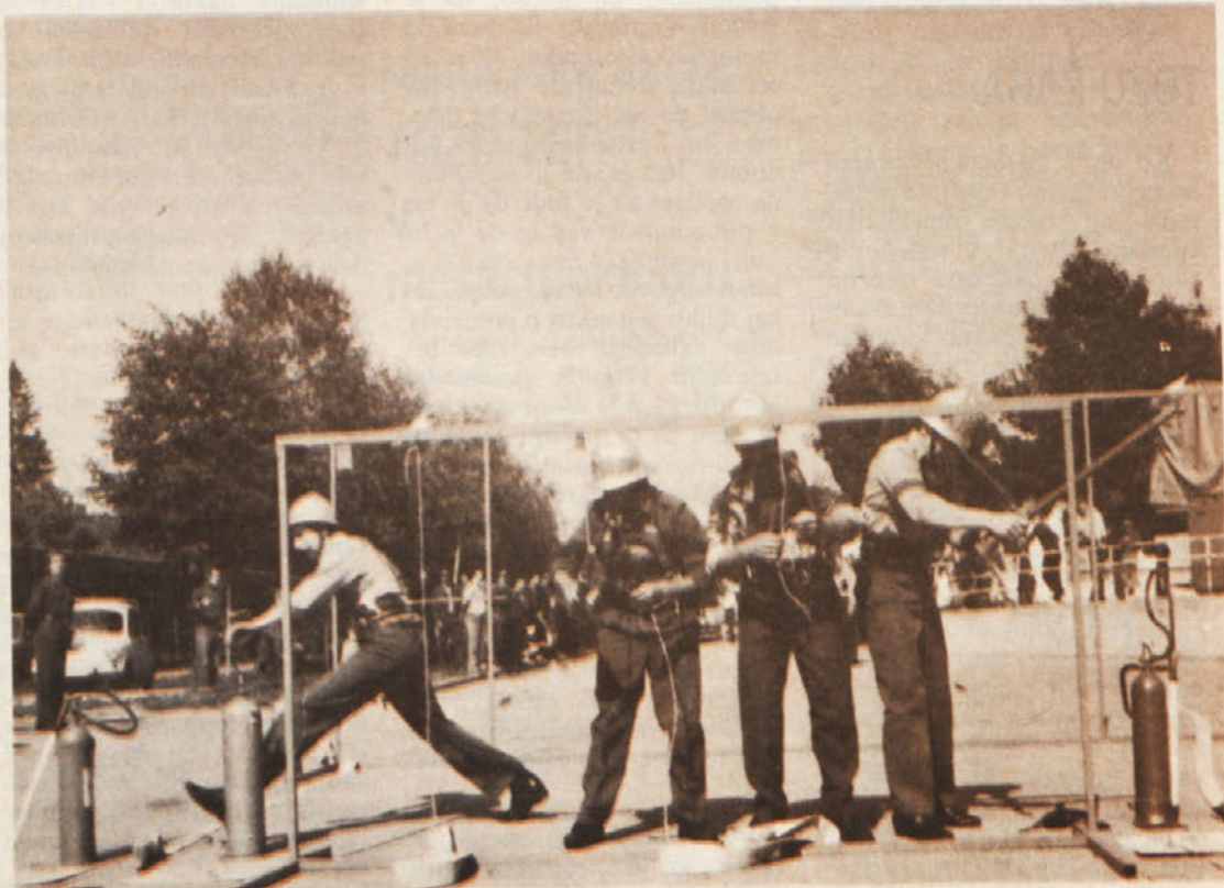
Na rednih vajah si gasilci pridobijo znanje, katerega lahko uporabijo v primeru resničnih požarov