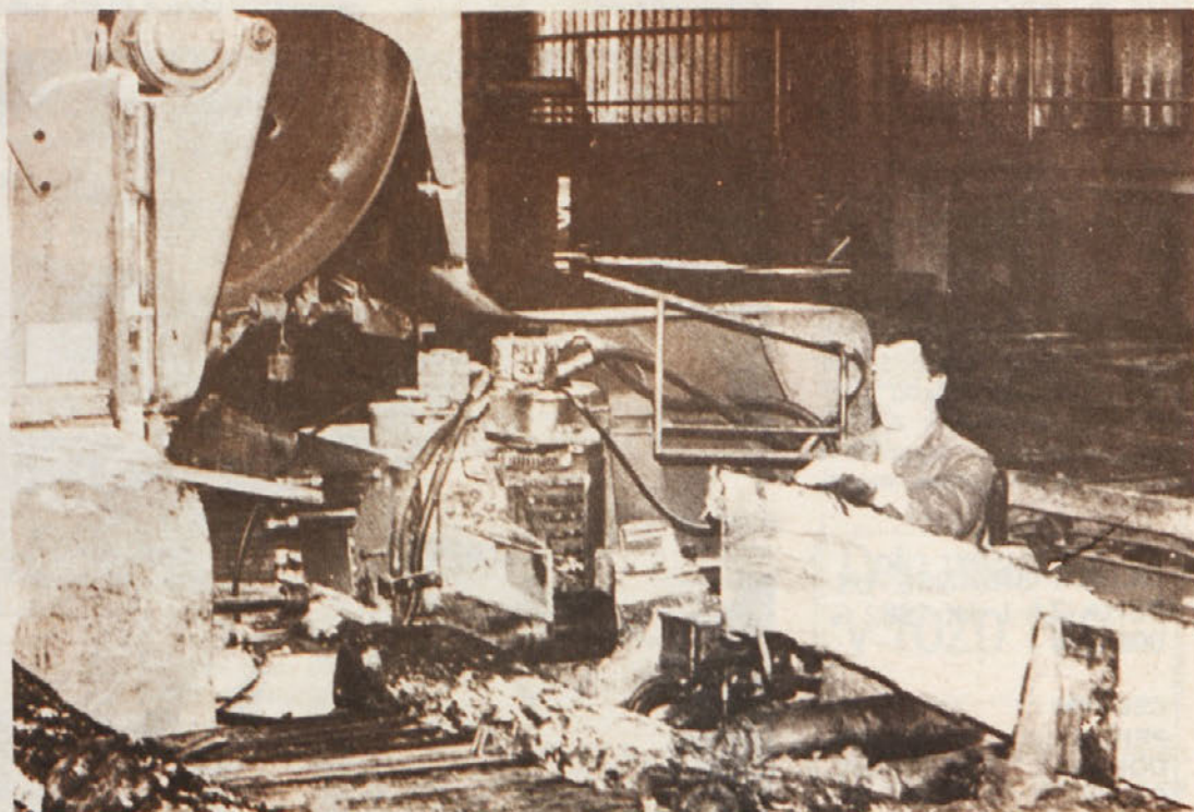
TOZD ŽAGA – vse debelejšje krajevce razžagujejo na cepilki