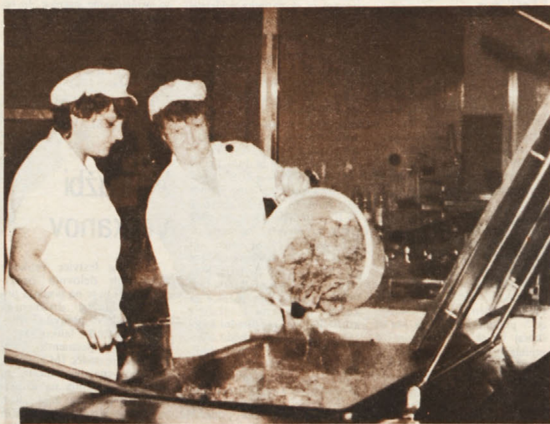
Zrezek je zrezek pa čeprav malo tanjši

Prizadevamo si, da bi bila zbirka kolikor mogoče popolna, zato se z zaupanjem in prepričanjem, da naš klic ne bo zaman, obračamo tudi na cenje-