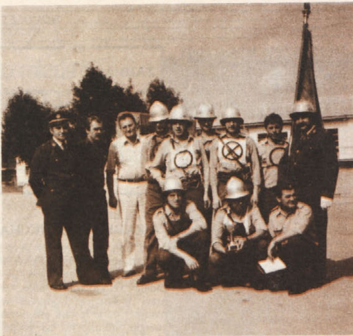
Operativna desetina po tekmovanju s člani upravnega odbora IGD in svojim praporom