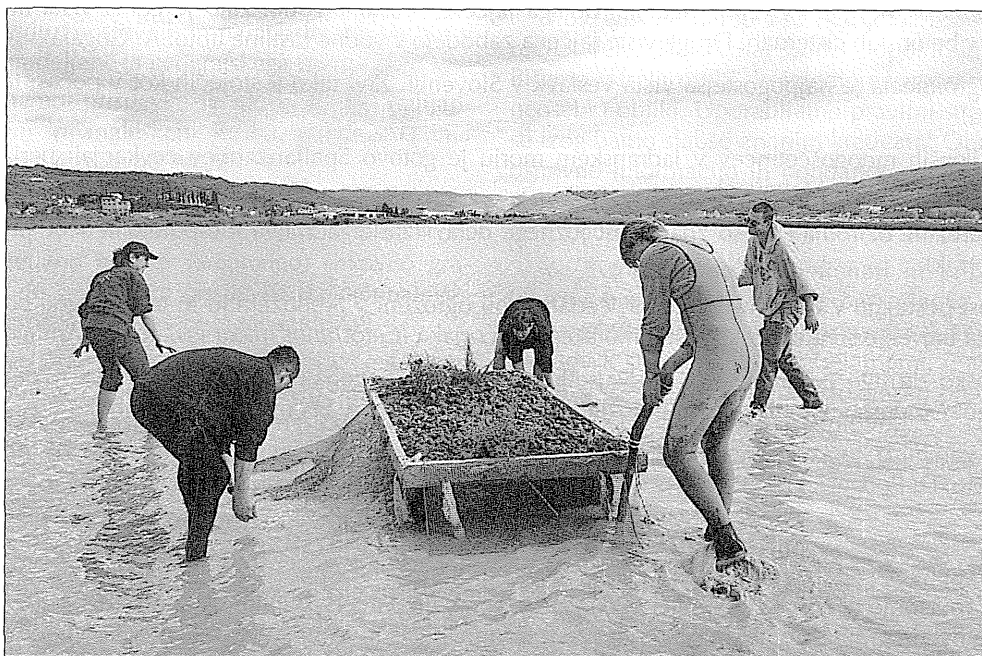
Postavljanje gnezdilnih platform za čigre. The settlement of nesting platforms for terns