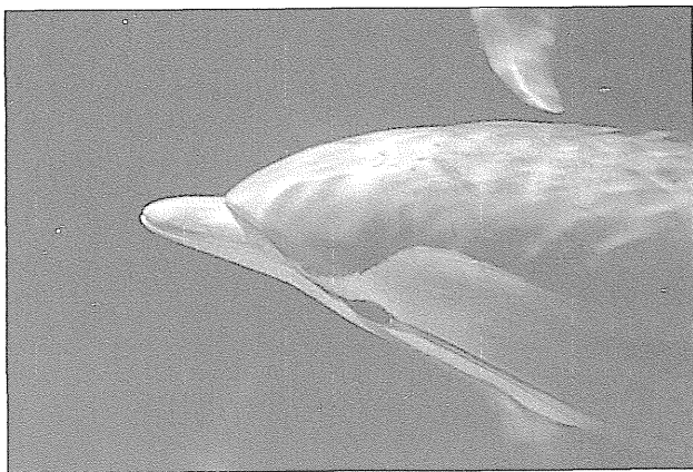
Progasti delfin ( Stenella coeruleoalba ). (Foto: T. Genov). Striped dolphin ( Stenella coeruleoalba ). (Photo T. Genov)

Zahvaljujemo se vsem podjetjem, ustanovam in organizacijam, ki so nam pomagala pri naši dejavnosti. To so predvsem Srednja pomorska šola Portorož, Akvarij Piran, Morska biološka postaja Nacionalnega inštituta za biologijo Piran, Služba za varstvo obalnega morja, in drugi.