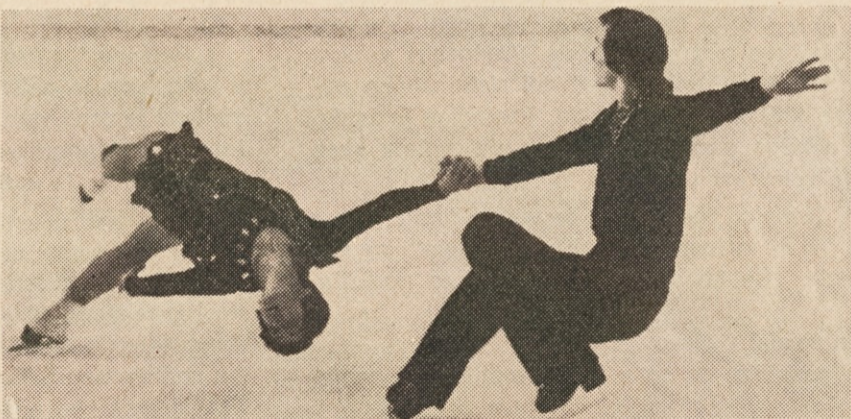
Irina Rodnina/Aleksander Zajcev: doslej najuspešnejši par v drsanju.