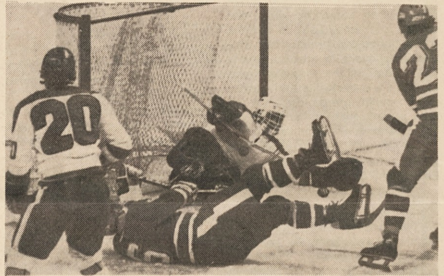
Kvalifikacijska tekma SZ — Bolgarija.