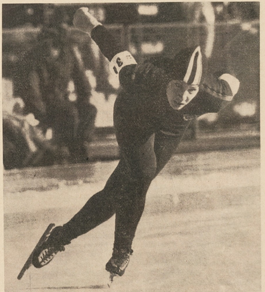
Doslej najuspešnejša tekmovalka teh olimpijskih iger: Tatjana Averina (SZ), ki je dobila 2 zlati in 2 bronasti kolajni v hitrostnem drsanju.

Avstrija — Bolgarija 6:2 Romunija — Japonska 3:1 Jugoslavija — Švica 6:4 Avstrija — Japonska 3:2 Bolgarija — Švica 3:8 Jugoslavija — Romunija 4:3 Avstrija — Romunija 3:4 Švica — Japonska 4:6 Jugoslavija — Bolgarija 8:5