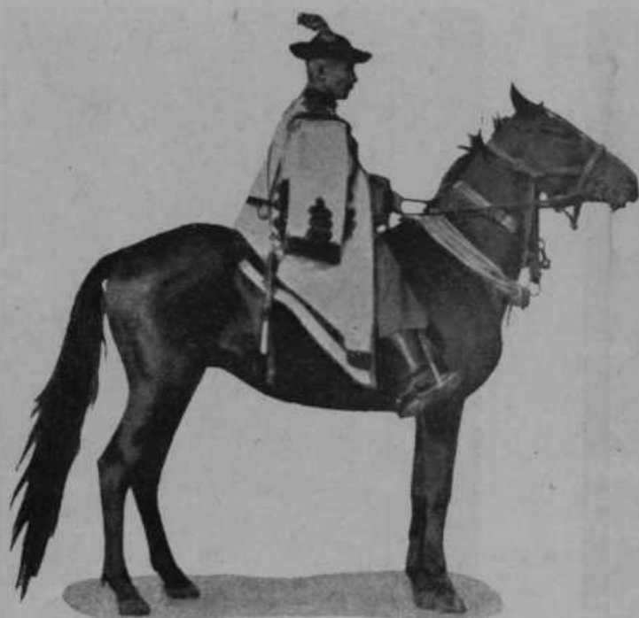
Čikoš, gospodar Puste.