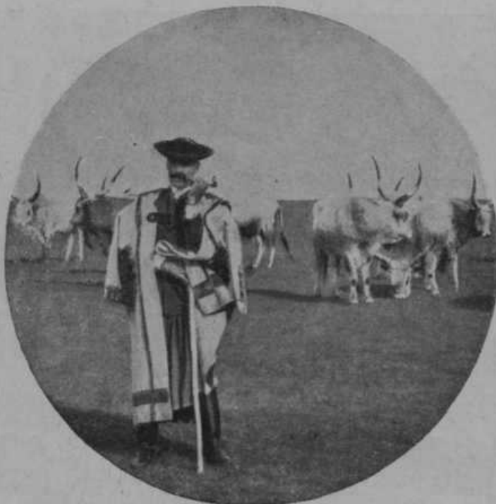
Guljaš pri svoji čredi.

Madjarska Pusta. Vsak kraj ima svoje posebnosti. Ena največjih posebnosti na Madjarskem in morda sploh v Evropi je velika ravnica med vzhodnimi Karpati in reko Tiso. Tu so nedogledni travniki in pašniki in kamor oko pogleda ne vidi hiše ali vasi, ne gozdov in njiv, vse samo zelena trava. In se zgodi v poletni vročini, da se utrujenemu očesu, gledajočemu v brezmejne daljine, prikazuje naenkrat slike lepih vasi in zelenih gozdov, a je to le čuden privid (Fata morgana). Ali povsod se pasejo tisoči in tisoči ovc, svinj, rjavih kobil in žrebet in svetlo sivih goved z dolgimi, ostrimi rogovi, ki so značilni za madjarsko ravninsko govedo. Na vsako čredo konj pazi pastir na iskrem konju,