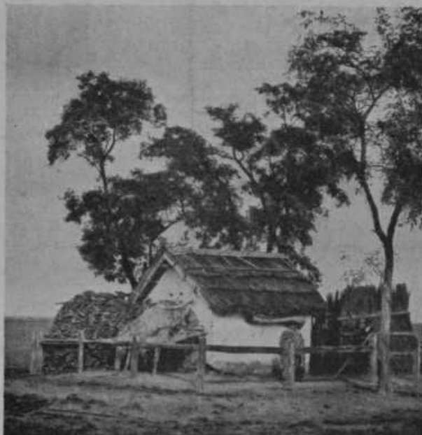
Pastirska koča v Pusti.

Madjarska Pusta. Vsak kraj ima svoje posebnosti. Ena največjih posebnosti na Madjarskem in morda sploh v Evropi je velika ravnica med vzhodnimi Karpati in reko Tiso. Tu so nedogledni travniki in pašniki in kamor oko pogleda ne vidi hiše ali vasi, ne gozdov in njiv, vse samo zelena trava. In se zgodi v poletni vročini, da se utrujenemu očesu, gledajočemu v brezmejne daljine, prikazuje naenkrat slike lepih vasi in zelenih gozdov, a je to le čuden privid (Fata morgana). Ali povsod se pasejo tisoči in tisoči ovc, svinj, rjavih kobil in žrebet in svetlo sivih goved z dolgimi, ostrimi rogovi, ki so značilni za madjarsko ravninsko govedo. Na vsako čredo konj pazi pastir na iskrem konju,