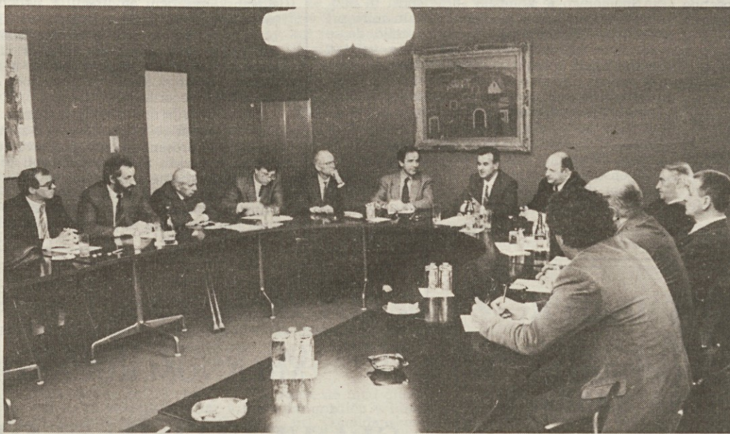
Gostje na srečanju s predstavniki Slovencev v Italiji

Predstavniki slovenskih komponent v Italiji so v diskusiji podčrtali pomen obiska delegacije skupščine, kot tudi vseh stikov, ki krepijo sodelovanje med Slovenijo in deželo FJK, saj gre obenem tudi za krepitev pogojev za razumevanje vprašanja naše skupnosti v deželi. Zavzeli so za to, da Slovenija kot republika, ne glede na spremembe, ki jih bodo prinesle aprilске volitve, ohrani in še okrepi pozornost in skrb do Slovencev izven meja matice v duhu ustavnih in mednarodnih obveznosti. Slovenci v zamejstvu namreč pričakujejo, da bodo v bodočnosti za to vzpostavljeni boljši pogoji in da se bodo odstranile ovire, ki bi kakorkoli lahko zavirale enakopravno vključevanje manjšine v matični prostor.