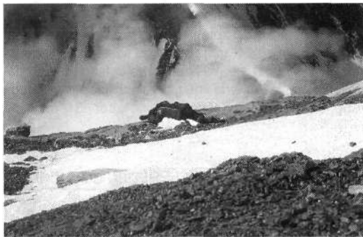
Njegova zadnja gora je bila Čomolungma: nesrečni kazahstanski alpinist, ki je od izčrpanosti sedel na greben in tam za vedno zaspal.

»Sepp, ne lomi ga, snemi dereze in pridi za mano!« mu vpijem, medtem ko ga čakam in študiram prehod preko previsne druge stopnje, ki se zlovešče dviga nad