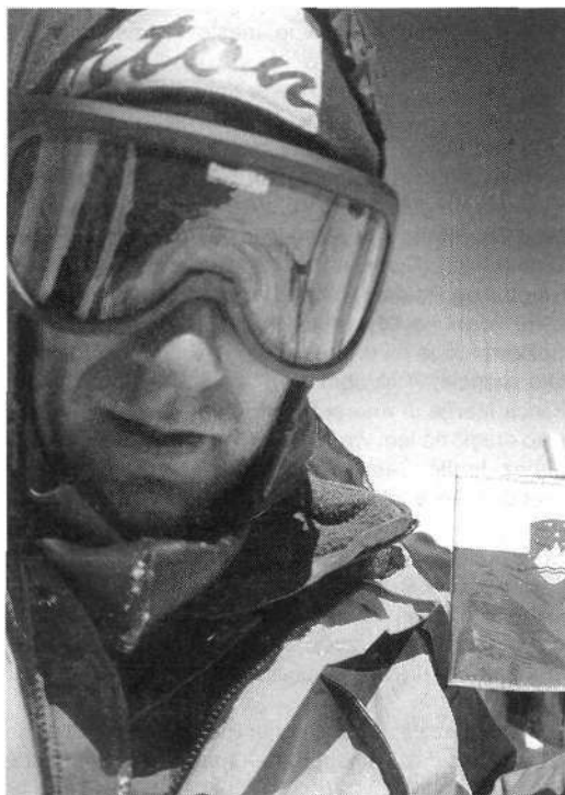
Avtoportret na vrhu najvišje gore sveta.