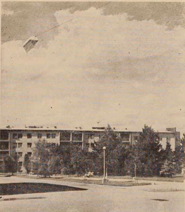
(vabila so dobili), zakaj niso prišli predstavniki organizacij PZ, ZTS, ZMS, ribiške, lovške organizacije itd. Morda zato ne ker se ne zavedajo, da je skrb za ureditev mesta in organizacija akcij (uspešna), skrb vseh, posebno pa tistih organizacij in društev, ki se posredno ali neposredno ukvarjajo z dejavnostjo, ki zadeva turizem, pa

Morda pa je tudi to res: Ni bistveno, koliko članov imamo v društvu, bolj važno je kako občani, gospodarske organizacije, družbene organizacije in društva pomagajo, sodelujejo pri reševanju vseh problemov, ki zadevajo turizem in pospešujejo njegov razvoj in v tem je treba najti ugodnih pogojev in skupno besedo vseh za akcijo in reševanje nalog, ki so še pred vsemi nami.