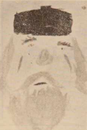
DEDEK MRAZ — akvarel — Goro Brglez, 9 let