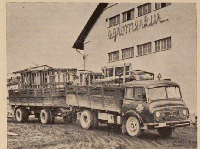
Prispela je oprema za bodoči obrat KIK Pomurka

mo fižol v vrste, v gnezde, torej tri vrste med dvema pasovima koruze (50 — 50 — 50 cm ali 50 — 100 — 150 cm). V vrsti so gnezda, 5—6 rastlin, na 40 cm. Možno pa je sejati fižol tudi s strojem v vrste. Tako bo užival tudi fižol prednosti čistega posevka.