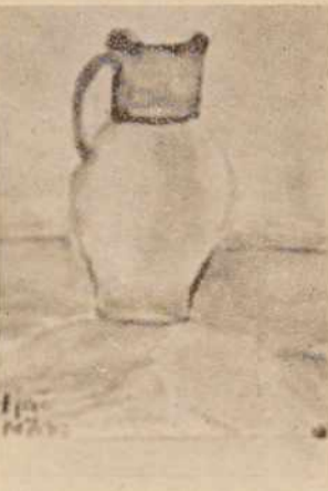
LONCENI VRC — akvarel — Milan Kofjač, 14 let