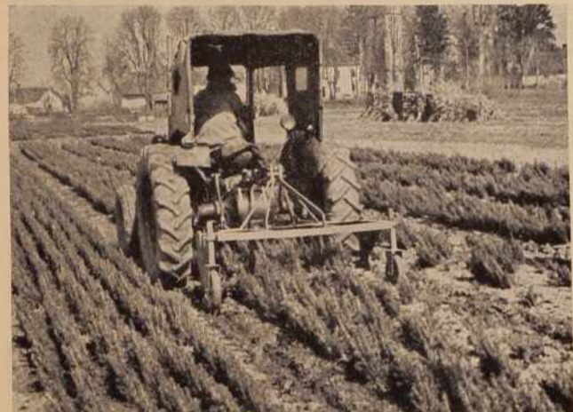
NOVI STROJ — VEČJA PRODUKTIVNOST

V drevesnici na Tišini imajo poseben stroj za izkopavanje sadik, ki opravi delo dvaindvajsetih delavk v 12 urah. Drevesnica je dobila ta stroj letos in je povečala svoja zemljišča od 3,5 na 11 hektarov.