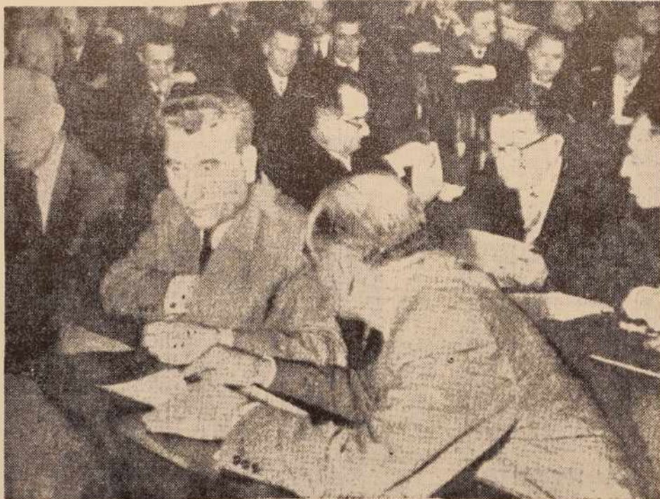
Iz Zvezne ljudske skupščine: poslanci med ustavno razpravo

alno zdravstveni in organizacijsko politični zbor pa bodo izvoljeni za dve leti poslanci tistih volilnih enot, ki so označene s sodim (parnim) številom.