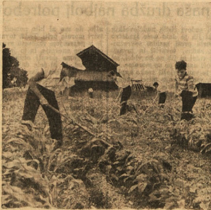
Ameriški dijaki pomagajo pri delih na polju