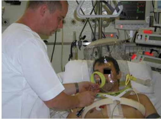
Slika 1: Pripomočki za NIV: čelada (Auremiana), CPAP z valvulo PEEP (Intersurgical).