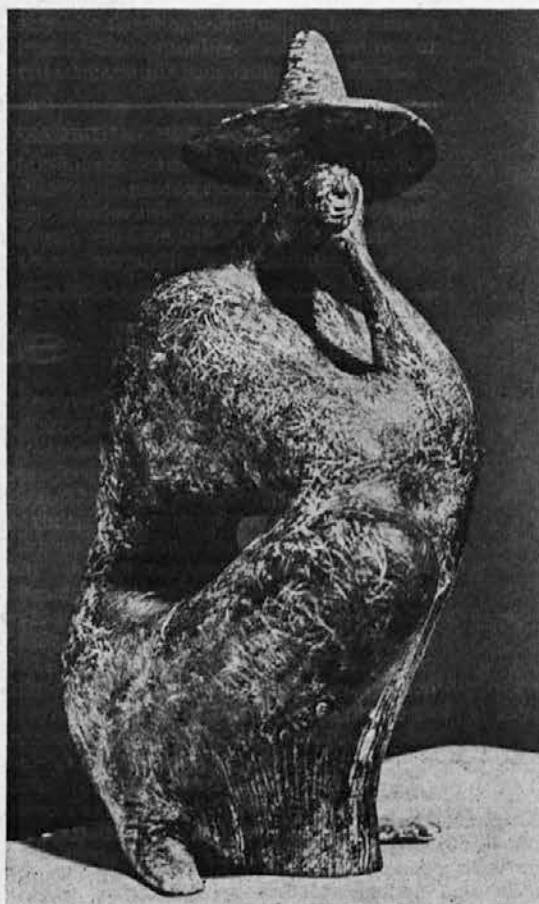
Jože Pohlen: Solinarka (terakota)

Vabljeni so vsi ljubitelji naših planin.