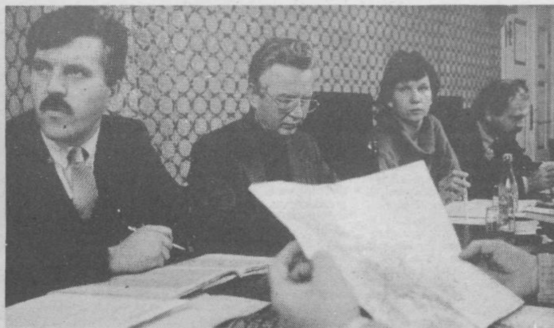
Pogovor o tem, kako inovacijski dejavnosti dati mesto in pomen, ki ji pripada