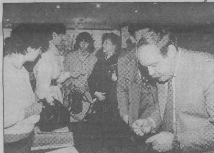
Delegati prihajajo na skupščino