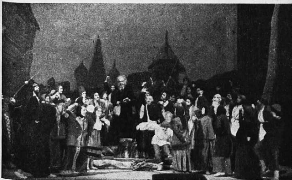
Iz zadnjega prizora naše uprizoritve »Borisa Godunova«: Kromi