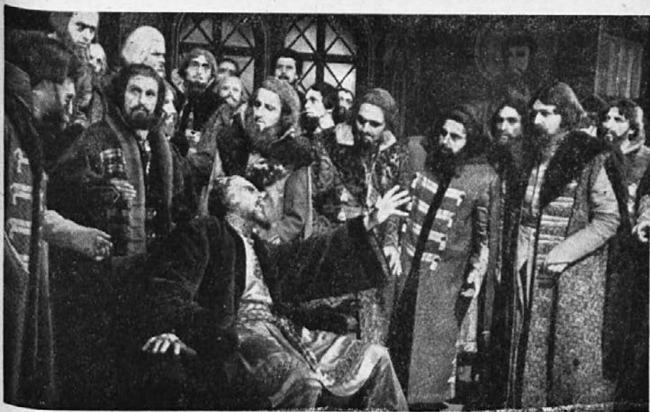
Prizor iz uprizoritve Musorgskega opere »Boris Godunov« na našem odru (režiser — C. Debevec, scenograf — V. Žedrinski)