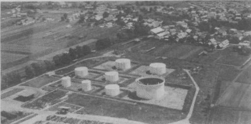
Petrolovo skladišče v Zg. Kašlju

praktično nemogoč. Zaradi zaprtega sistema pretakanja hlapi namreč ne morejo na prosto. Poleg tega bo prečrpališče opremljeno s posebno detekcijsko opremo, ki bo sprožila alarm ob vsakem povečanju hlapov