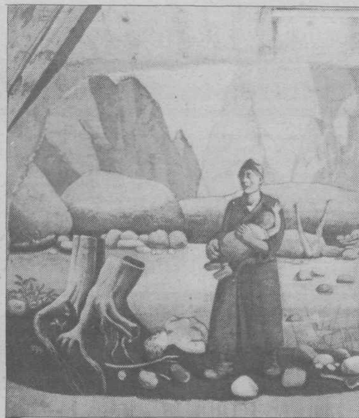
Krsto Hegedušič: »Zmaga«. Narodni park Sutjeska - Tjentište