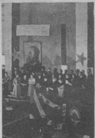
Na začetku svečane prireditve je zapel več pesmi mešani pevski zbor SGP Slovenija ceste

Delavci SGP Slovenija ceste — TOZD Mehanični obrati so ob prazniku republike slavili po-