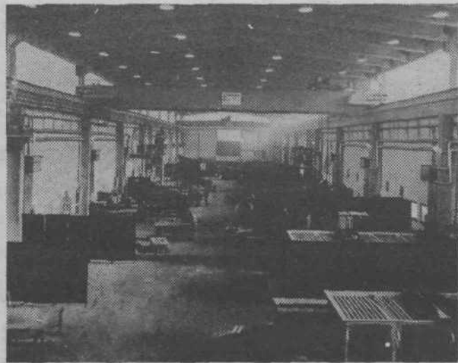
Novi prostori oddelka novogradnji

● SGP SLOVENIJA CESTE: SLOVESNOST Z NOVO DELOVNO ZMAGO