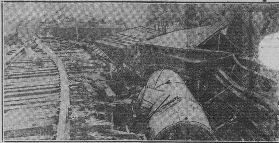
Slika kaže železniško nesrečo v Texasu, ko je te dni skočil vlak z železniškega tira. Dva železničarja sta bila na mestu ubita in trije težko ranjeni.