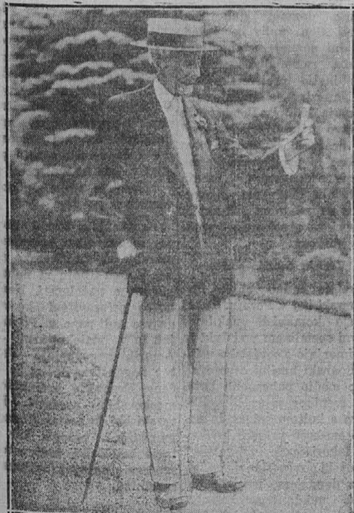
John D. Rockefeller, multimilijonar in znani oljni magnat še vedno zdrav, se sprehaja in bele hlače nosi. Slika ga prikazuje, kako je izgledal na svoj 94-ti rojstni dan, na svojem domu v Pocantico Hills, N.Y.