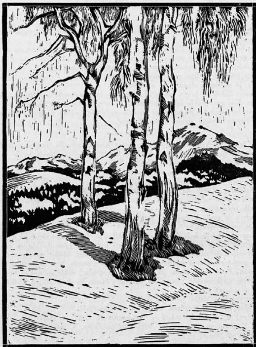
Pavle Medic: Pred prebujenjem