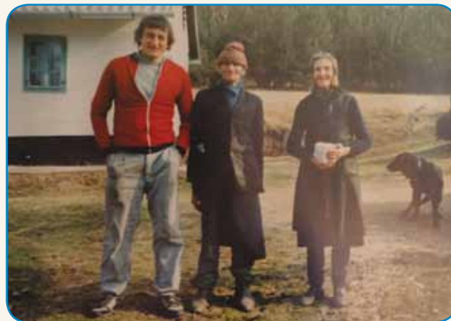
KRAVE SEM NEJ RAD PASO stran 8