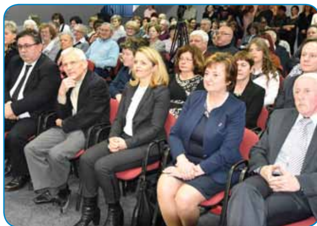
Dvorana Slovenskoga doma se je do zadnjoga stauca napunila