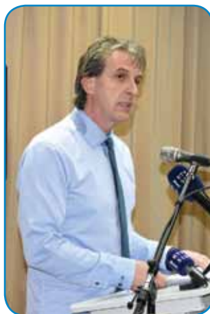
Zbrane je pozdravo slovenski kulturni minister Tone Peršak, slavnostni guč je emo fotograf pa novinar novin Porabje Karči Holec

»Kultura je mejla dosta pri tem, ka je naš narod preživino daubo svoj rosag kak drugi evropski narodi. V gnešnjom cajti, gda se rosagi povezüjejo pa vsikdar več funk-