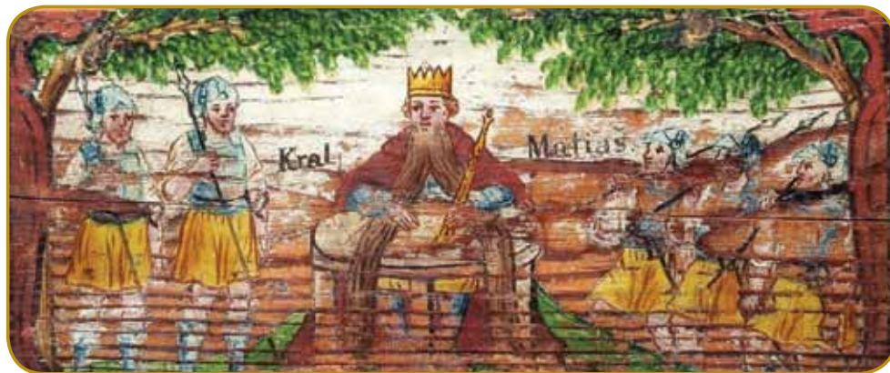
Slovensko lüstvo je dugo čakalo, ka se povrné krau Matjaš (panjska končnica)

O vsej baladaj s srejdnjoga vöka leko povejmo, ka se spravljajo s privatnim, držin-