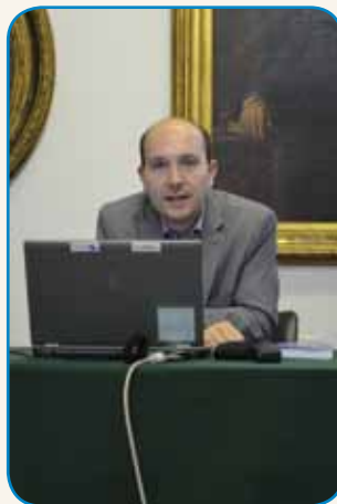
SPLOŠNI POLOŽAJ MLADIH ... stran 5