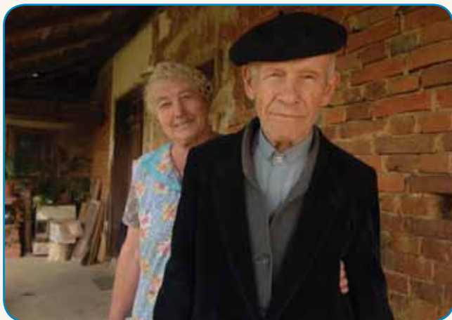
»Kaput dam, knjig pa nikomi ne dam« stran 6