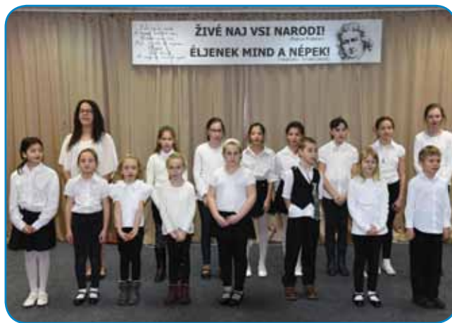
Števanovski šaularge so spejvali pa recitirali

jali - tisti, šteri so igro že poznali, pa tisti, šteri eške nej. Režiser je minjavanje scen spoj dobro rejšo, gnauk smo vidli eden ram, drgauč pa drügoga, tak je bilau, kak liki bi eden zakonski par dale pelo mišlenje drügoga. Vse ženske pa badva moška so lepau zašpilali svoje karaktere, gor smo prišli, kama vse leko pelajo klajfe pa krivo tauženje drügoga. Što ali ka v istini je