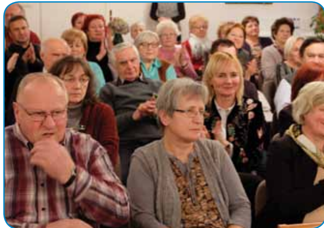
Publika je napunila sejno dvorano generalnoga konzulata