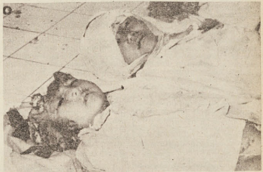
To je vojna v Viet Namu. Bombniki ZDA so odvrgli najprej tovar igrač. Igračam so sledile bombe... Mati, to bi bili lahko tvoji otroci! Ali misliš, da se lahko še kdo izgovarja: «Mene, Slovence, to ne zanima... Azijska stvar!» Misliš?

Naša naloga je, da zahtevamo povsod in vedno konec vojne, konec zločinov, konec vmešavanja v notranje zadeve drugih narodov. Zato b 27. t.m. v soboto, mednarodni dan solidarnosti z vietnam-