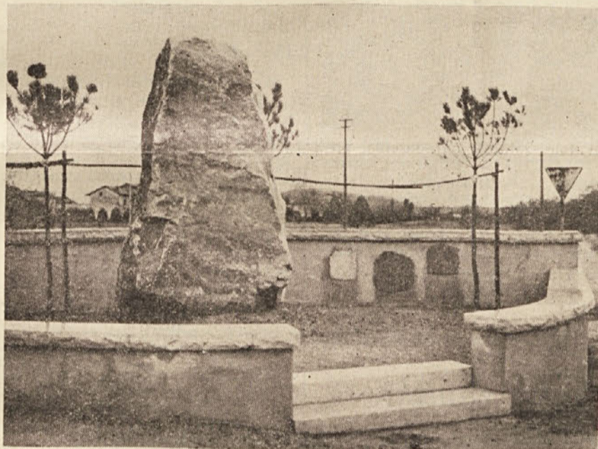
V Sovodnjah bodo odkrili spomenik padlim borcem v NOB. Le kdaj ga bodo v Gorici?