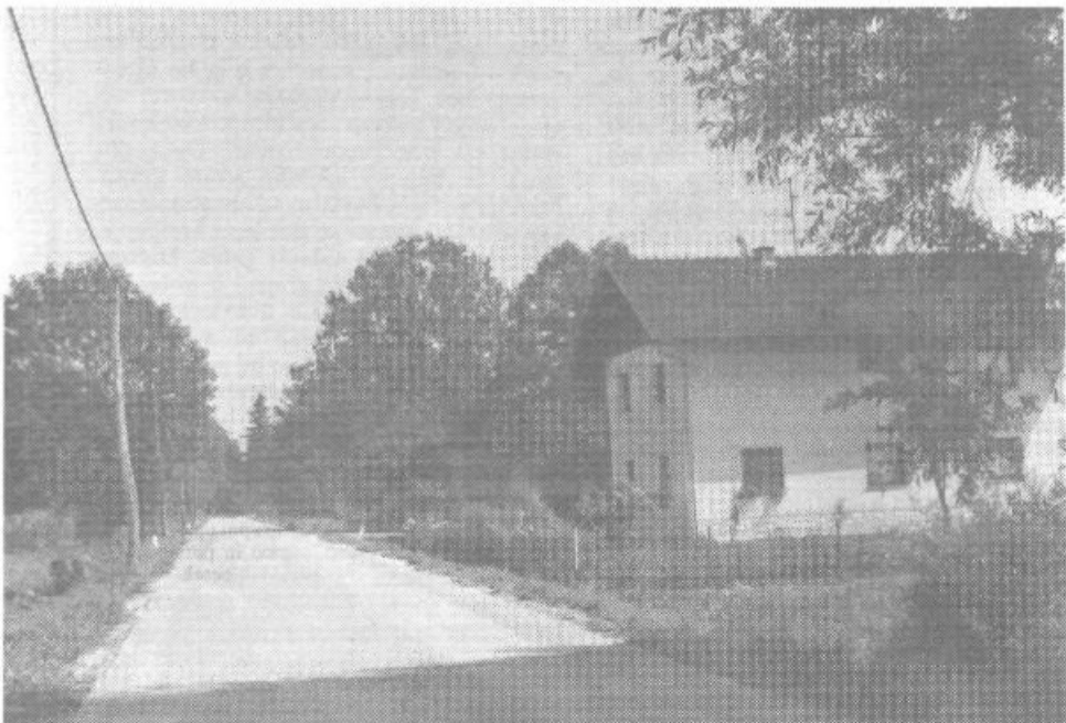
Lipe: zavoljo izrazito nizke lege, razvlečeno vasico še vedno ogrožajo poplave