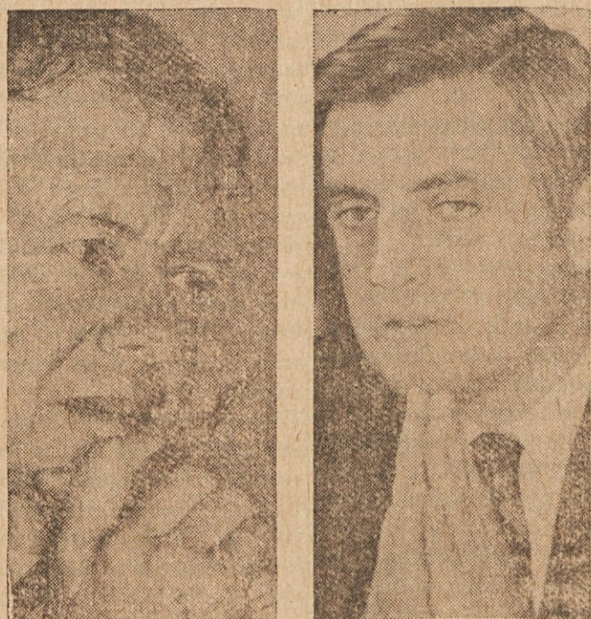
NE V VSEM — Sen. Walter F. Mondale (na desni) je dejal, da se ne strinja v vsem z demokratskim predsedniškim kandidatom Jimmyjem Carterjem, četudi sta skupaj na demokratski volivnici.

Oblačno in deževno z najvišjo temperaturo okoli 68 F (20 C). Proti večeru in jutri postopna razvedritev.