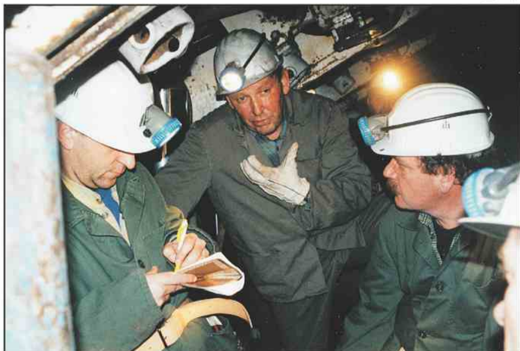
Med ogledom jamskih delovišč.