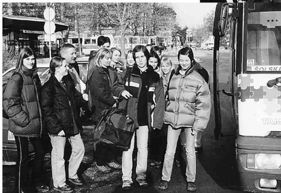
Košarkarice so prestopile v drug avtobus in pot nemoteno nadaljevale

nom Reharjem. Namenjeni so bili v Slovenske Konjice na četrtfinalni turnir za starejše pionirke. Zadeva jih je sicer sprva malo prestrašila, a je šofer hitro ukrepal in jih napotil iz avtobusa. Pot so potem nadaljevale z drugim prevoznikom in vse se je srečno končalo. Tudi turnir. Obe tekmi so velenjske košarkarice dobile. Ekipo OŠ Šentvid Ljubljana so premagale s 67:23, ekipo OŠ Tržišče pa z 58:18 in se uvrstile v polfinale, ki bo najbrž v Velenju. Pa ne zaradi izkušenj z avtobusom.