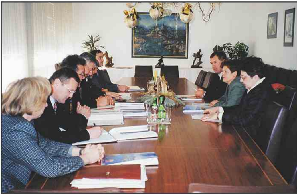
V uradu velenjskega župana so za mizo sedli predstavniki lokalne skupnosti in Šolskega centra Velenje ter Višje strokovne šole za gostinstvo in turizem iz Bleda. Je bil to začetek resnega sodelovanja na področju izobraževanja? Odgovor bo znan že čez kakšen mesec dni.

mo, da so velike. Zato je prišlo do dogovora s Šolskim centrom v Velenju in bljesko Višjo strokovno šolo. Obstaja več možnosti sodelovanja. Ena je oblikovanje lastnih izobraževalnih programov na srednjem in višjem nivoju, druga pa je možnost ustanovitve dislociranih izobraževalnih enot že obstoječih šol. Dogovorili smo se, da bomo v Dolini pripravili na-