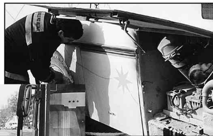
Hladilno tekočino so popivali gasilci.