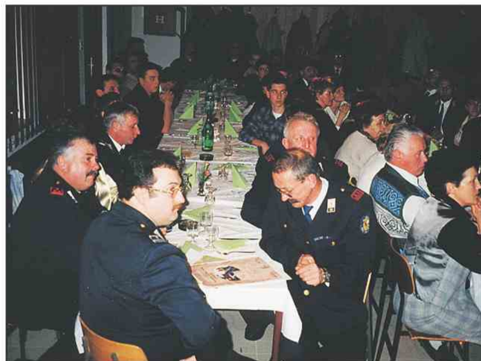
Z jubilejnega občnega zbora

ka ter 10-letnice selitve v sedanje prostore doma. Letos mu nameravajo nameniti še več pozornosti, kot lani. V delovni program so namreč zapisali temeljita obnovitvena dela v njegovi notranosti in zunanosti. Poleg tradicionalnih prireditev načrtujejo še več aktivnosti na področju preventive in izobraževanja oziroma usposabljanja čla-