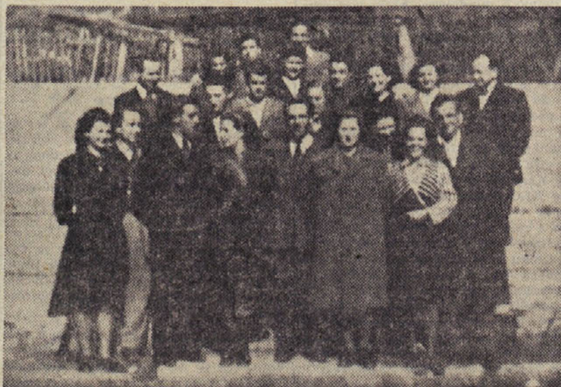
Tečajniki prvega dopisniškega tečaja v Zagorju