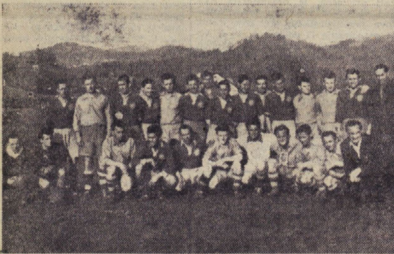
Nogometni moštvi Partizan in Rudar

V 35. minuti je bil kot proti Rudarju; iz gneče je dosegel Partizan 5. gol. Ze je izgledalo, da bodo gostje odšli