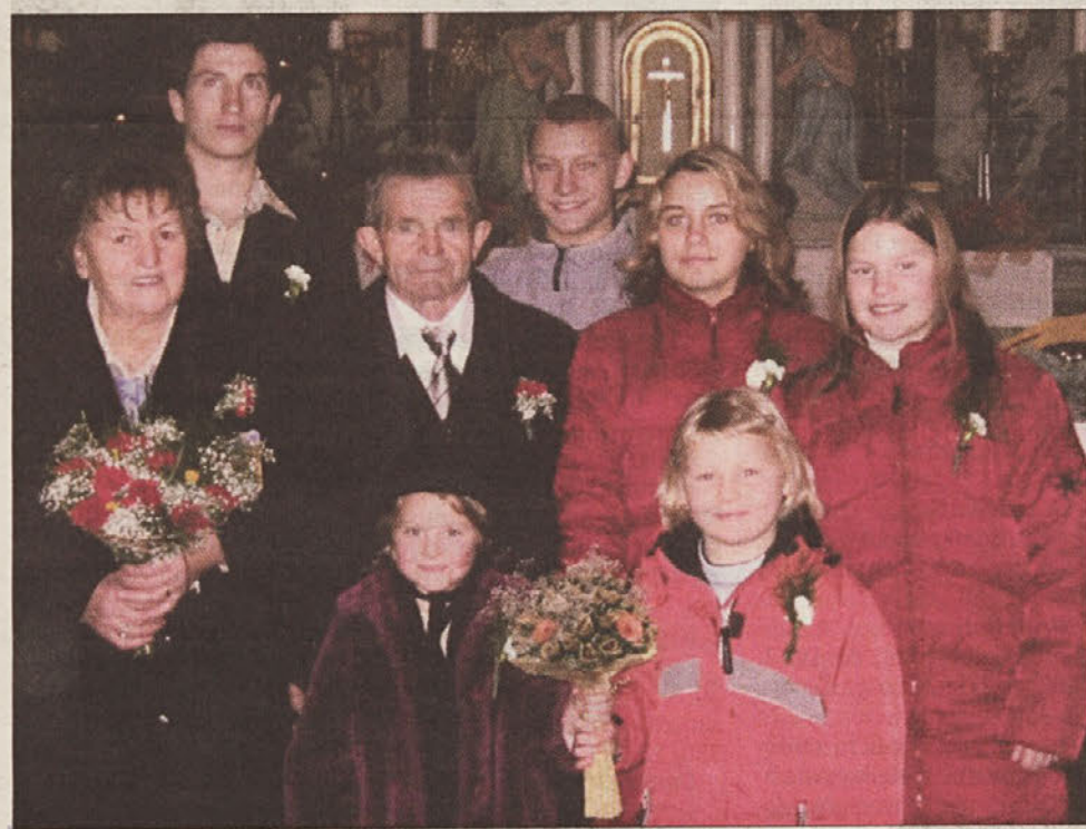
Zakonca Majoranc s svojimi vnuki

Pošljite nam maturantske fotografije z imeni vseh na naslov Novi tednik, Prešernova 19, 3000 Celje ali na e-mail: tednik@nt-rc.si.