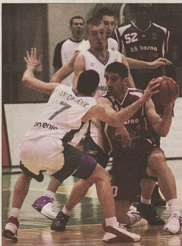
Nekdanji evropski prvaki iz Sarajeva so odigrali zelo požrtvovalno in se ob koncu veselili zmage.