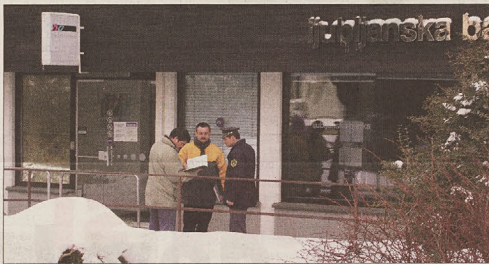
Kdo je oropal Novo Ljubljansko banko v Šmartnem ob Paki?