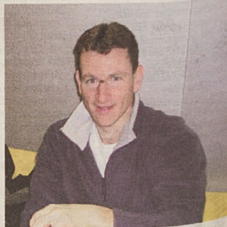
... in danes, ko se igra z našimi cestami.