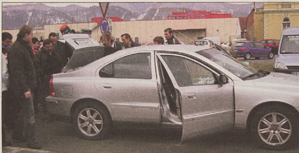
Obiskovalce je najbolj zanimalo vozilo Provida.

IZLETNIKOVA TURISTIČNA AGENCIJA Aškerčeva 20, 3000 Celje; tel.: +386 03/428 75 00 e-pošta: ita.celje@izletnik.si; www.izletnik.si