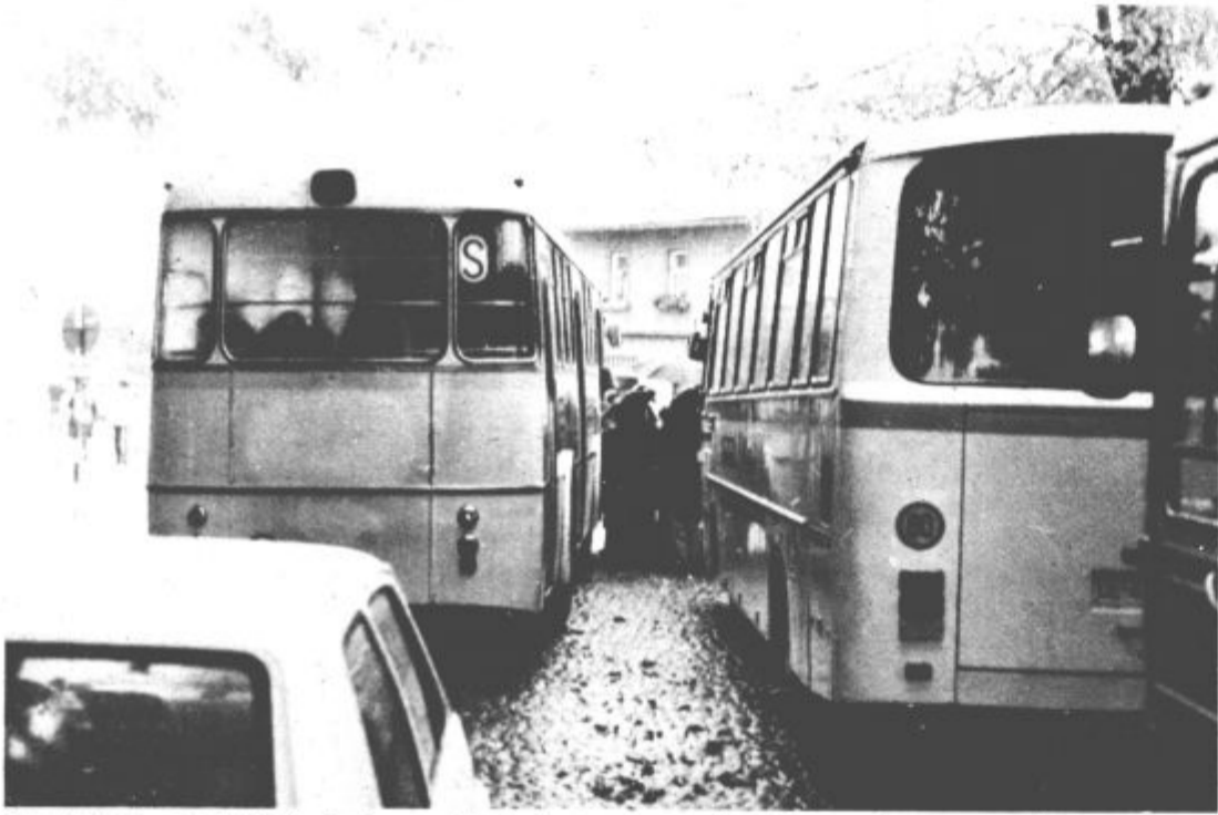
Pri avtobusni postaji v Soštanju je pogostokrat zelo tesno – zaradi avtobusov. Če se boste slučajno pripeljali v Soštanj za avtobusom, se kaj lahko zgodi, da boste imeli pri postaji nepredvideni postanek. Avtobus se ustavi in zapre levo polovico ceste. Nato morate počakati, da potniki izstopijo in drugi vstopijo, da jim šofer pobere denar za vožnjo, šele nato odpelje in vam odpre cesto. Če pa se vam mudi, je najbolje narediti prekršek in zapeljati po pločniku. Tolažimo se lahko s tem, da se vsi šoferji avtobusov vendarle ne obnašajo tako oblastno.