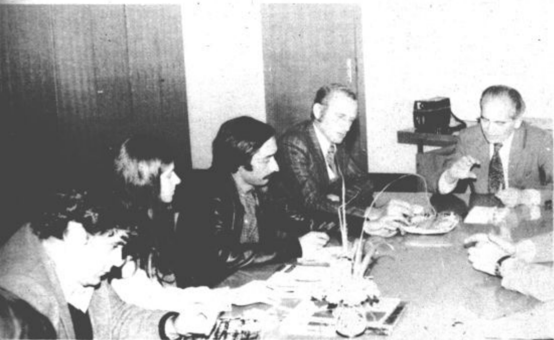
DELEGACIJA DELAVSKIH KOMISIJ IZ KATALONIJE V VELENJU — Pred dnevi se je na obisku v Velenju mudila delegacija delavskih komisij iz španske Katalonije, ki je prisostvovala delu 9. kongresa Zveze sindikatov Slovenije v Mariboru. Delavske komisije v Španiji so mlad sindikat, ki je z zakonitim delom pričel šele pred dobrim letom dni, po dolgih letih ilegalnega boja proti fašistični diktaturi. Delegacija katalonskih delavcev se je po končanem kongresu odzvala vabilu Občinskega sindikalnega sveta Velenje in med enodnevnim spoznavanjem Velenja obiskala tudi Rudarski šolski center Velenje (na sliki).

Suho vreme se bo zadrževalo tudi ob koncu tedna. Nočne temperature bodo okoli nič, dnevne pa od 10 do 15 stopinj.