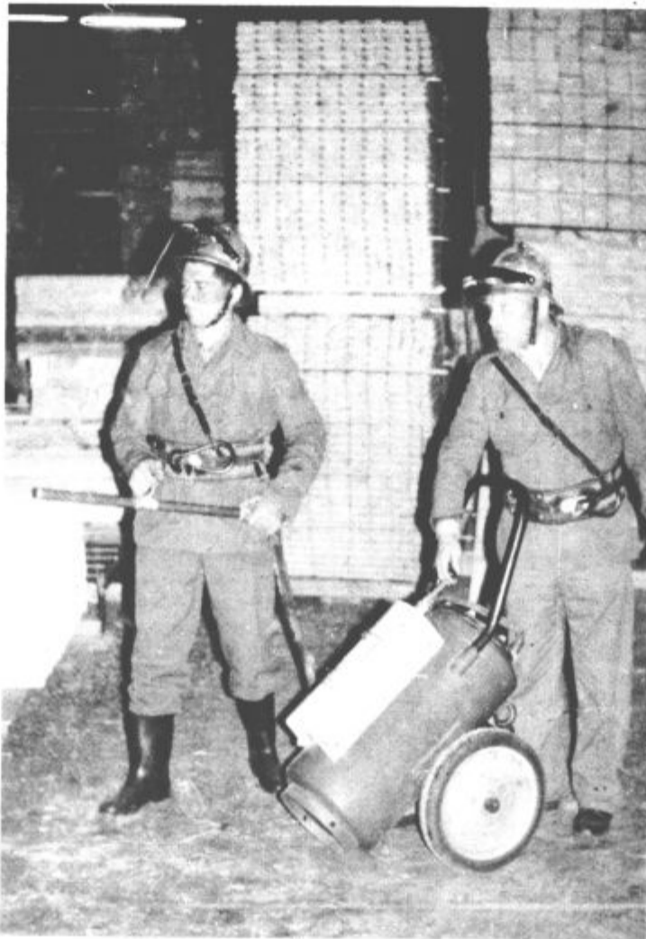
Z „rdečim petelinom“ so se najprej spoprijeli dežurni gasilci

Vzgojno varstveni zavod Velenje si prizadeva, da bi njihovi redni varovanci osvojili kar največ telesnih veščin. Tako bodo letos izvedli plavalni tečaj v sodelovanju s plavalnim klubom Velenje za vse otroke rojene leta 1972. Z velikim zagonom pa izpolnjujejo tudi zadnje naloge tekmovanja za športno značko.