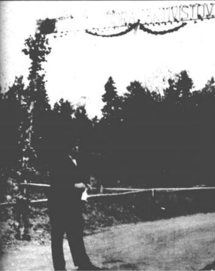
Otvoritev „Ceste zbora aktivistov“

krajevni skupnosti Bočna so v soboto slavili krajevni praznik — številne nove pridobitve — Z novo cesto so povezali Zadrebško in Savinjsko dolino in si uredili vrtec — Ogromen prispevek krajanov