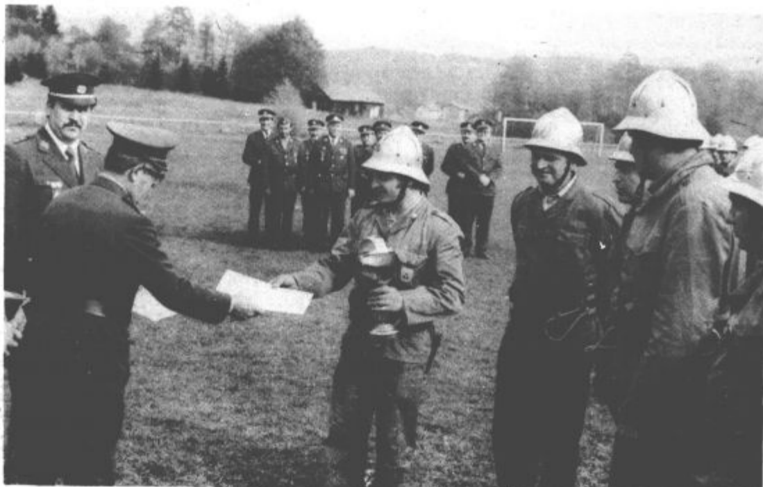
Najboljše desetine so prejele pokale