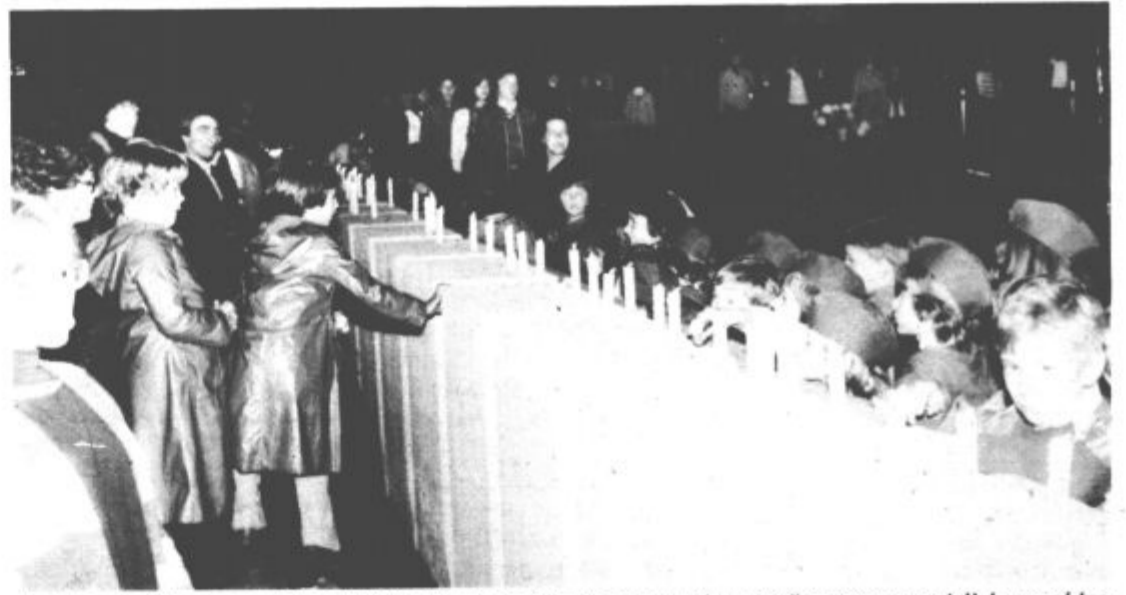
Pred centralnim spomenikom NOV Velenje je bila komemorativna svečanost v ponedeljek popoldne. Učenci osnovne šole Anton Aškerc so pripravili recital, vsak pa je ob spomeniku prižgal svečko.