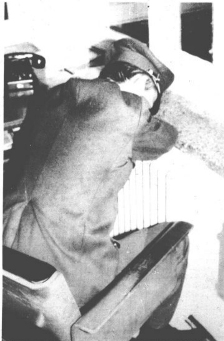
Tokrat je zmagal spanec

V Galipu se nas je vratar že davno ne več rosnih let, zelo razveselil: „Lej jih no, lej jih fante. Kaki fejest fantje; in kar štirje.“ Prijazen možak je povedal, da je bil včasih tu vratar, da je sedaj v pokoju in da v teh dneh samo nadomešča vratarja, ki je na dopustu. Pa le ni bilo vse tako, kot bi si želeli. Mož