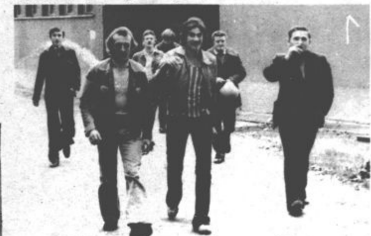
Rudarji so zadovoljni zapuščali garderobe po uspešno opravljeni delovni akciji.