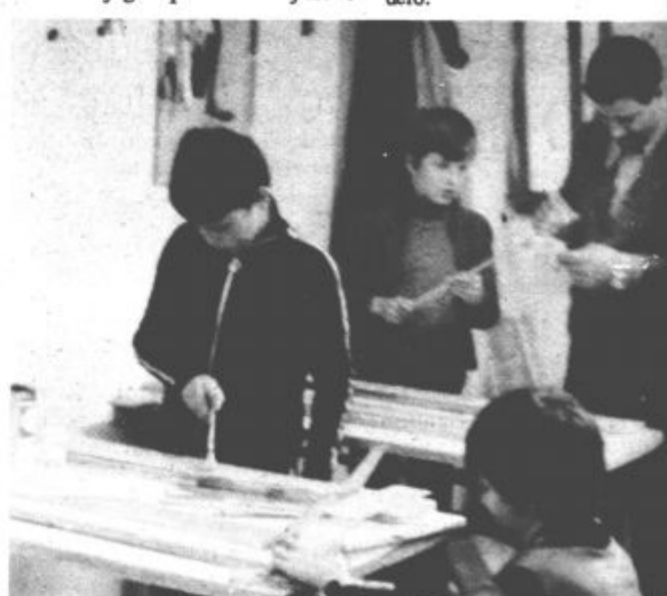
Mladim modelarjem pomagajo inštruktorji

Za naslednje leto so si začrtali pester delovni program, ki med drugim vsebuje izdelovanje letalskih, motonautičnih in brodomodelov, maket ter kombiniranih vozil in seveda sodelo-