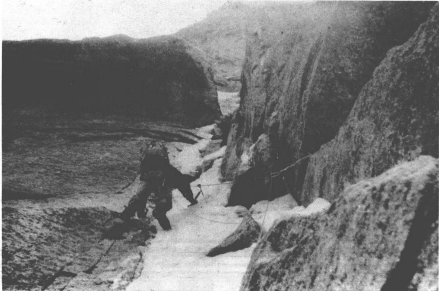
Plezalni detajl iz Severne stene Druja

Utruženi, mokri a vendar bogatejši za vzpon, ki ga v takih razmerah ne bi želeli ponavljati nikoli več.