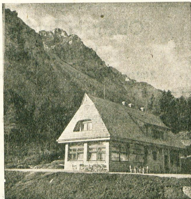
Turistična društva v Težiču