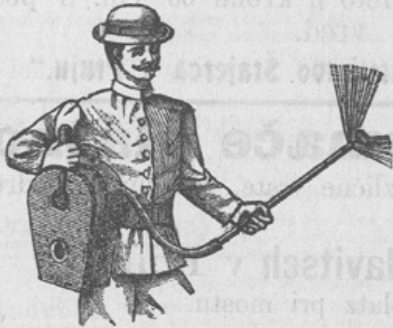
Zastopniki se iščejo!

Trijerji (čistilni stroji za žito) v natančni izvršitvi. Sušilnice za sadje in zelenjavo, škropilnice proti peronospori. Zboljšani sestav Vermorelov. Mehovi za žvepljanje trt. Mlatilnice, mlinci za žito, stiskalnice (preše) za vino in sadje različnih sestav. Slamoreznice jako lahke za goniti in po zelo zmernih cenah. Stiskalnice za seno in slamo, ter vse potrebne, vsakovrstne poljedeljske stroje, prodaja v najboljši izvršitvi