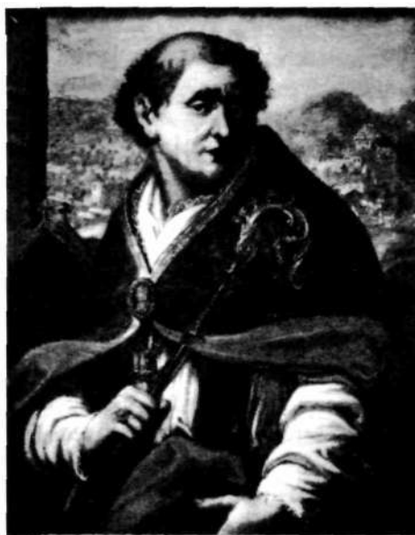
Freisinški škof Abraham

se imenuje Domnus . Da se je izvolitev Abrahama izvršila kmalu po smrti sv. Lantperta, namreč 957, o tem ni treba dvomiti. Temu ne nasprotuje niti dejstvo, da na Abrahamovem nagrobniku piše, da je umrl leta 992 in da je bil na čelu škofije 37 let, tako da bi bilo najbrž treba reči, da je bil izvoljen Kristusovega leta 955, poudarjam, tudi to ne nasprotuje. Kajti to pričevanje niti ni tako pomembno, saj nikakor ni iz istega časa, torej iz desetega stoletja, temveč mnogo poznejšega datuma, posebno še, ker Kristusovo leto 992 tu ni izraženo z rimskimi številkami oziroma s črkami, ki pomenijo tudi številke, temveč z arabskimi številkami oziroma ciframi, za katere Atanazij Kirher