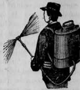
Cenike in spričevala zastoj.

Triljeri (čistilni stroji za žito) v natančni izvršitvi. Sušilnice za sadje in zelenjavo, škroplilnice proti peronospori, poboljšani sestav Vermorelov. Aparate za sumporavanje lozov. Mlatilnice, mlinci za žito, stiskalnice (preše) za vino in sadje različnih sestav. — Samoreznice jako lahko za goniti in po zelo zmernih cenah. Stiskalnice za seno in slamo, ter vse potrebne, vsakovrstne poljedelske stroje, prodaja v najboljši izvršitvi.