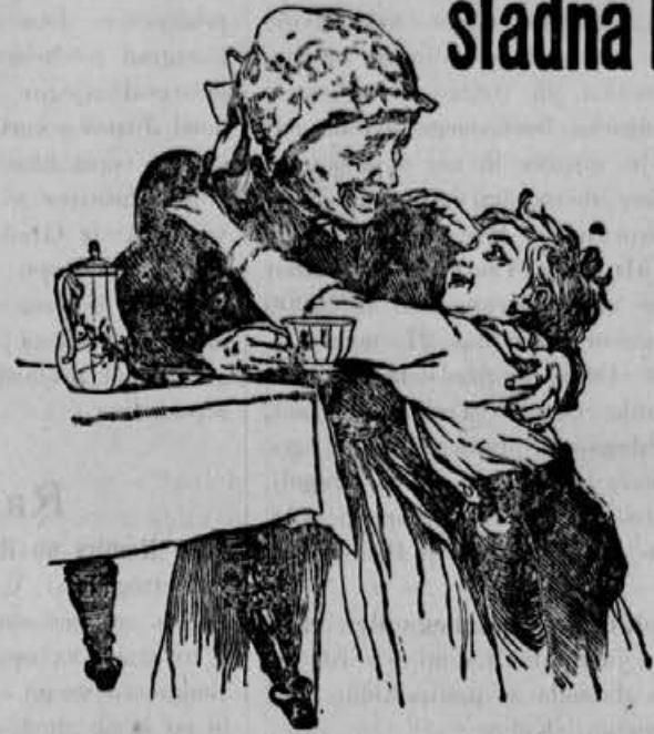
Mama mamica, se meni.

Že leta sem izpričano izvrstna primes k bobovi kavi. — Pri živčnih, srčnih, želodčnih boleznih, pri pomanjkanju krvi etc. zdravniško priporočena. — Najpriiljubljenejša kavina pijača v stotisočero rodovinah.