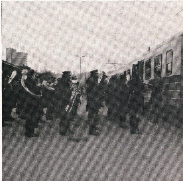
Posebej prijetno je bilo tega dne od 12. uri na železniški postaji v Ljubljani. Železničarska godba iz Zidanega mosta je pospremila opoldanski vlak, ki je odpeljal proti Kamniku. S tem so se železničarji in drugi delavci spomnili daljnih dni, prehojene poti, problemov in težav, spomnili pa so se še tudi nalog, ki jih čakajo do osrednje prireditve, ki bo 15. junija letos.

Železniška postaja je slovesno okrašena pričakovala potniške vlake, ki so pripeljali v Kamnik 28. januarja. Tega dne pred natančno 100 leti je namreč pripeljal v Kamnik, po novo zgrajeni progi prvi potniški vlak. Slovesnosti so bile tudi na drugih postajah, vse do Ljubljane.