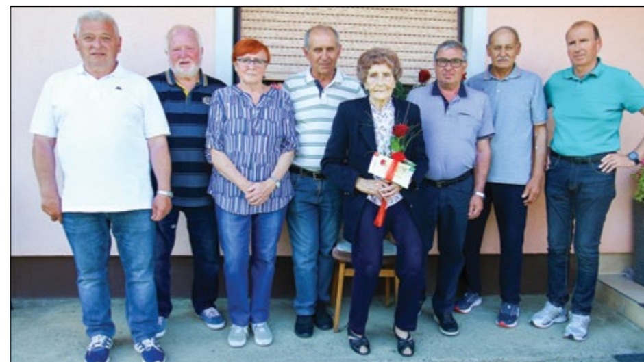
V veseli družbi sem kar pozabila na domotožje. Obljubili smo si, da se spet srečamo čez deset let.