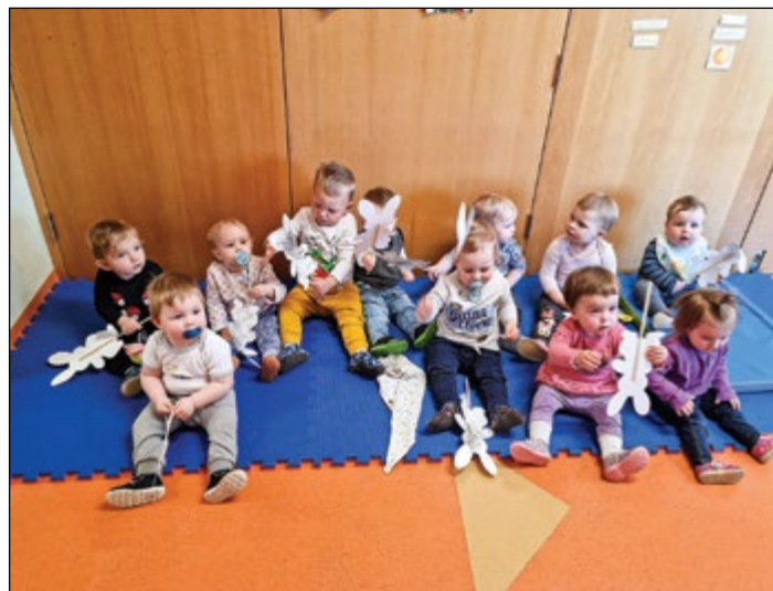
V roza igralnici nas je obiskal Velikonočni zajček in nam pomagal izdelati lutke na palici.