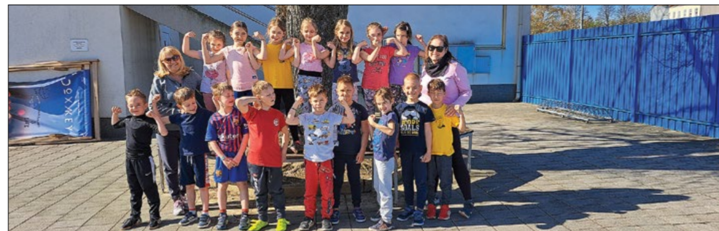
Učenci 1. b tik pred merjenjem tekov na športnem dnevu za učence razredne stopnje