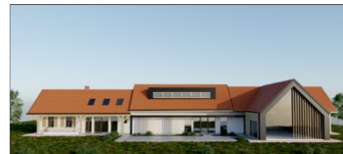
Načrt novega objekta

Nov turistični projekt Občine Hajdina je dobil tudi zanimivo