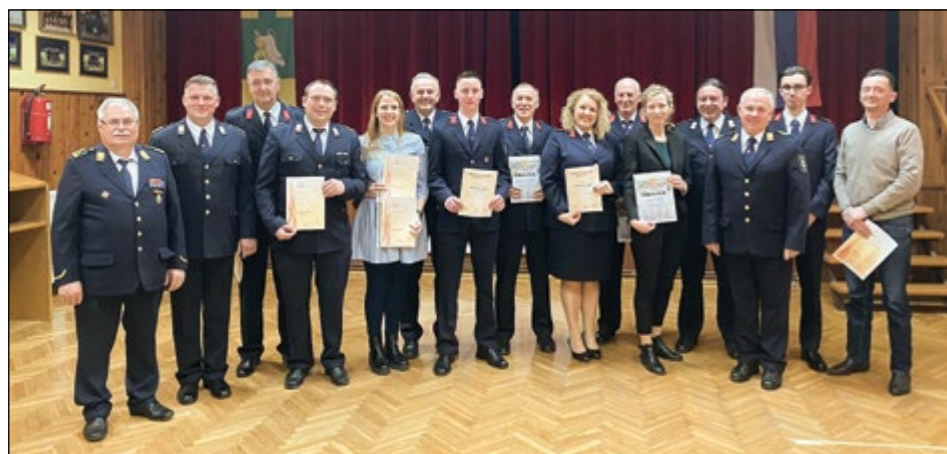
Letošnji nagrajenci na občnem zboru PGD Hajdoše