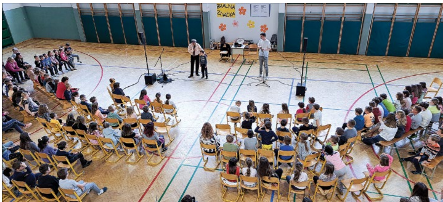
Polna telovadnica najmlajših bralcev ob zaključku Bralne značke