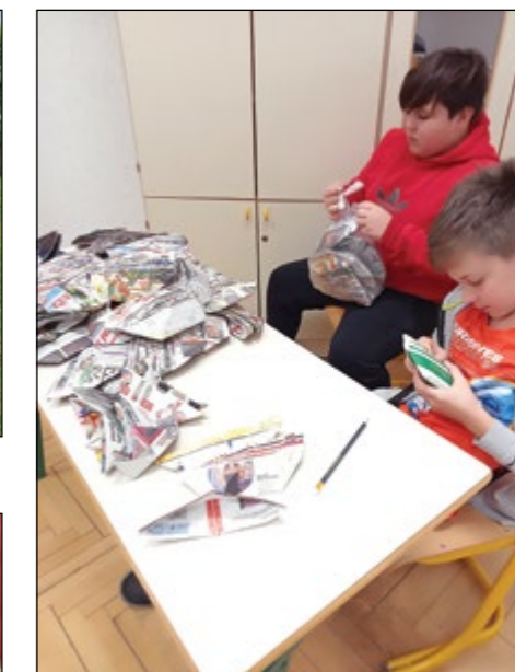
Učenci naše šole so izdelovali papirnate ladjice in sodelovali v dobrodelnem projektu mariborskega društva Up-ornik »6.000.000 ladjic za 6.000.000 žrtev«.