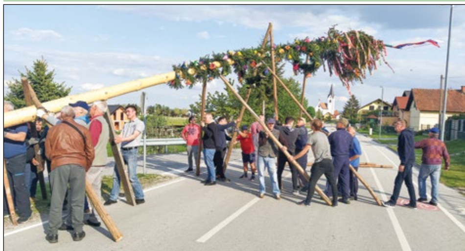
Vaščani Zg. Hajdine so še pred praznikom dela tradicionalno postavili majsko drevo pri Sitarjevi kapeli, kjer je bilo tudi praznično druženje.