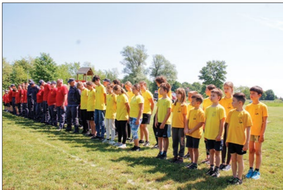
Ekipe GPO Hajdina so v maju v Dražencih preverjale operativne sposobnosti in obnovile gasilsko znanje.