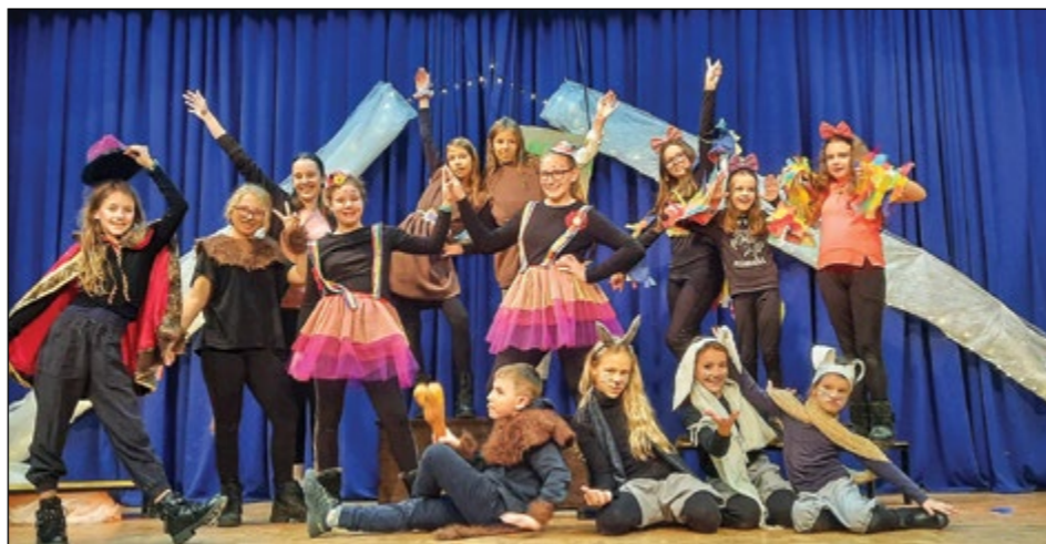
Otroška gledališka skupina Bonbončki na območni reviji

V Kulturnem društvu Skorba se po krajšem premoru spet veliko dogaja. Društvo je 13. marca v sodelovanju z društvi na vasi in vaškim odborom pripravilo prisrčno proslavo ob materinskem dnevu.