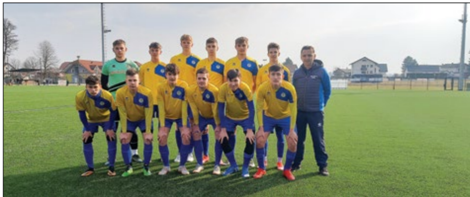
Ekipa U17 ONŠ Golgeter Hajdina.

tudi naši najmlajši nogometaši, stari od 5 do 7 let.