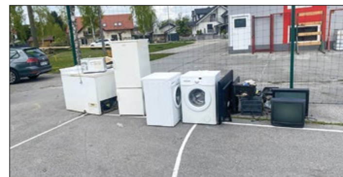
V Slovenji vsi so gasilci zbrali kar lepo količino odpadnega železa.

V akcijo smo vključili celotno vas, saj smo po gospodinjskih raznosili obvestila, da bo akcija potekala 22. in 23. aprila in da lahko vaščani prinesejo odpadne kovine, tudi električne aparate, v zabojnik podjetja Surovina, ki nam je akcijo tudi omogočilo. Zabojnik je bil postavljen na igrišču v Slovenji vasi, v neposredni bližini gasilskega doma. Večje kose odpadkov smo pobirali tudi po gospodinjskih.