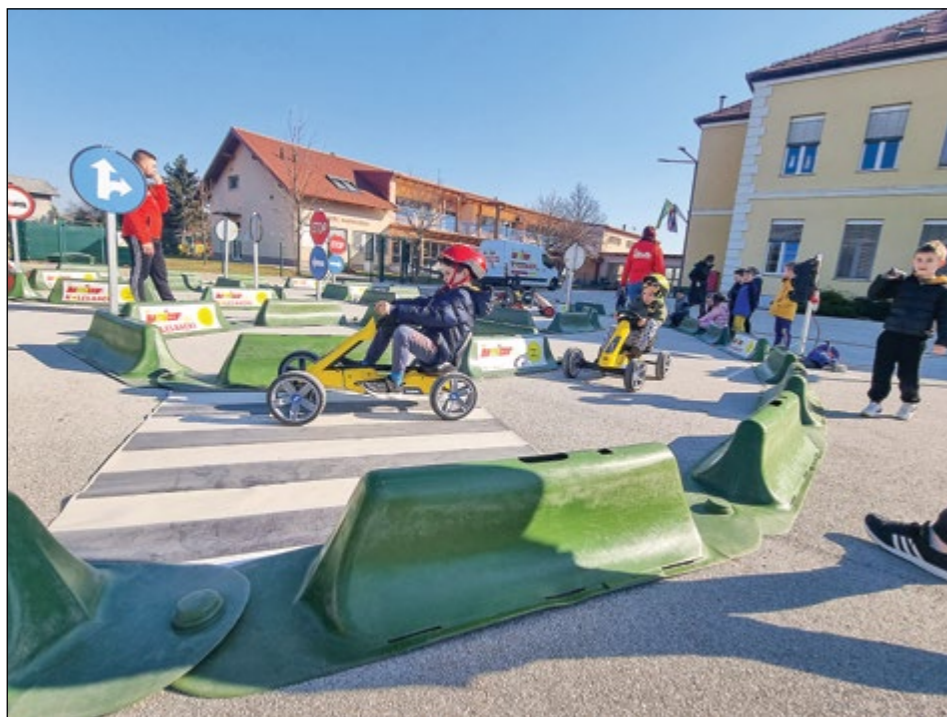
Najmlajši vozniki na poligonu

Na OŠ Hajdina smo neprestano v pogonu, smo aktivni, odgovorni ter skrbimo zase in za druge. Po dolgem času smo spet imeli možnost, da se lahko učenci v šoli in otroci v vrtcu preizkusijo v spretnostih in veščinah, ki so jih do sedaj že usvojili, zagotovo pa so spet dobili kakšno novo informacijo.