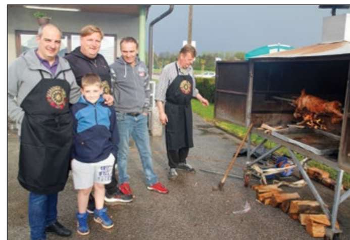
Domačini so poskrbeli, da so bile mize polne dobrot.