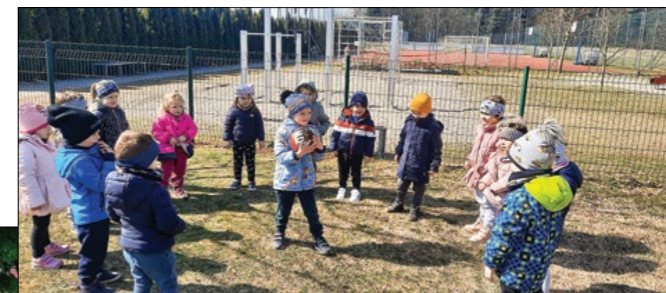
Radi smo v naravi. Gibanje na svežem zraku nas krepi, razvedri in nasmeji (zelena igralnica).