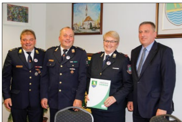
V prostorih občine Hajdina je bil podpis aneksov k pogodbam o opravljanju javne gasilske službe za leto 2022.