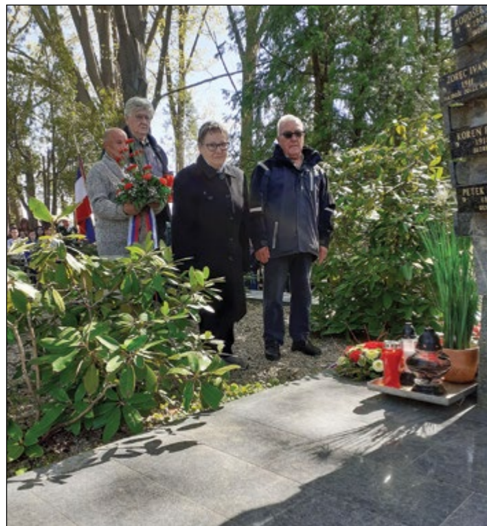
Poklonili smo se padlim in k spomeniku položili cvetje.