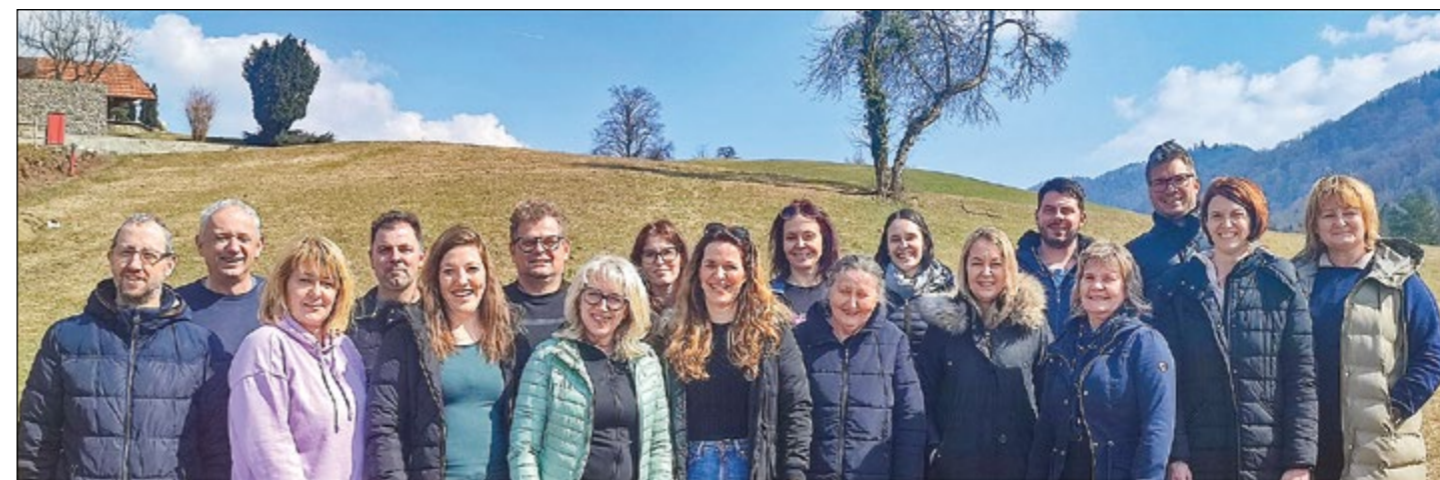
Člani zbora Gandin na prvih intenzivnih pevskih vajah