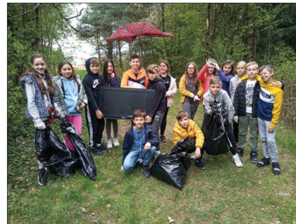
Učenci 5. a sporočajo: »Bodi frajer, odpadkov ne meči v naravo!«

V sredo, 20. aprila, smo na OŠ Hajdina predali namenu našo novo pridobitev, zunanji trampolin, ki bo še polepšal in popestril naš otroški svet gibanja in veselja. Veseli in razigrani otroci pa so tisti, ki si želijo še več novih znanj in izkušenj.