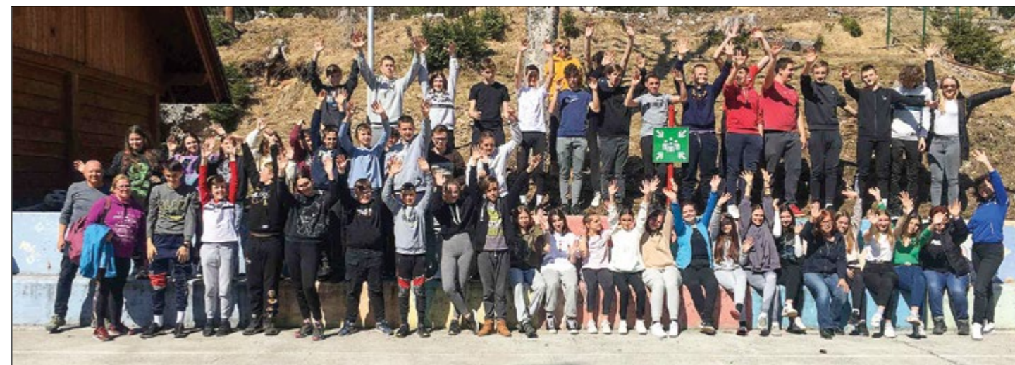
Vsi udeleženci tabora v Trilobitu

Učenci 8. in 9. razredov so se od 21. do 25. marca udeležili tabora v ČŠOD Trilobit v osrednjem delu Karavank, med Golico in Stolom, na nadmorski višini 960 metrov. Razvijali so veščine za preživetje v naravi.