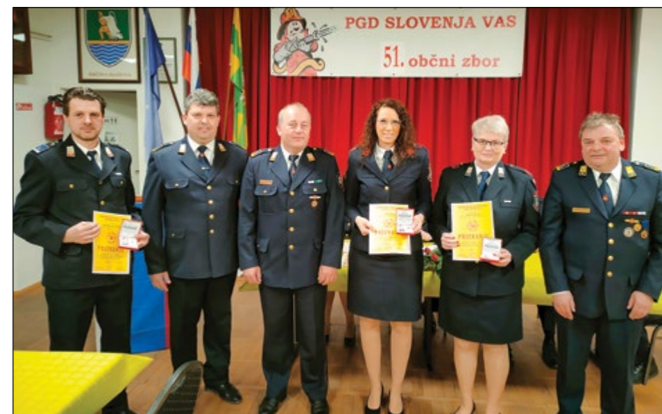
Prejemniki priznanja OGZ Ptuj s podeljevalci. Čestitamo!