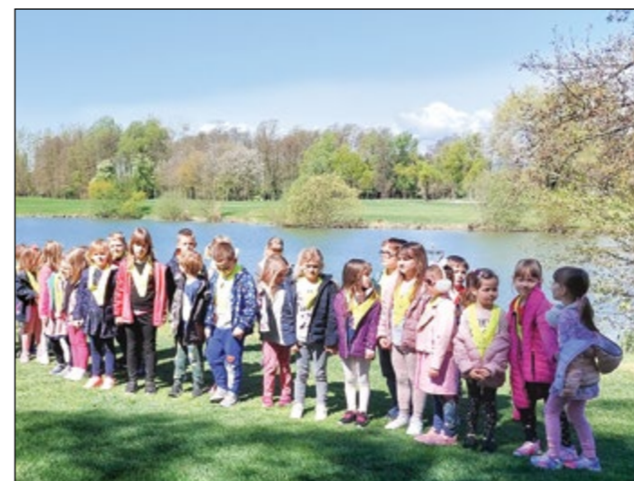
Ogled jezera sredi igrišča za golf (rdeča igralnica)