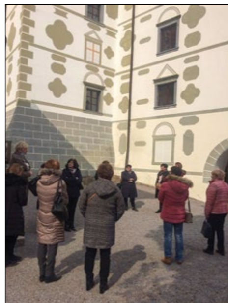
Ogled zanimive zunanosti in pestre notranosti dvorca Strmol

sti, kjer razstavljajo svoja dela priznani mednarodni likovni umetniki. Na ogled je bila tudi razstava »Od glažute do steklarne« s prečudovitimi steklarskimi izdelki. V prostorskem okviru dvorca redno deluje tudi Rokodelski center Rogatec s steklarsko, lončarsko in tkalsko delavnico, kjer se tamkajšnji prebivalci in okoličani ter predvsem učenci učijo spretnosti teh tradicionalnih geografskih obrti. Pohvalno! Po kratkem okrepčilu v centru kraja jih je pot vodila še na ogled največjega slovenskega muzeja na prostem. Pot in ogled sta jih vodila vse od viničarske hiše, kjer ji je čakala tradicionalna zakuska, do stanovanjske hiše, mimo kozolca, »štaluncov«, gospodarskega poslopja do kovačnice, kjer so bili na ogled tudi številna orodja in stroji iz preteklosti, nekateri skoraj že poza-