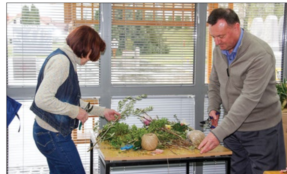
Kako so nastajali hajdinski presmecci ...