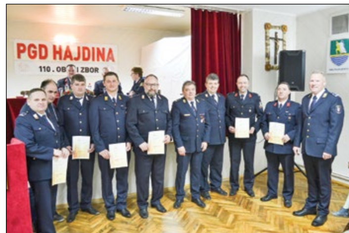
Po uspešno končanem izobraževanju