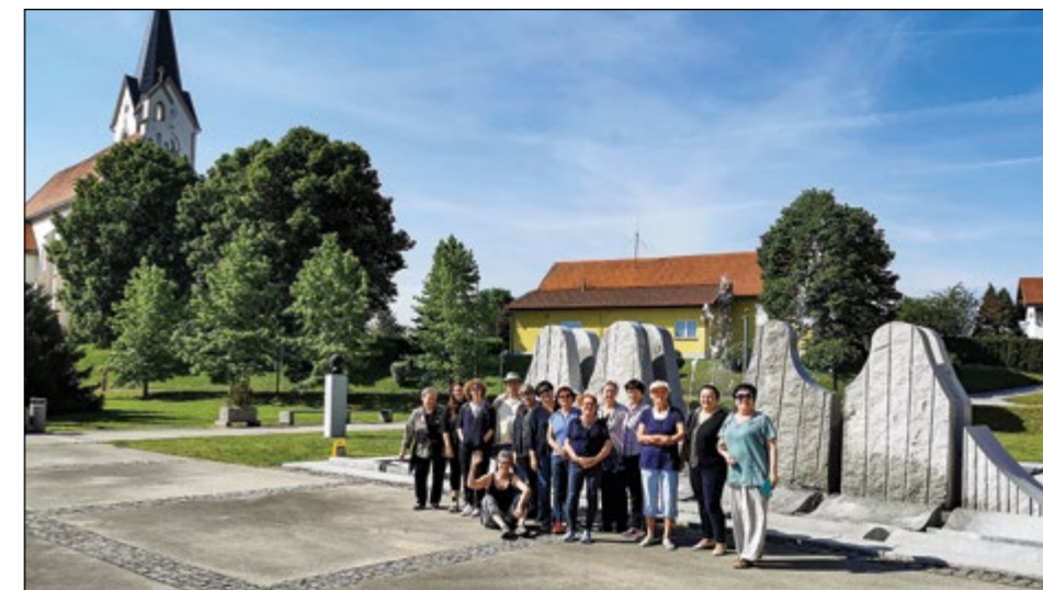
Kljub neobetavni napovedi je bil čudovit sončen dan. Temu primerno je bilo tudi ustvarjalno počutje vseh, ki so se odzvali povabilu na sobotno likovno delavnico na prostem.