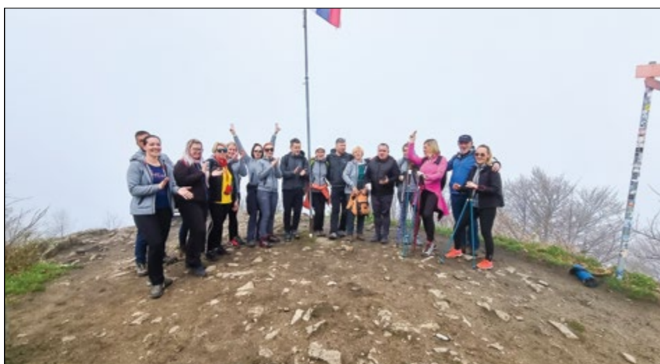
Učitelji šole so se na vrhu Donačke gore pridružili Vseslovenskemu petju s srci.