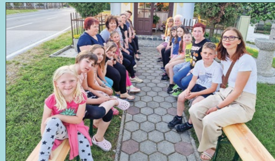
Eden od majskih večerov, ko so bili župljani Zg. Hajdine zbrani na šmarnicah pri Sitarjevi kapeli.