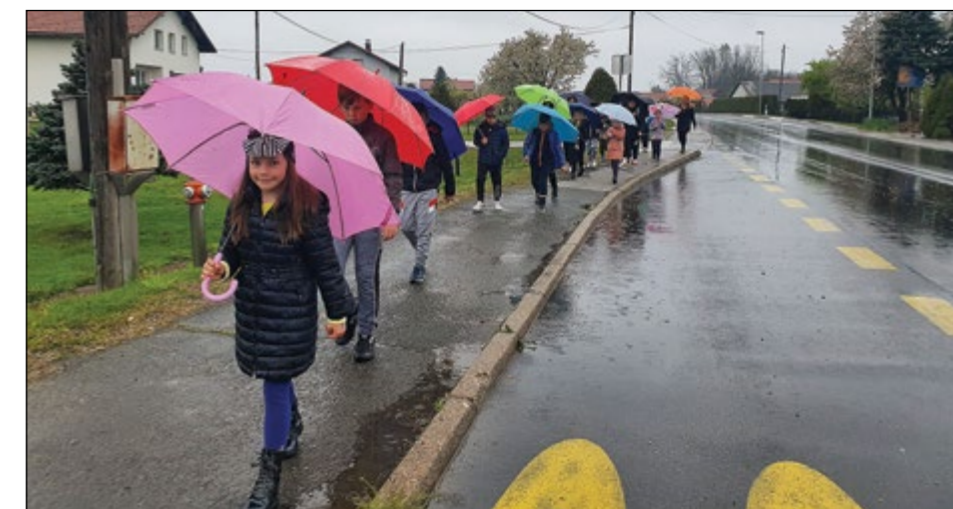
Do šole peš pod dežniki

Besedilo in foto: Janja Bratuša, mentorica Prometne varnosti