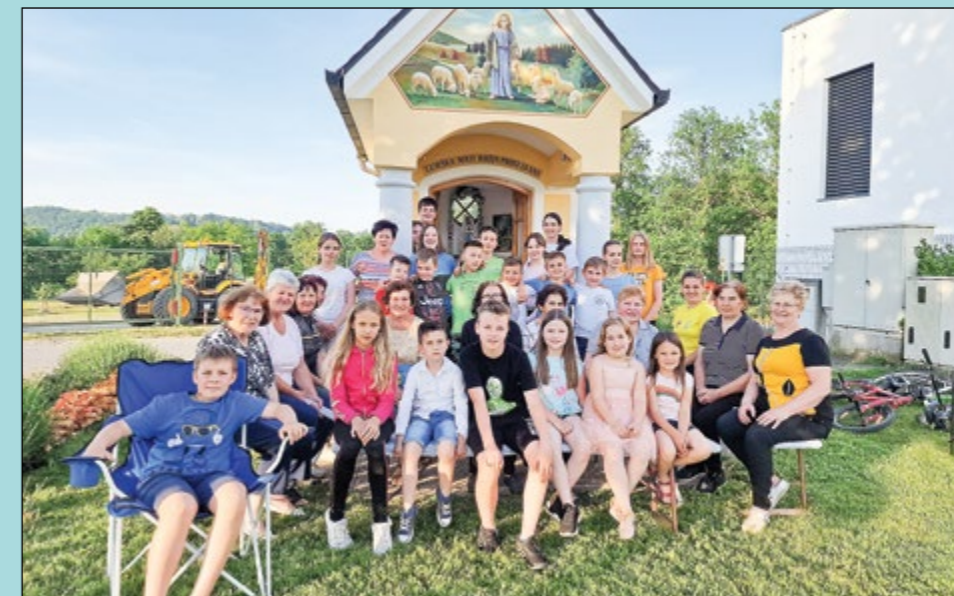
Šmarnična pobožnost ima lepo tradicijo tudi v hajdinski župniji. Vsak majski večer je lepo pri šmarnicah pri hajdoški kapeli.