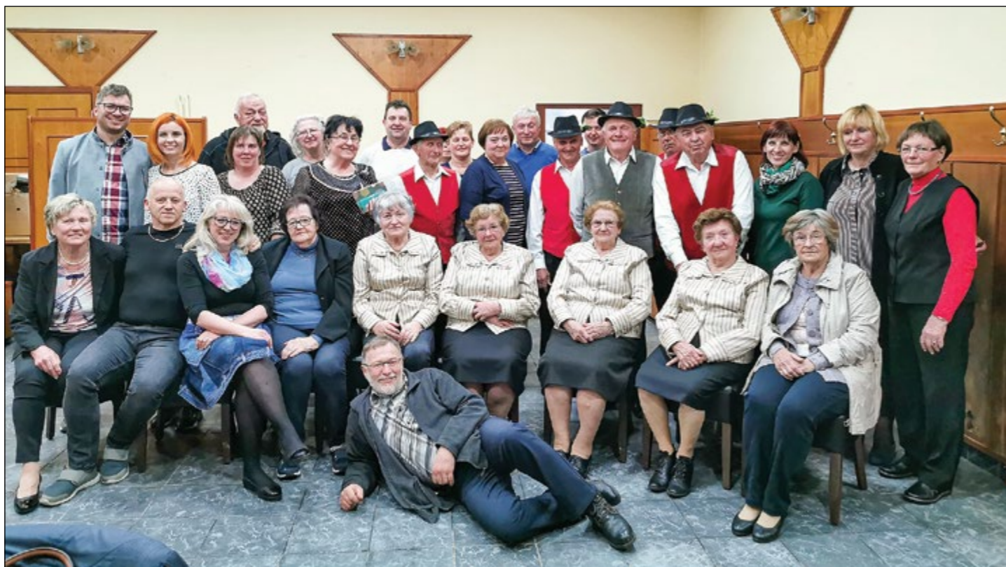
Ljudski pevke in pevci so tokrat dokazali, da znajo zapeti tudi skupaj. Mogoče se bo v prihodnje iz njihovega sodelovanja rodil Mešani pevski zbor Društva upokojencev in KPD Stane Petrovič Hajdina.