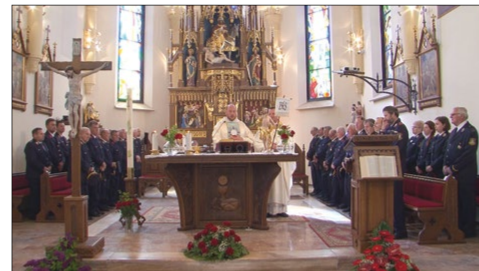
Na Florjanovo nedeljo v župnijski cerkvi sv. Martina na Hajdini

časnega in večnega ognja. Tako je še danes, saj to lepo tradicijo že vrsto let ohranjamo tudi gasilke in gasilci v občini Hajdina. Hvala vsem za do-