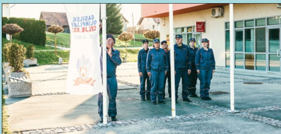
Na osrednjem občinskem trgu je bila 13. aprila krajša slovesnost z dvigom zastave gasilske olimpijade.