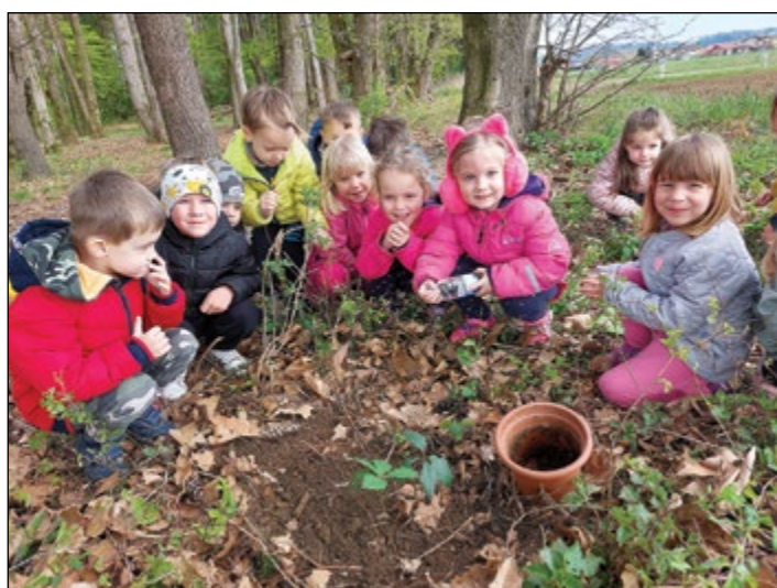
Ob dnevu Zemlje smo otroci in vzgojiteljci posadili tri mladike dreves (rumena igralnica).