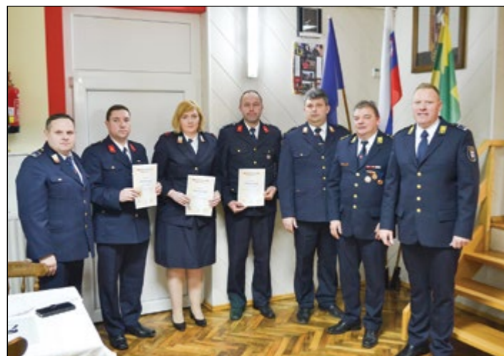
Prejemniki jubilejnega priznanja za večletno delo v gasilski organizaciji