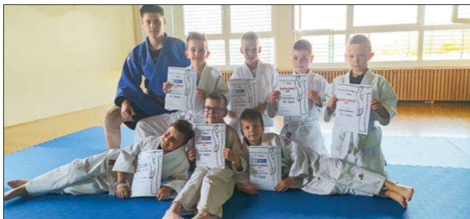
Mladi hajdinski judoisti so s pomočjo JK Drava Ptuj položili prvi pas IX. KYU.