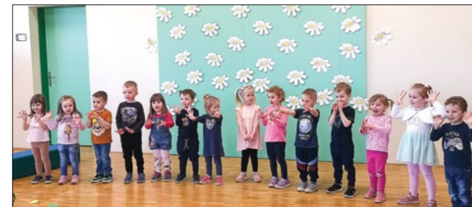
Za mame in očke, babice in dedke smo pripravili zanimivo spomladansko druženje s pesmimi, plesom, igrami in iskanjem zaklada (zelena igralnica).