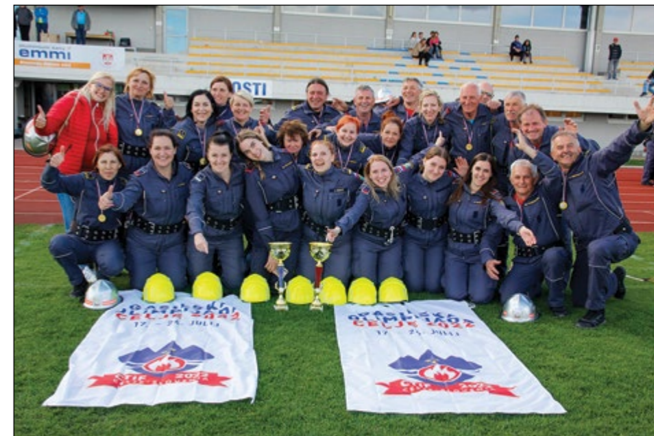
Na gasilsko olimpijado sta se znova uvrstili tekmovalni enoti članic B in članov B. Čestitamo!