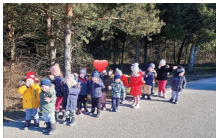
Otroci modre igralnice med sprehodom