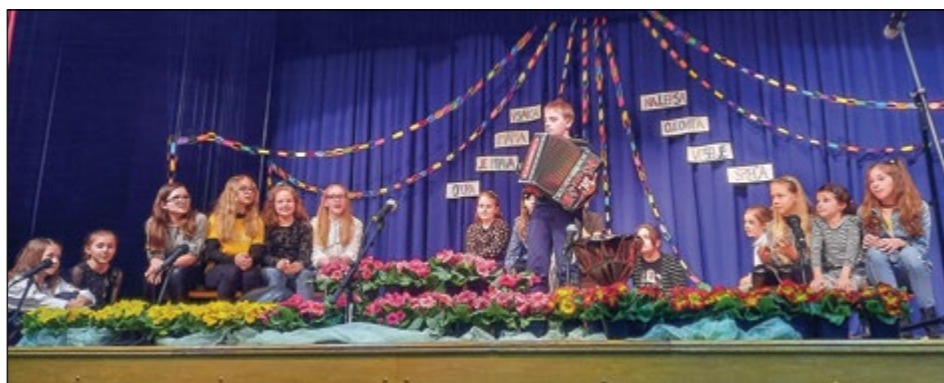
Utrinek z letošnje proslave ob materinskem dnevu

Otroška gledališka skupina Bonbončki KD Skorba se je 25. marca z igro Boncirkus predstavila še na območni reviji otroških gledaliških skupin Javnega sklada za kulturne dejavnosti, območne izpostave Ptuj. Nekateri člani gledališke skupine so ob tej priložnosti