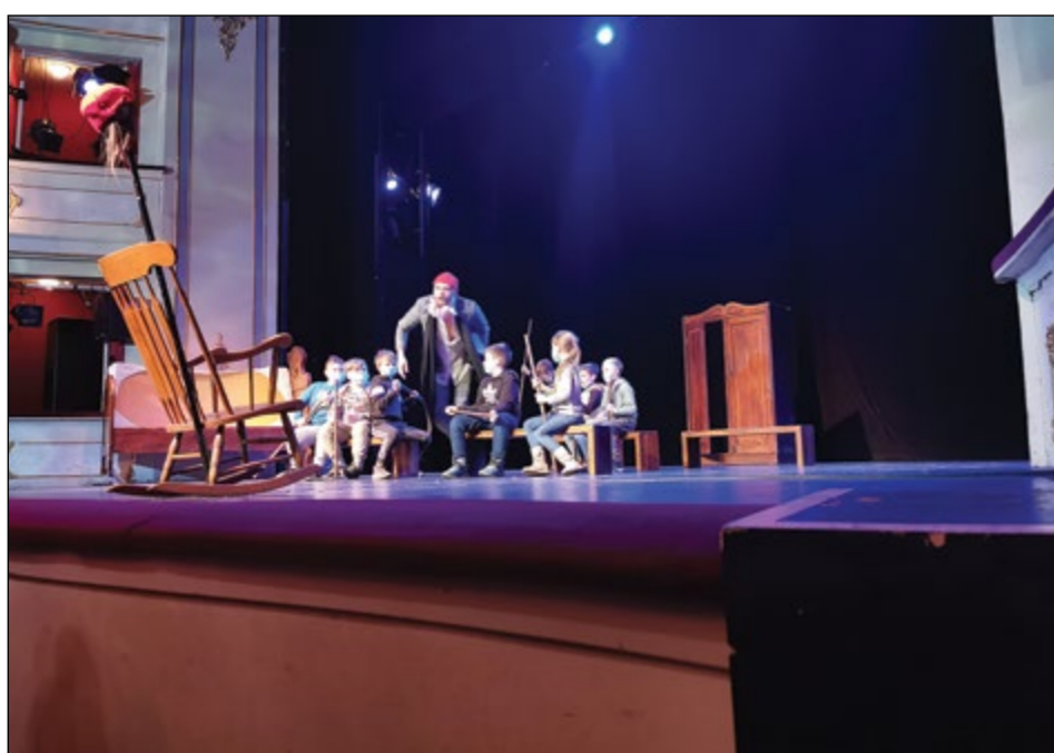
V marcu smo se z učenci 1.–5. razreda odpeljali v Maribor. Po ogledu kulturnih in naravnih znamenitosti smo si v SNG Maribor ogledali predstavo Mica pri babici.