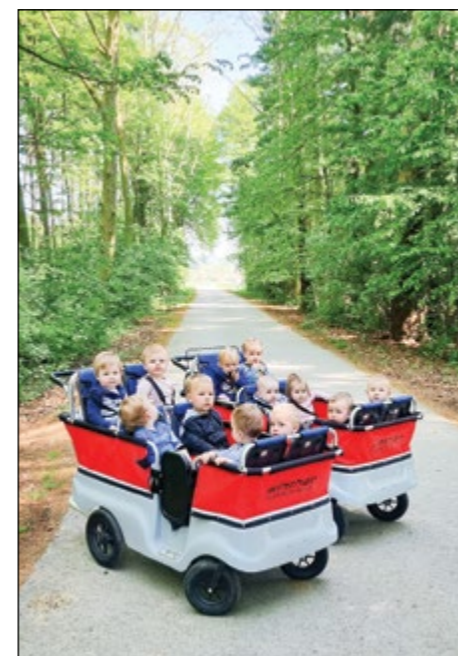
Otroci roza igralnice so se odpravili po poteh gozdnega škrate in opazovali drevesne krošnje.