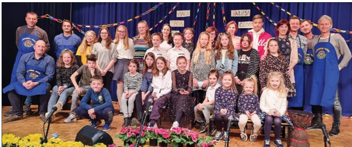
Na odru so se zbrali nastopajoči in vsi drugi, ki so poskrbeli za prijeten dogodek po proslavi.

Prijetno druženje so s kulturnim programom obogatili mladi gledališčniki KD Skorba in otroci ter mladostniki z glasbenimi in pevske točkami. Druženje je bilo znova prijetno, obdano s cvetjem, petjem, glasbo, otroško radoživostjo in dobro voljo. Prav takih druženj si predstavnice nežnejšega spola želijo tudi v prihodnje.