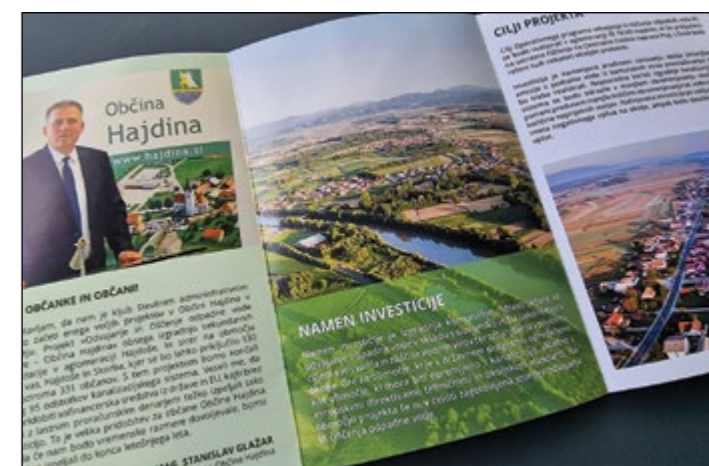
Več informacij o projektu si lahko preberete v zloženki, ki smo jo poslali na gospodinjstva v občini Hajdina.