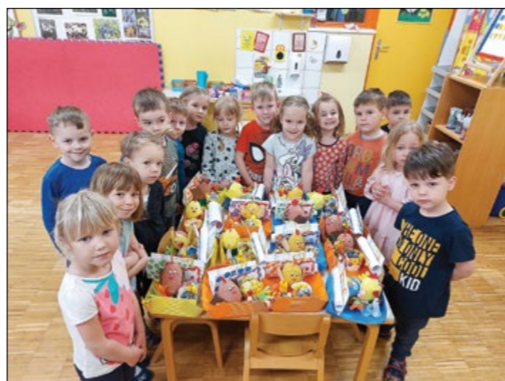
Obeležitev velikonočnih praznikov v rumeni igralnici