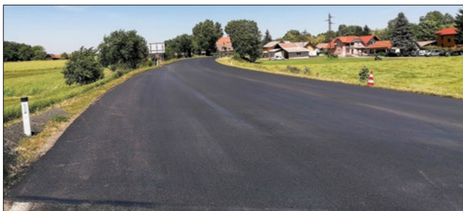
Preplastitev na odseku državne ceste na Sp. Hajdini pri OŠ je bila narejena v nekaj dneh. Naložbo je pokrila država.