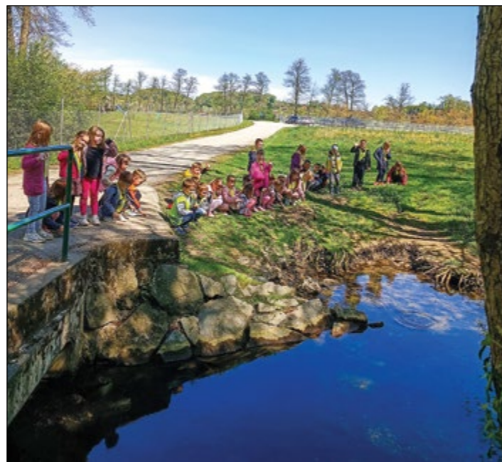
Otroci bele igralnice sodelujem v projektu Turizem v vrtcu. Tako letos spoznavamo vodo kot nujno potrebni vir za življenje. Izkoristili smo lep sončen dan in se ob raziskovanju zabavali.