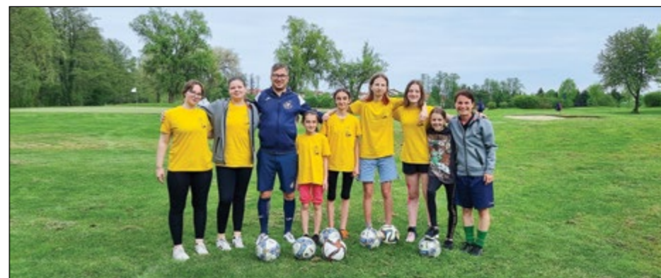
Spomladanskim treningom footgolfa so se pridružila tudi dekleta.