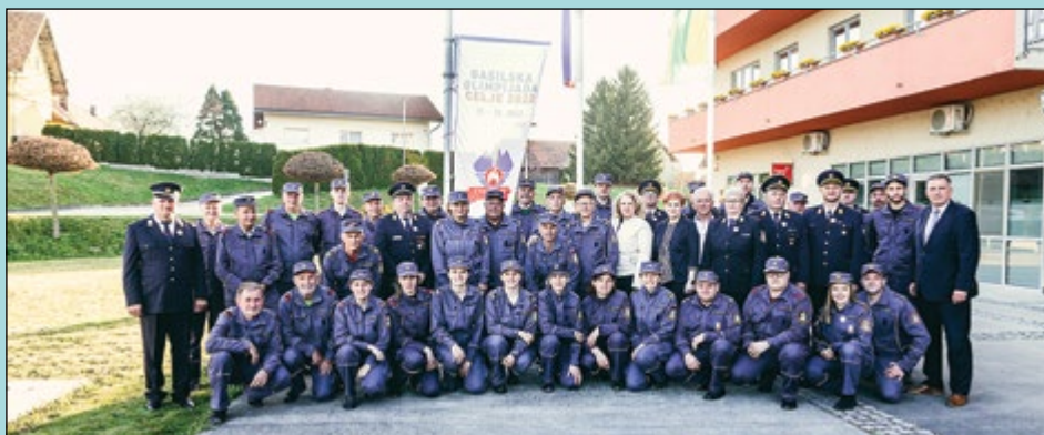
Še spominski posnetek vseh zbranih na slavnostnem dogodku, posvečenem letošnji gasilski olimpijadi, ki bo sredi julija v Celju.