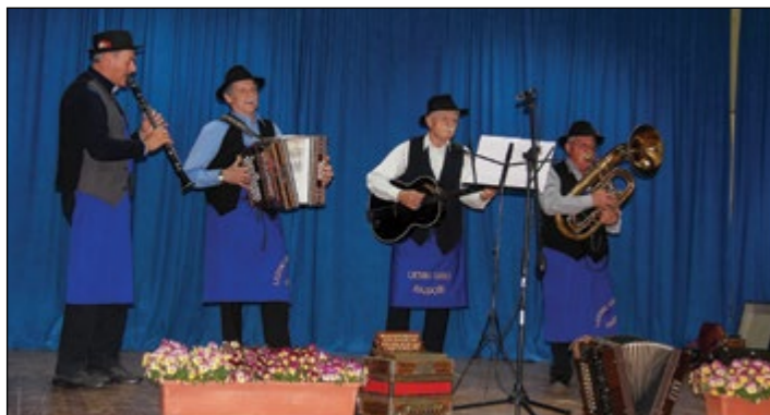
Ljudski godci KD Valentin Žumer Hajdoše so v aprilu predstavili svojo prvo zgoščenko.