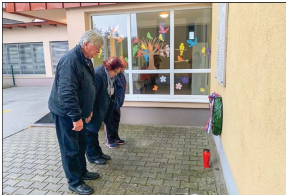
Poklon padlim pred spominsko ploščo pri OŠ Hajdina

Ob spremljanju kulturnega programa učencev OŠ Janka Ribiča Cezanjevci in nagovoru predsednika Združenja borcev za vrednote NOB Ljutomer smo se spomnili vseh, ki so jim bila v 2. svetovni vojni odvzeta