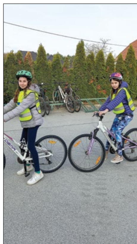
Petošolci se z opravljenim kolesarskim izpitom lahko kot kolesarji samostojno vključujejo v promet.