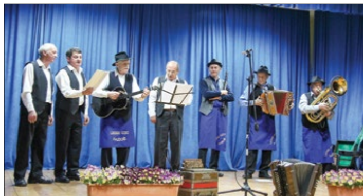
Na snemanju in tudi na odru so se hajdoškim godcem pridružili Prešmetani faloti iz Stoperc.