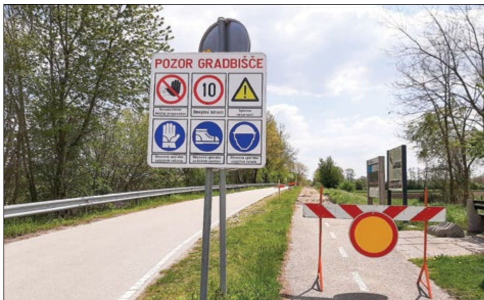
Obnova odseka obkanalske kolesarke v Slovenji vasi bo zaključena še pred poletjem.