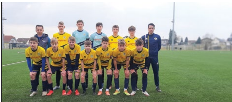
Ekipa U19 ONŠ Golgeter Hajdina