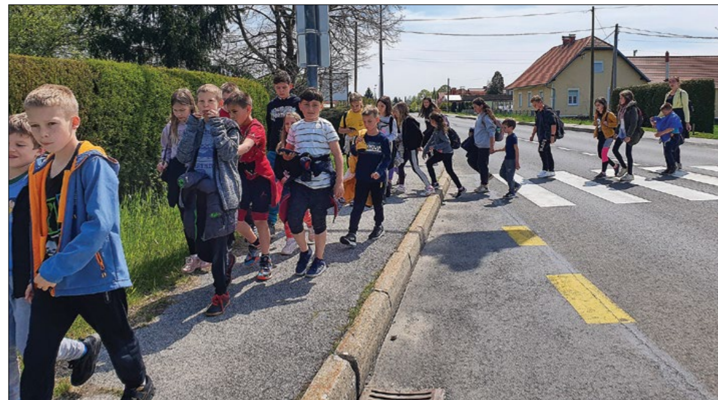
Domov peš v spremstvu sončka