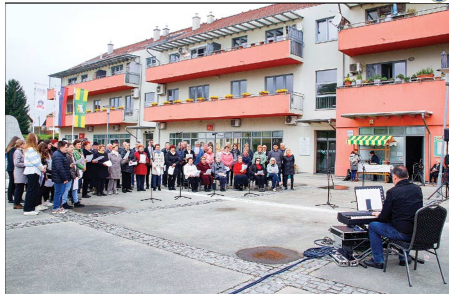
Na hajdinskem občinskem trgu so združeno zapeli pevci različnih generacij. Zbralo se jih je okrog 60.