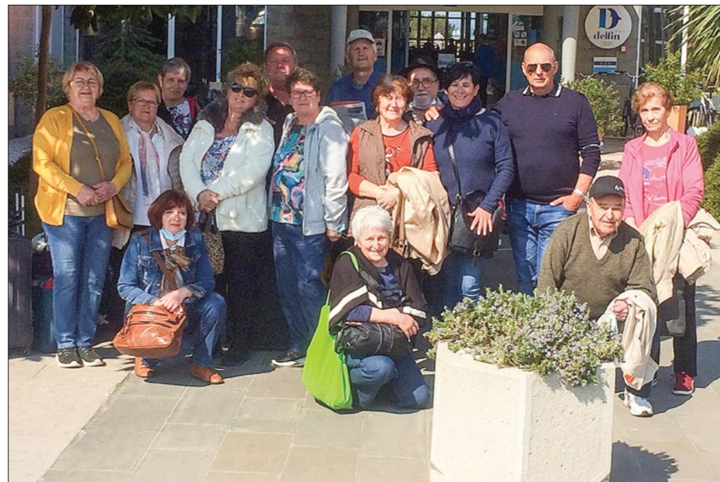
V Izoli še poslovilna »gasilska« ob slovesu