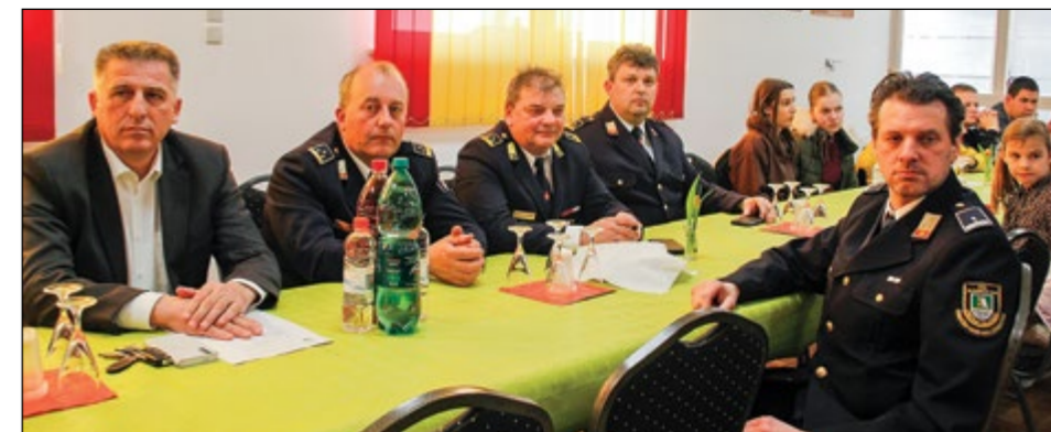
Gostje na delovnem srečanju PGD Slovenja vas