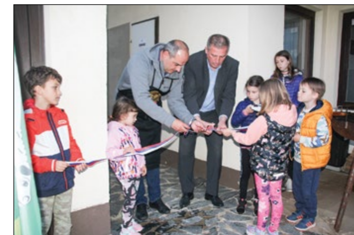
Slavnostni del in prerez vrvice pred prizidkom ob objektu ŠD Skorba