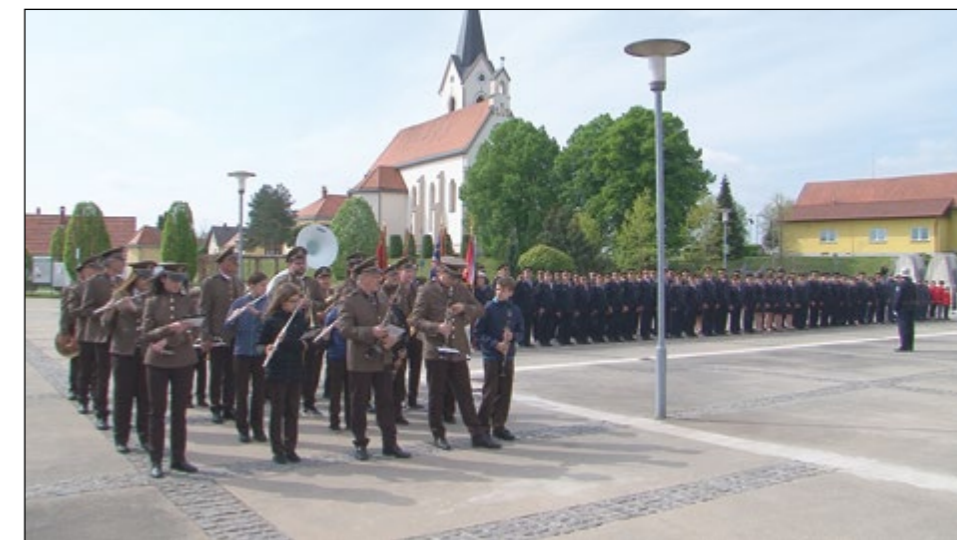
Gasilci so se na Florjanovo nedeljo po dveletnem premoru spet zbrali na občinskem trgu.