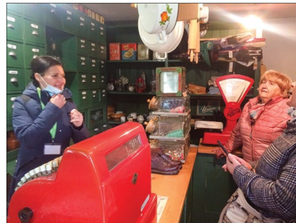
V sklopu muzeja na prostem obratuje tudi tradicionalna trgovina »Lodn«, ki je nekatere dobesedno postavila v obdobje njihovega otroštva in mladosti.