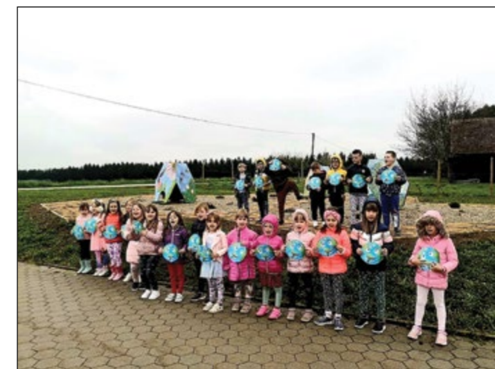
Otroci rdeče igralnice ob praznovanju dneva Zemlje