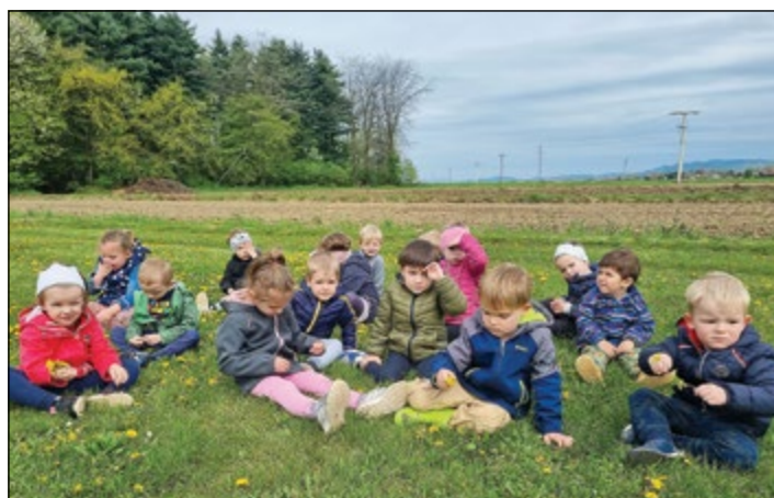
Spomladansko raziskovanje in opazovanje narave v modri igralnici