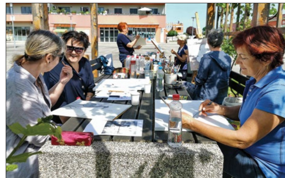
Sčasoma se je že prilegla senca pod brajdo.

nju s telefonom. Če je kdo zainteresiran, ga vabimo, da se nam pridruži, ne glede v katero starostno skupino sodi. Ko bo na tel. št. 040 258 964