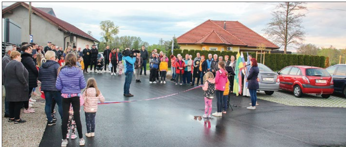
Otvoritvena slovesnost na novem parkirišču v Skorbi