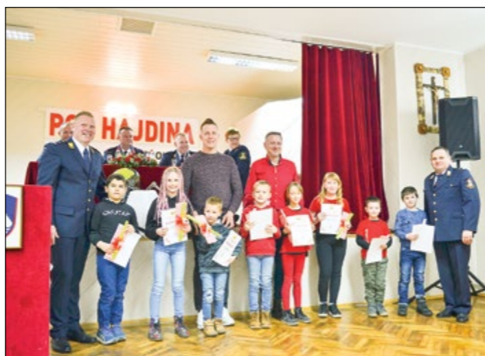
Čestitka novim članom PGD Hajdina