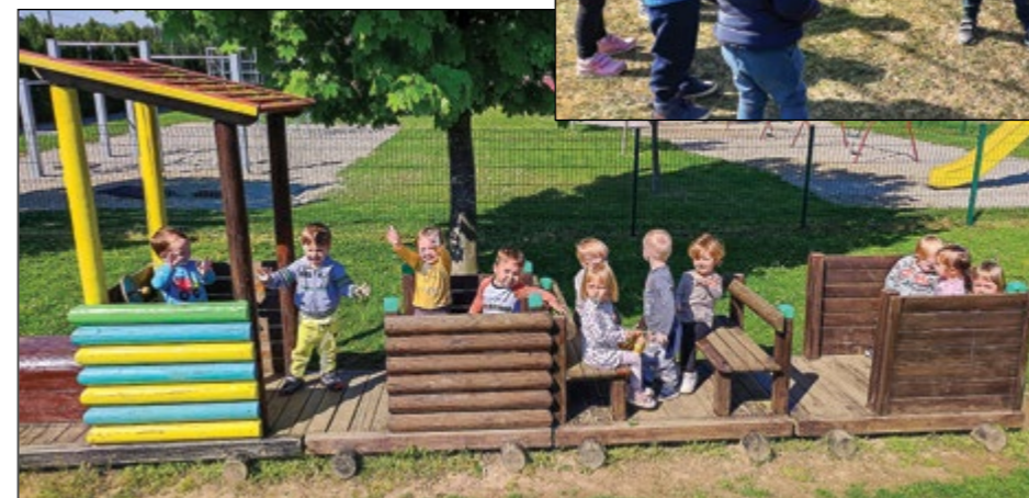
Otroci iz oranžne igralnice so v teh lepih in toplih dnevih veliko časa prežveli ob igri na prostem.