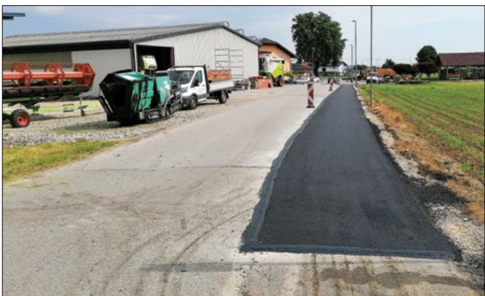
Uredili smo manjkajoči del kolesarske poti nasproti gostilne Rajh v Dražencih.