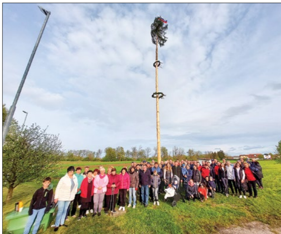
V Hajdošah zbrani vaščani, potem ko je bil mlaj že postavljen.