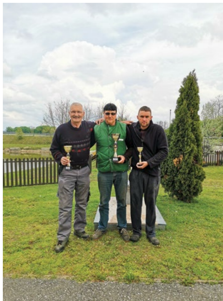
Ribiški utrinki iz Draženske jame