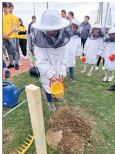
Pomoč učencev šolskega čebelarskega krožka pri sajenju medovitih dreves