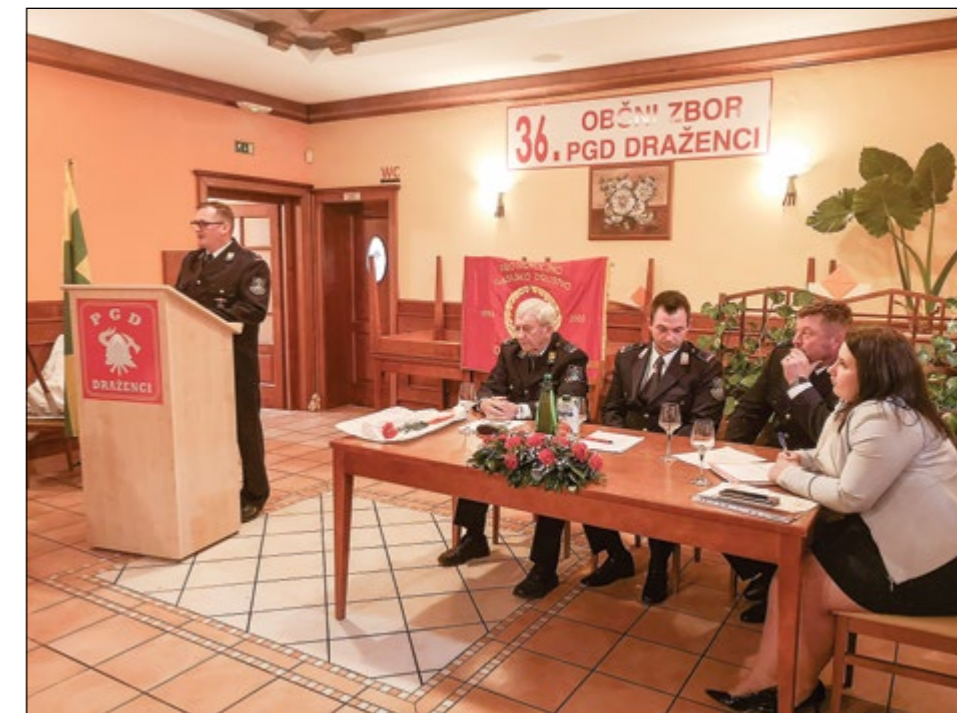
Utrinek z občnega zbora članov PGD Draženci

ga gasilca. V društvu so bile opravljene tudi nekatere specialnosti.