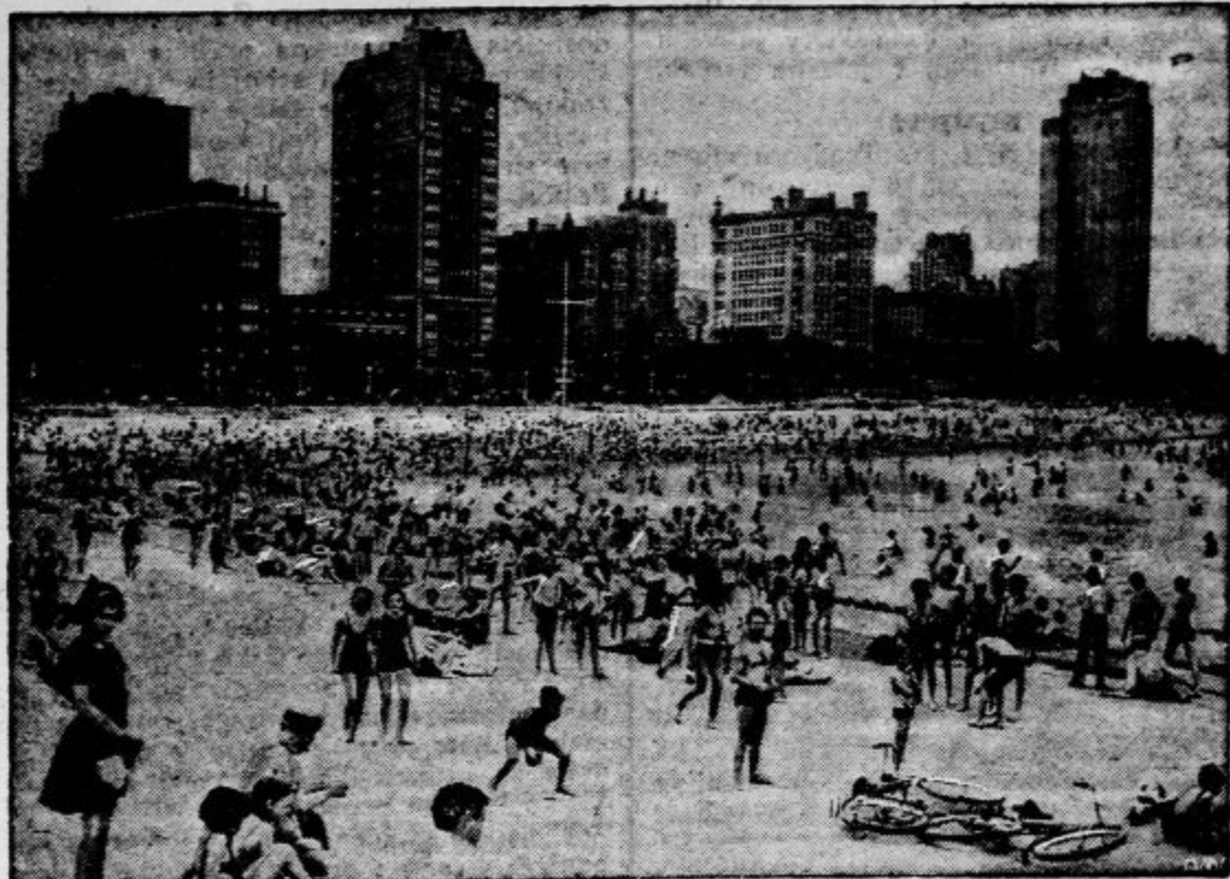
V Chicagu ob Michiganskem jezeru je v poletnih dnevih takšen vrvež, kakor bi si ga človek ne predstavljal spritno teh nebotičnih zgradb