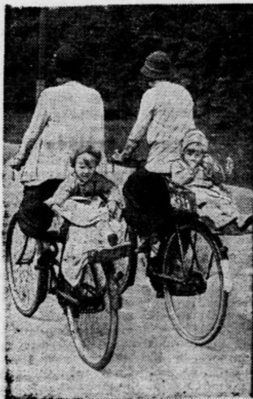
Angleške matere vozijo na svojih kolesih tudi otroke s seboj na izlete. V ta namen jim rabi izvrstno sedež nad zadnjim kolesom