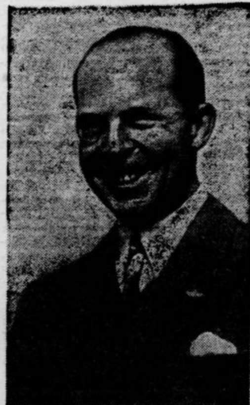
princ Pavel, ki so se o njem nedavno raz- širile vesti, da si je izbral zaročenko iz vrst grškega meščanstva, čemur pa njegov brat, sedanj grški kralj, odločno nasprotuje