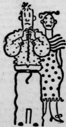
»Kaj, nov klobuk bi rada imela? Kje pa naj vzamem denar zanj?« »Drago, to me niti najmanj ne zanima.« (»Söndagsnisse Strix«)