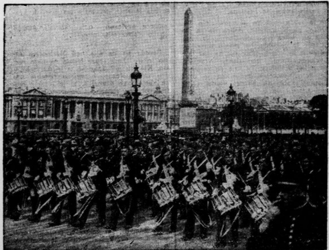
Te dni otvarjajo v Parizu belgijski paviljon. Na sliki vidimo belgijsko godbo, kora- kačo po Place de la Concorde