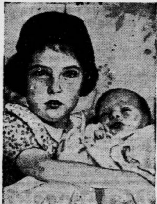
Štiriletna bolgarska princesa Marija Luiza s svojim malim bratcem, prestolonasledni- kom Simeonom