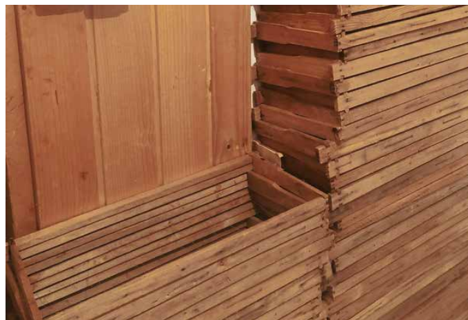
Očiščeni, v vrelem lugu razkuženi in posušeni satniki čakajo na ponovno uporabo.

Rojenje je naraven pojav čebeljega razmnoževanja, ki se je evolucijsko razvijal milijone let, pri kranjski sivki pa so ta nagon še potencirali naši predniki z večstoletno uporabo dosledno premajhnih panjev. Večji del slovenskega občestva žal nadaljuje s to zablodo, čeprav pomeni rojenje poraz sodobnega čebelarjenja in res ne