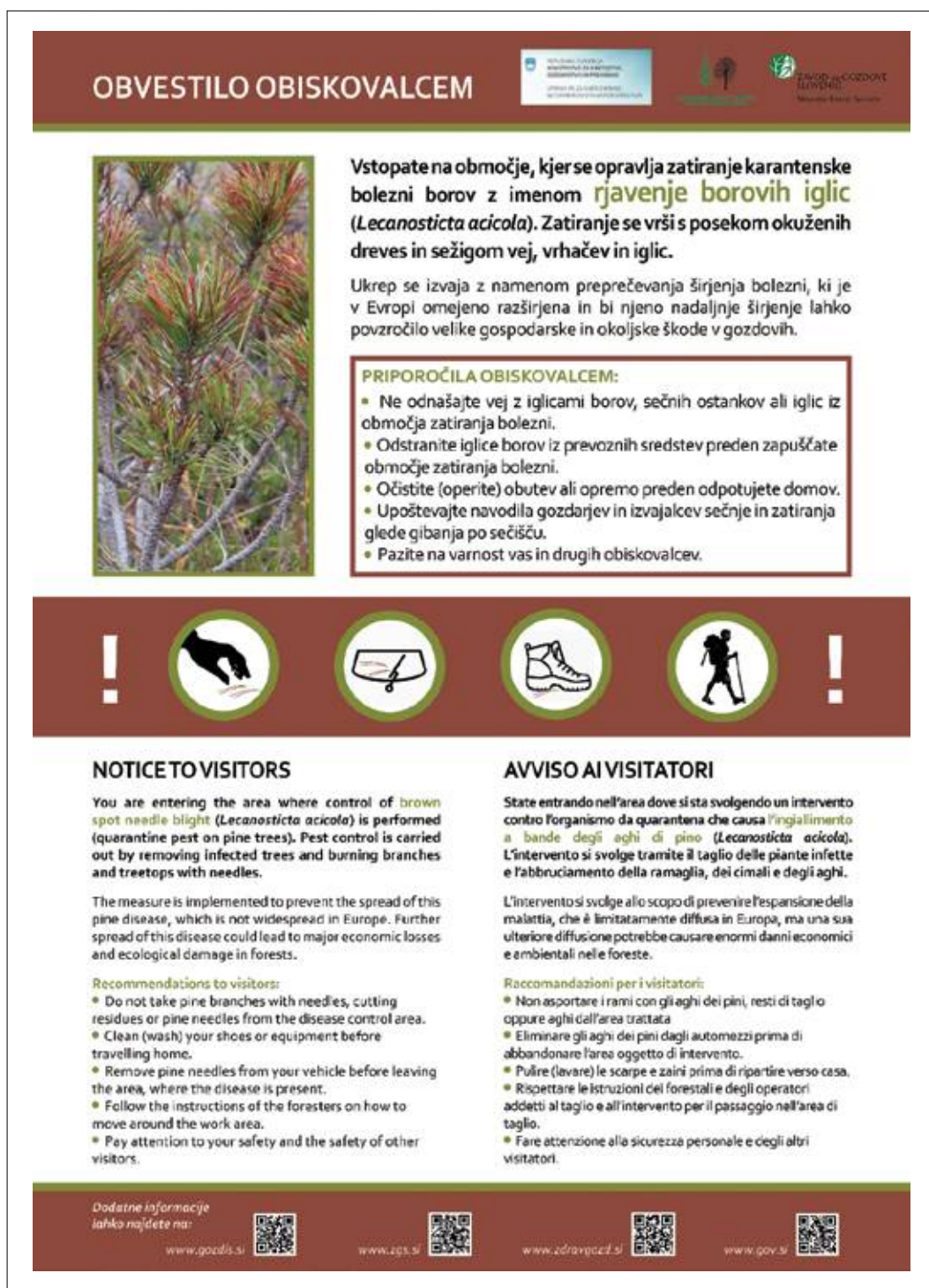
Slika 3: Informativne table so vsebovale kratek opis bolezni in opozorilo obiskovalcem območij, kjer so izvajali ukrepe zatiranja bolezni rjavenja borovih iglic. Zaradi turistične obremenjenosti in bližine Italije je bilo besedilo v slovenščini, angleščini in italijanščini.