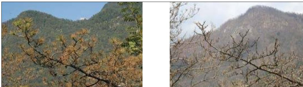
Slika 1: Črni bor ob reki Soči, na katerem je bila potrjena okužba z glivo Lecanosticta acicola – stanje poleti 2018 (levo) in že odmrlo drevo spomladi 2019 (desno)

Zanimivo je, da dosedanje raziskave glive v Evropi kažejo, da so najpogostejše in največje