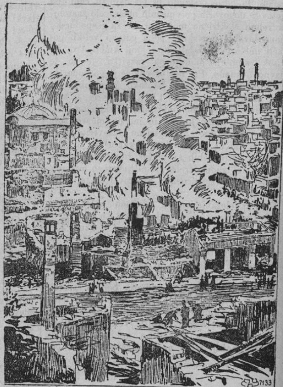
Die Brandruinen von Stambul