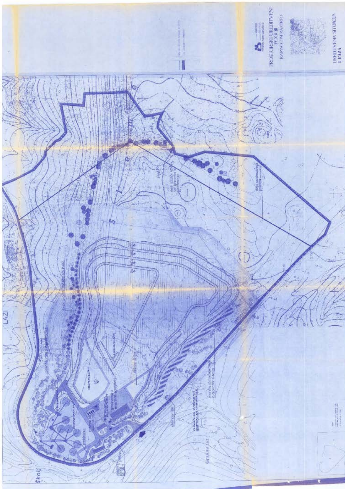
Priloga 3 Grafični del načrtovanih ureditev S-388, Prikaz urejanja EUP S-388 (list I in II)