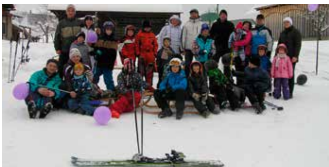
Čisto prava tekma za otroke se je odvila ob zaključku zimskih počitnic. Ker je vsaj kaj prispeval, je tekma uspela.

Ko ni več potrebno hoditi po hribu navzgor, se tudi v otroških glavah nekaj prestavi in sneg postane naenkrat bolj zanimiv od računalnika, telefona in vseh vrst i-pod(nov). Otroci dobijo voljo za smučanje. Sosed je poklical soseda, prijatelj prijatelja, znanec znanca in naenkrat je bilo na travniku polno smučarjev. Nekateri so po dolgih letih stopili spet na smuč, drugi so na smuč stopili prvič. Smučati se so naučili številni otroci. Malo zaradi pomoči učiteljev, malo zaradi medsebojnega spodbujanja in malo zaradi skakalnice, na katero si je želel vsak otrok.