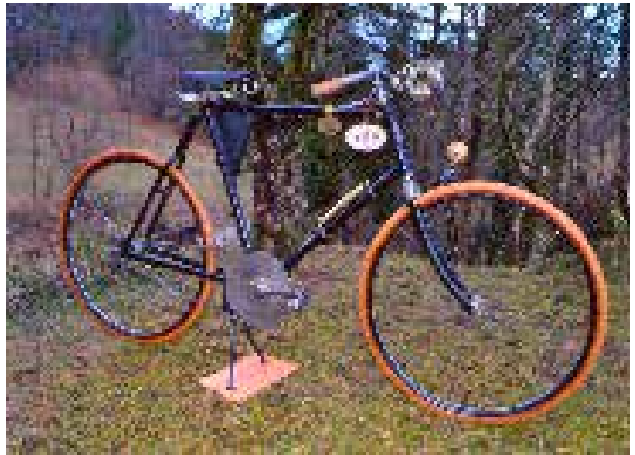
Športno kolo Steyr-Puch letnik 1905

Včlanjen sem v oldtimerski klub Večno mladi Šentjur. Sem ustanovni član tega kluba, ki deluje že 7 let. Včlanjenih nas je 60 somišljenikov in ljubiteljev tovrstnih starin. Znotraj kluba imamo kolesarsko sekcijo, ki šteje 14 članov. Vsi imamo kolesa izpred 2. svetovne