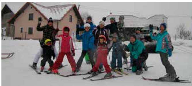
Skupen projekt poveže sosede med seboj, otroci prilezejo izza svojih računalnikov in se družijo - to je največja vrednost smučišča v bližini doma.

N a Mlakarjevem travniku v Laški vasi je bilo to zimo lušno kot že dolgo ne. Narava je postregla z obilico snega ravno takrat, ko so ga otroci najbolj veseli – v času zimskih počitnic. Pa bi kljub snegu ne bilo takega veselja, če se »ta stari« ne bi organizirali in postavili pravi vaški smučarski center. Iz golfa II in različnih delov je nastala spodobno delujoča vlečnica.