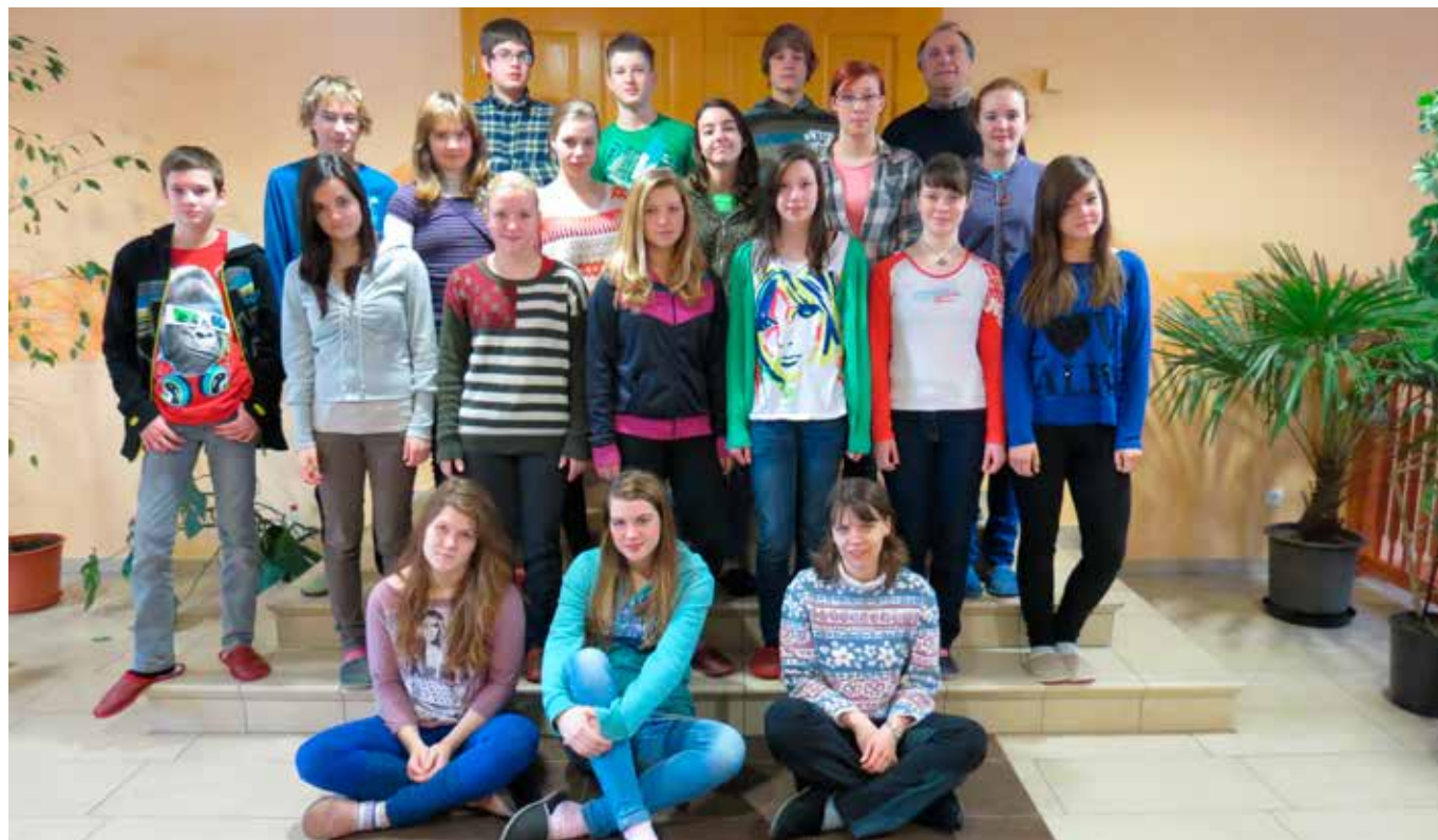
Birmanska skupina na duhovnih vajah

smo tudi staršem in ostalim župljanom približali vsaj delček našega duhovnega dogajanja. V soboto, 23. februarja, sta župnijsko dvorano kljub neugodnim vremenskim razmeram s