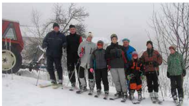
Na zgornjem Pečovju že več zim smučarje v breg vleče predelani obračalnik