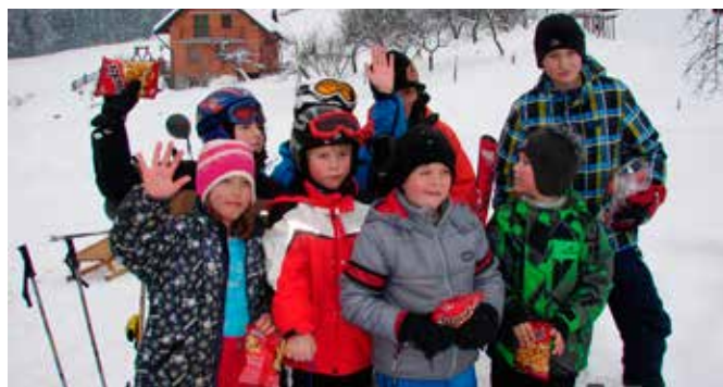
Največja konkurenca je vladala v kategoriji »Ko bom velik, bom Tina Maze«.

Vlečnica je odlično obratovala, samo kaj, ko je sneg kar naletaval in naletaval. Namesto »štanfanja« je v akcijo stopil mali rdeči traktor, ki se je z domiselnim priključkom za teptanje snega spremenil v ratrag.